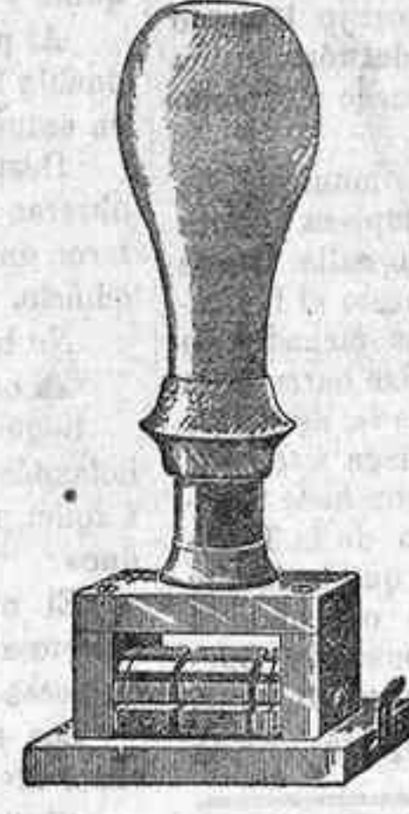
Fechaador en bronce

Adaptable á la clase de fechaador que se desee.