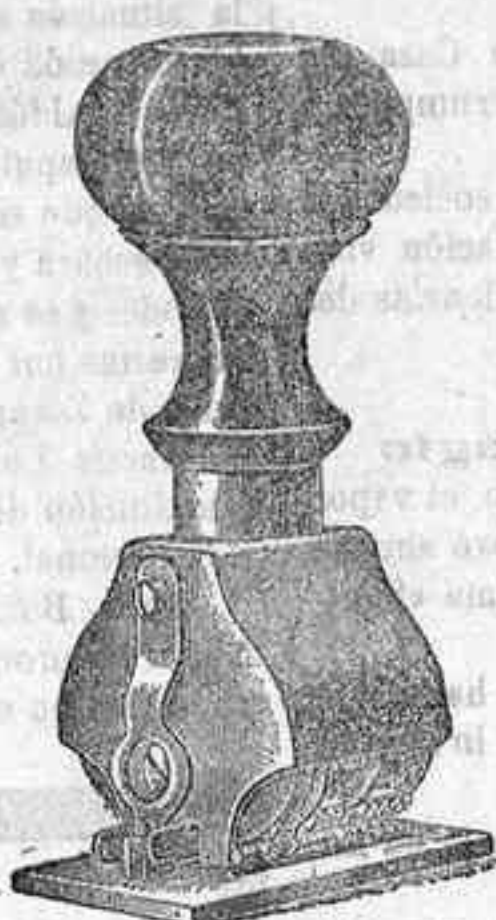
Fechaador en caucho

Sellos para franquicia postal con arreglo al R. D. de 23 de Septiembre 1908.