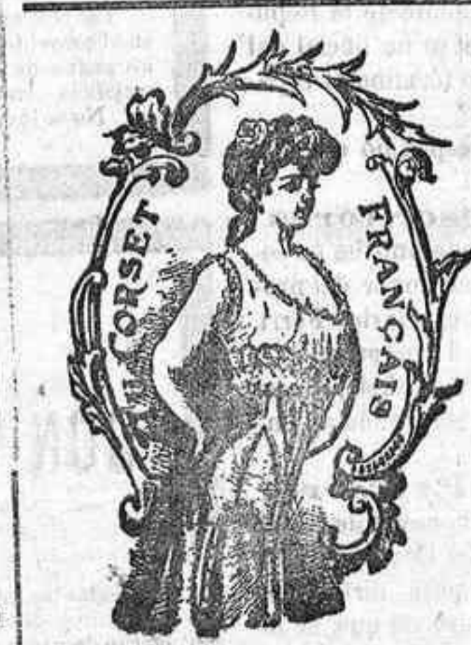
PLAZA DEL ANGEL, NUM. 8

NOTA.—También podemos servir otro sistema de fechaador más ordinario en 7 pesetas, con caja y accesorios. Todo pedido deberá venir acompañado de su importe, bien en letra de giro mutuo, sellos de correo ó sobre monedero. Los pedidos se servirán por correo, certificado.