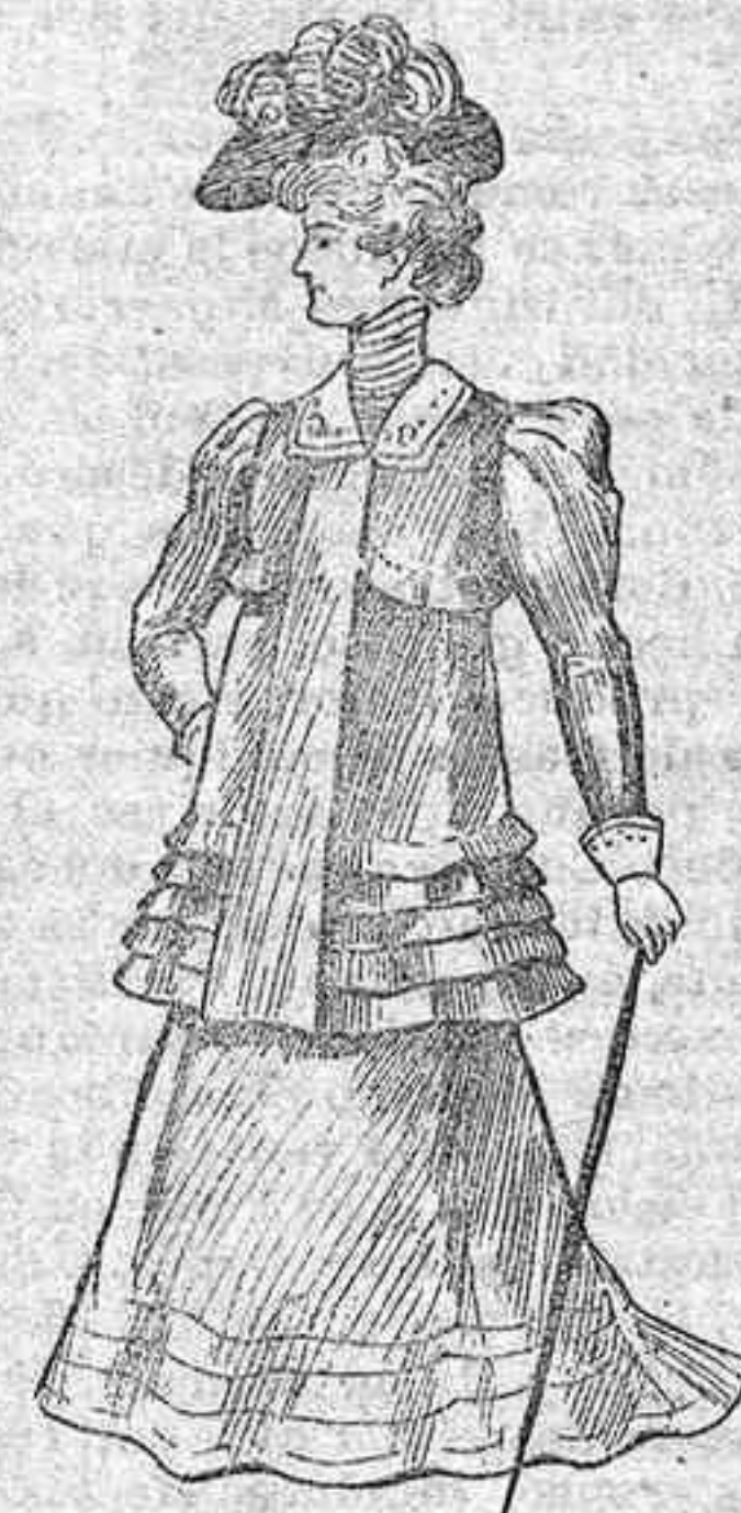
Abrigo llamado «escandinavo»

Es de fuerte paño marrón; marcado con seis divisiones, una al terminar el pecho y cinco al finalizar la prenda. Del caprichoso cuello (véase la parte derecha) pende una ancha cinta de color muy claro.