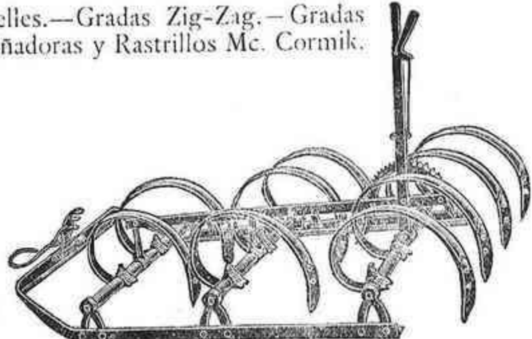
Gradas de muelles