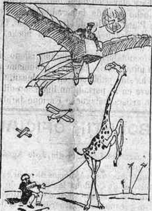
Imposiciones del progreso ó el futuro perro lazarillo.