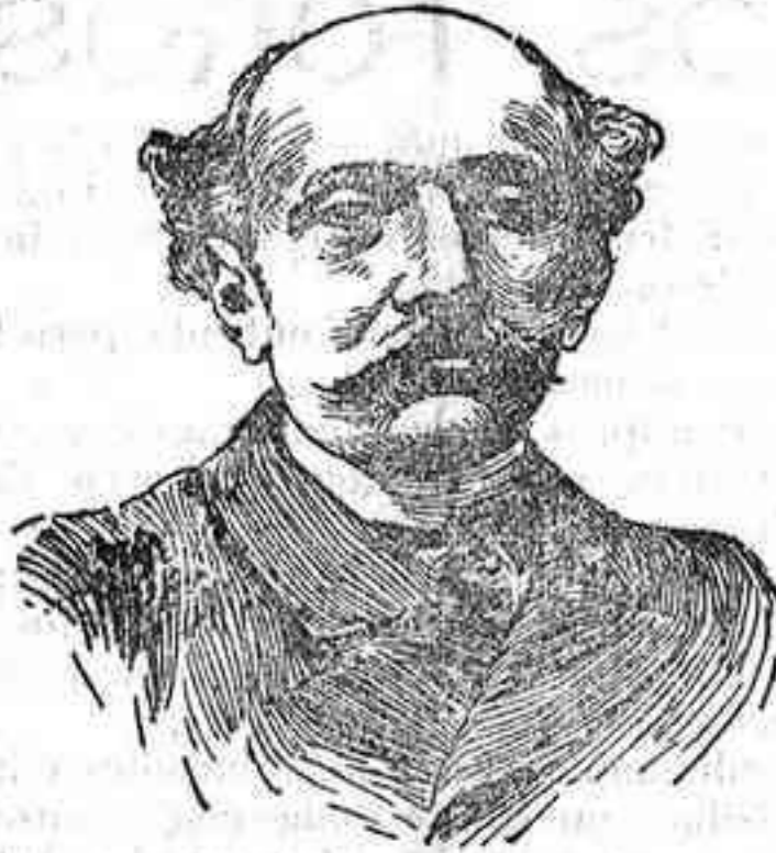
Don Eduardo Dato

El puesto que en la Academia de Ciencias Morales y Políticas quedó vacante á consecuencia de la muerte del ilustre don Juan Valera, ha sido ocupado por el insigne prohombre don Eduardo Dato Iraldi, cuya recepción quedará registrada con imborrables caracteres en los anales de la corporación que por muchos motivos podemos llamar doctísima.