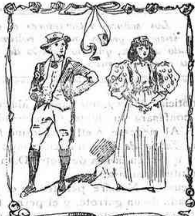
Irlandeses en traje de sociedad

A estas encantadoras fiestas asisten los niños luciendo vistosos trajes, confeccionados por sus mamás ó por lo menos inspirados por ellas. Como es lógico, establécense entre las mamás un pugilato muy loable por lograr que su hermoso retoño, el que despierta en ellas sus más doradas ilusiones, sea el que en la «matinée» luce el traje más bonito y original, la nota más sobresaliente del concurso de bellezas infantiles.