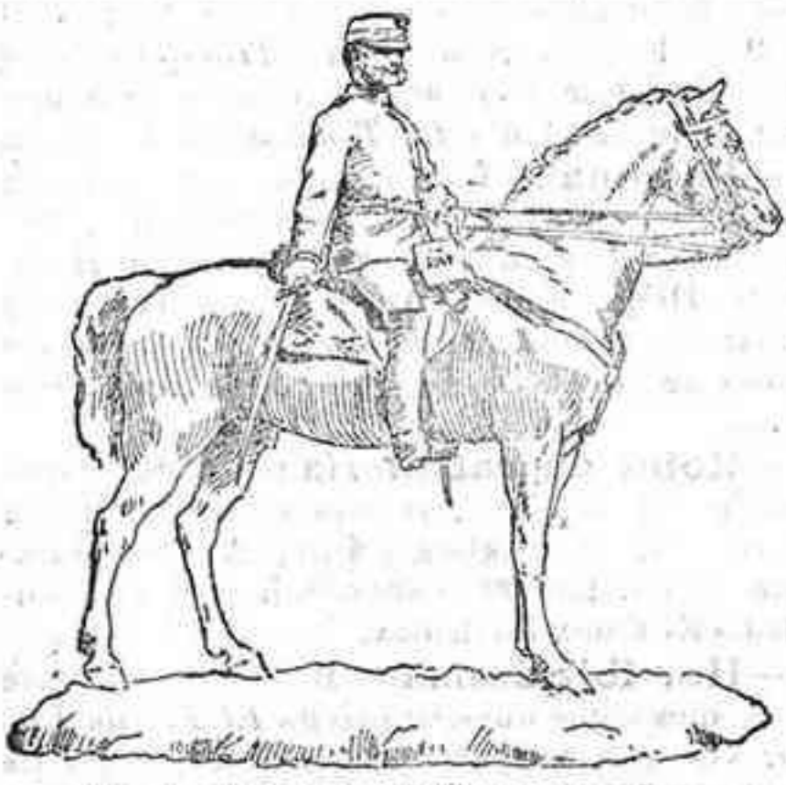
Estadua de Alfonso XII, modelada por Benlliure, que corona el monumento que en breve ha de inaugurarse en el Parque del Retiro.