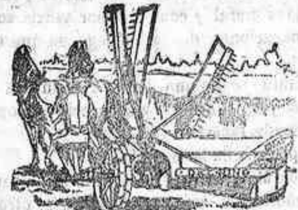
Segadora agavilladora DEERING

ARADOS Brabant MELOTTE y RUD-SACK . CULTIVADORES Planet.— GRADAS de muelle. SEMBRADORAS "San Bernardo", con cajón. DISTRIBUIDORA de abonos.— TRITURADORES de Grano— Abono y CORTA-FORRAJES .