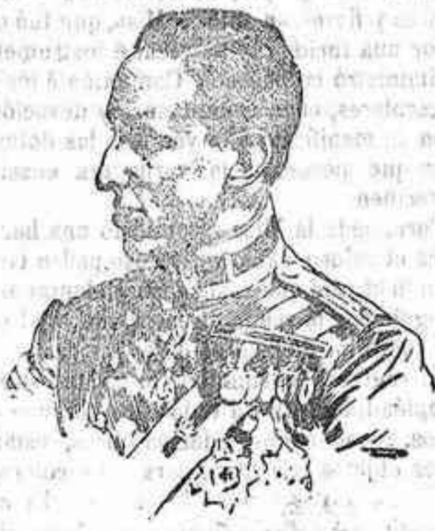
S. M. el Rey don Alfonso, padrino del nuevo infante.

Con un poco de gusto y de habilidad, parece un juego poner en obra las telas, los adornos que se hallan en condiciones tan ventajosas. ¿Dispones de un mediano presupuesto para toilette ? Pues gracias a los buenos patrones, se vestirá con elegancia y cuidado, dirigiéndose por sí misma, con ayuda de una doncella de mediana disposición. Cuántas cosas, examinando su guardarropa, pueden ser utilizadas, renovadas, refrescadas, que se juzgaría en dar a la modista. Las mamás que tienen muchas hijas pueden dedicarlas con poco gasto a copiar por sí mismas los modelos que les agradan, con ayuda de un buen patrón. Los cursos de corte están muy en moda. Pronto se adquiere la práctica necesaria.