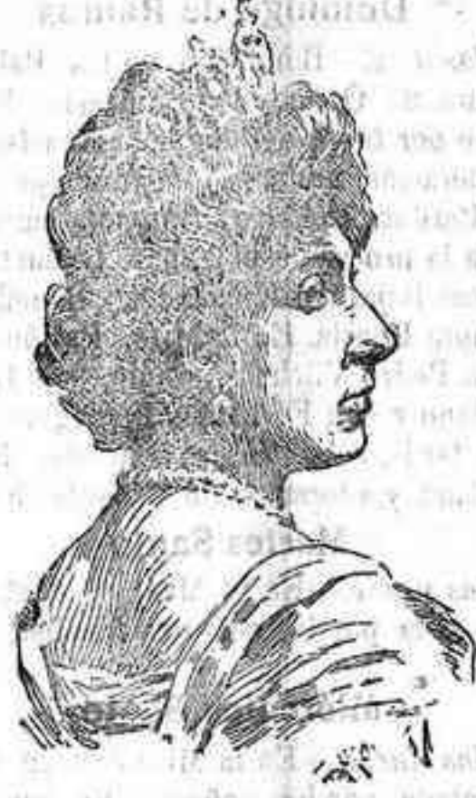
S. M. la Reina doña Victoria, madrina del nuevo infante.