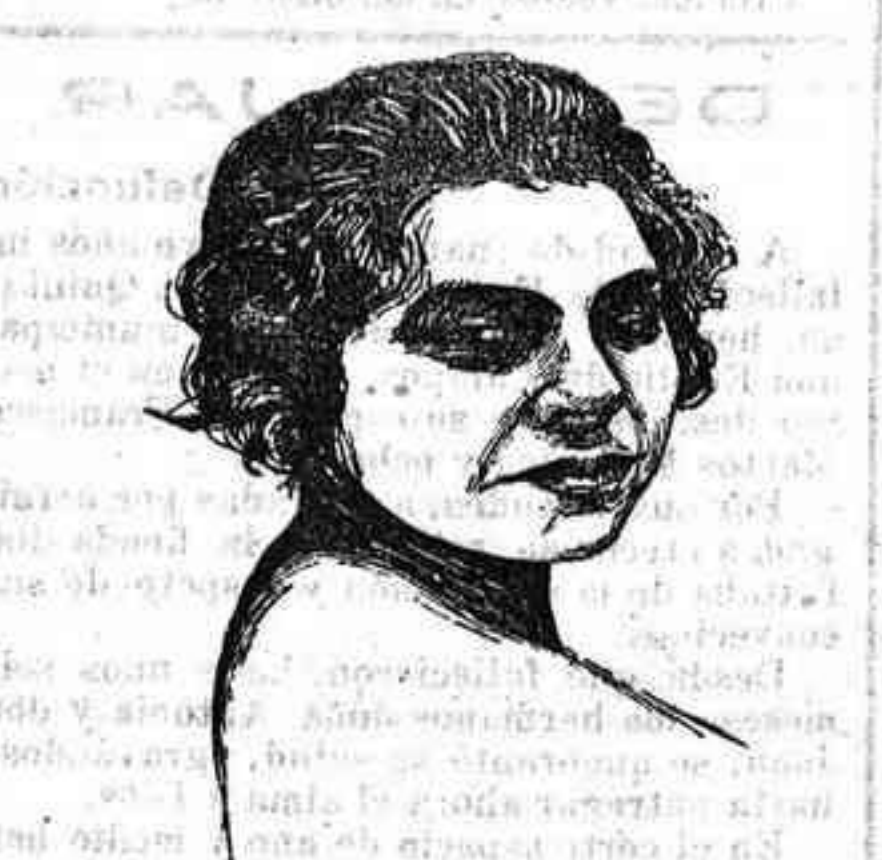
La celebrada actriz Catalina Bárcena, que al frente de su compañía está obteniendo grandes éxitos en el Teatro de Eslava, de Madrid.

Ignórase quienes sean los autores del hecho.