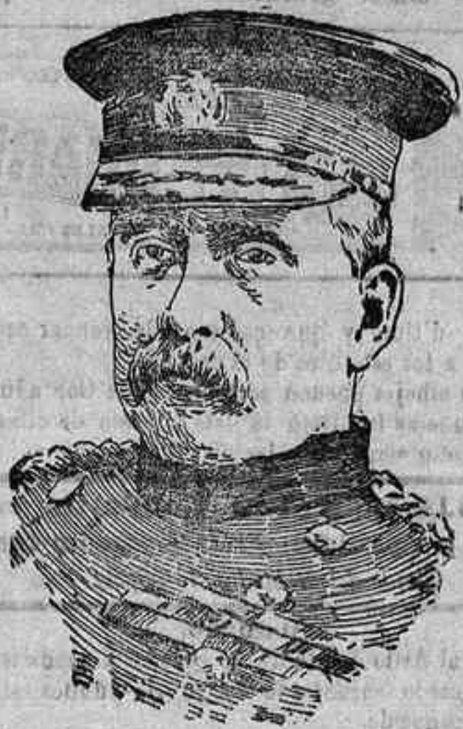
El mariscal vizconde French, que ha sido nombrado virrey de Irlanda en premio a los méritos contraídos en el frente de batalla en Flandes.

Resumen del número correspondiente al día 4 de Junio. Ministerio de la Gobernación.—Real orden circular aclaratoria del decreto de amnistía. Presidencia del Consejo de ministros.—Circular de la Comisión general de Abastecimientos dictando reglas para la inspección de las cosechas de cereales antes de que se proceda a su recolección. Estadística sanitaria.—Resumen de las principales enfermedades infecciosas e infecto contagiosas ocurridas en esta provincia durante el mes de Febrero último. Ayuntamiento.—Conclusión del extracto de los acuerdos tomados por el de Nueva Carteya en sus sesiones del primer trimestre del año actual.