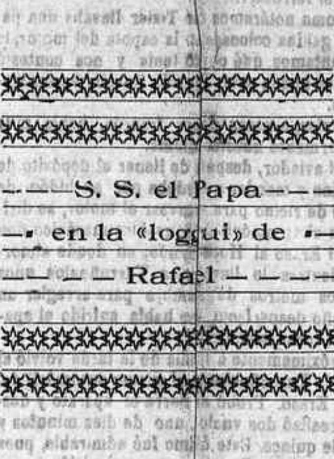
S. S. el Papa

De todo ello resulta que, mientras en la zona infundada por el Atlántico las lluvias alcanzan