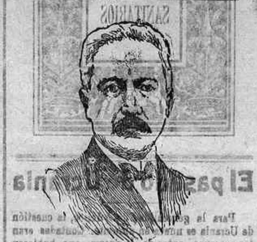
FIGURAS DE LA GUERRA.—El presidente del Consejo de ministros italiano, que en breve llegará a Londres para asistir a la conferencia interaliada.