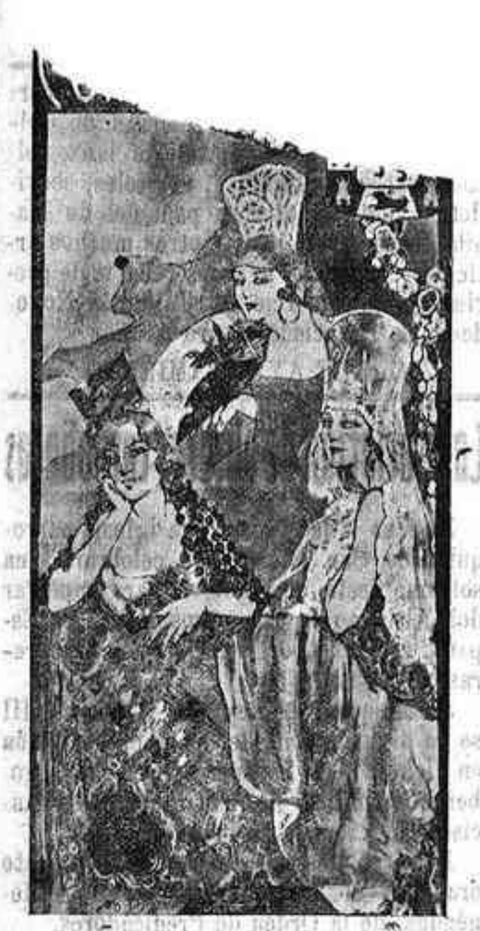
Cartel de la Feria de Nuestra Señora de la Salud, pintado por don Manuel León Astruc