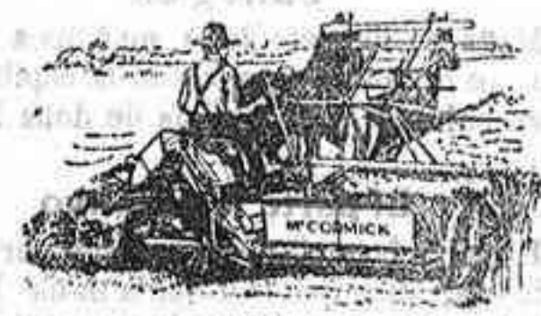
Alisadoras Macormick — ULTIMA PERFECCION —