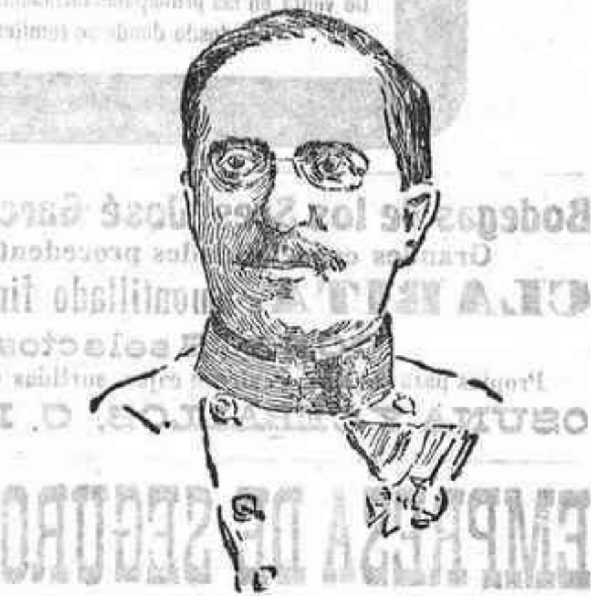
El general Arz Stranzemburgo, nuevo jefe del Estado Mayor austrohúngaro.

Otro caballo se salvó a nado, llegando a la escalera que conduce al piso superior y, con grandes trabajos, consiguió ganar veinte escalones, penetrando en una habitación del segundo piso, en la que se encuentra hasta tanto que se limpie el fodo de la planta baja del edificio y se le pueda llevar a la cuadra.