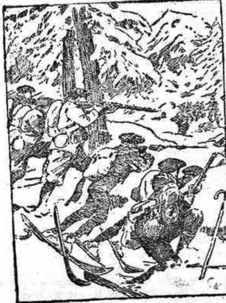
Cazadores alpinos franceses tiroteándose con una avanzada teutona.

En los Vosgos centrales, donde el termómetro marcó últimamente 15 grados bajo cero, los