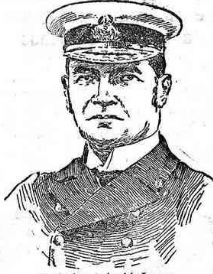
El almirante inglés Lowry