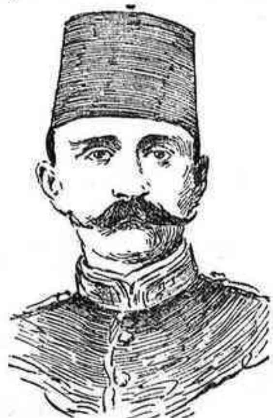
El príncipe Hussein Kemal

La presencia del ejército turco en el Canal de Suez entraña para Inglaterra un peligro muy grande, aun mayor que el que pudiera derivarse de la interrupción de esa vía que la pone en comunicación con sus colonias de la India, y ese peligro consiste en que se hace más que probable la rebelión de Egipto. Cuando abrogándose atribuciones que no le pertenecían, puesto que el verdadero soberano del Egipto es el Sultán de Turquía, decretó la deposición de Abbas II de su cargo de Jédive, tuvo buen cuidado de