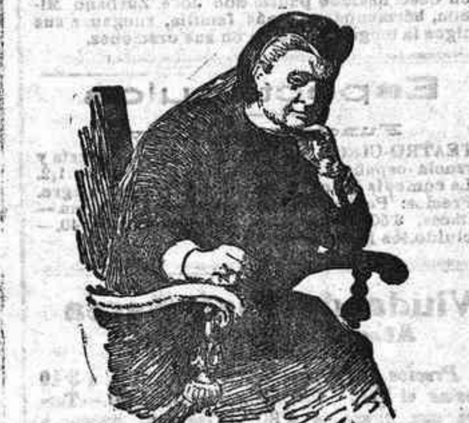
La reina Olga, viuda de Grecia, que ha llegado a Can-Tevat (Costa Azul) donde pasará el verano con sus hijos el príncipe Jorge y la Gran duquesa María.

Temas que corran desordenados. El Jefe de la Guardia civil de aquel punto ha pedido el envío de fuerzas. En Bujalance, Cabrera y Espinosa continúan sin solucionar la huelga de los campesinos. En el Corpio se han conseguido ponerse de acuerdo los patronos y obreros para concertar las bases del trabajo. En Nueva Cartaya ha quedado resuelta la huelga de trabajadores del campo.