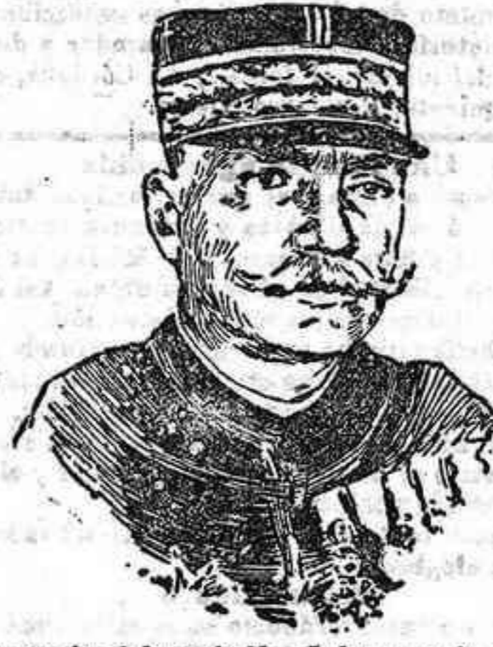
El mariscal francés Mr. Joffre, que ha llegado a Madrid.

Respecto a la misión de los miembros de las Federaciones y Sindicatos dijo que era deprimante la actuación de los que no asisten a las juntas y piden sin causa justificada que se les tengan por presentes y solicitan que tales miembros fuesen elementos que vivan y trabajen.