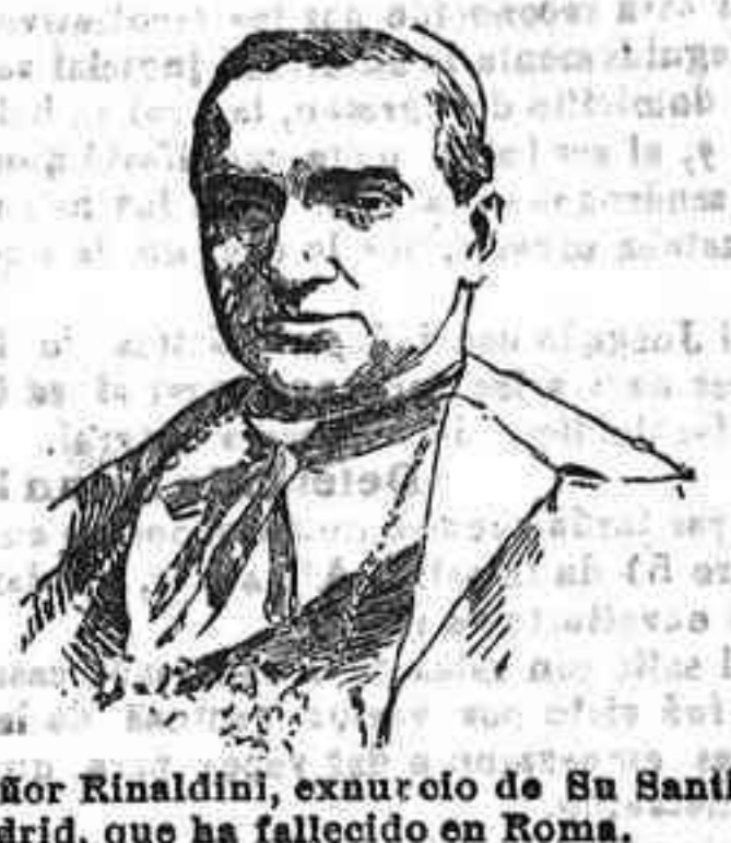
Monseñor Rinaldini, excurato de Su Santidad en Madrid, que ha fallecido en Roma.

Subscripción en Córdoba: Trimestre, 5 Ptas. Semestre, 10 Ptas. Año, 20 Ptas. En el extranjero, 25 Ptas. Año, 50 Ptas. Paga adelantada. Número suelta, 10 céntimos.