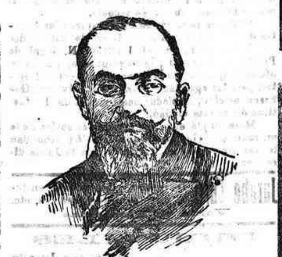
León Bourgois, notable político francés, que preside el Consejo de la Sociedad de las Naciones.