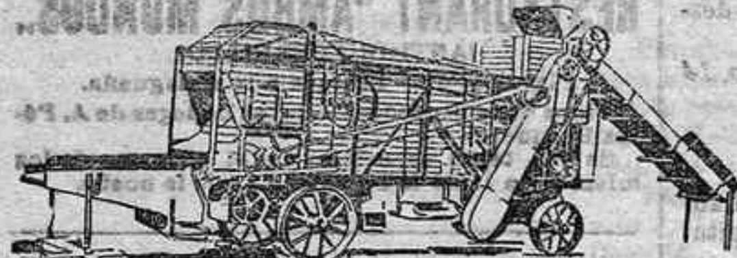
Trilladora TRIUNFO GRANDE.

Sucursal de Córdoba Conde del Robledo, n.º 1