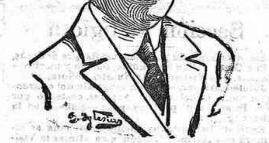
El conde de San Luis, exministro de Abastecimientos, que ha sido nombrado comisario regio del Canal de Isabel II.