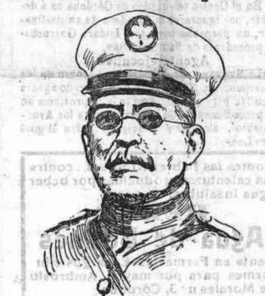
El general Huerta, dictador mejicano.

El general Huerta, dictador mejicano, los para el bienestar de sus hijos, arranca en todas partes, en España sobre todo, palabras de conmiseración, reveladoras del dolor que en los corazones sanos produce esa fratricida lucha. Pues bien, la Unión Iberoamericana, haciéndose eco del sentir general, ha hecho un llamamiento a cuantos pueden cooperar en tan humanitaria misión para que, separados o colectivamente, se procuren los medios que condonan a que depongan sus armas los luchadores, a fin de que en Méjico vuelva a reinar la paz que tantos beneficios reporta a los pueblos.