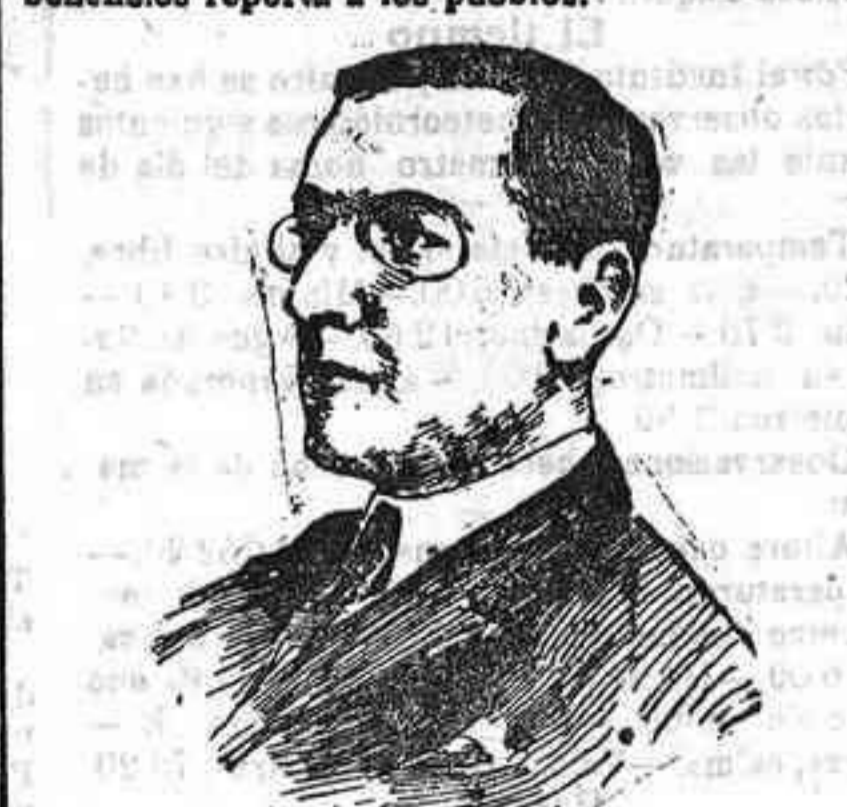
El presidente yanqui Wilson

Para efectuar obra tan altruista, la Unión ha comenzado por dirigirse a todas las sociedades pacifistas de Europa y América, solicitando su cooperación, y dentro de breves días será celebrada, por iniciativa de ella, una reunión de los más eminentes representantes de las Ciencias, las Artes, la Política, la Industria y el Comercio que en Madrid residen, para acordar los medios a que deben recurrir para que cese en Méjico la lucha que destronsa su vitalidad. ¡Qué hermoso triunfo para España, al por iniciativa de ella llegar a restablecerse la normalidad en Méjico! La victoria es difícil, más que por la resistencia que pueden oponer los hombres que figuran a la cabeza de federales y constitucionales, a acordar entre sí las bases de un pacto que ponga término a la guerra, sin que haya vencedores ni vencidos, por las influencias que ha de poner en juego para estorbarlo el verdadero culpable de tan atroz lucha, el que la alimenta y mantiene sin exponer nada, ni aun los millones que ha empleado y emplea para armar a los revolucionarios.