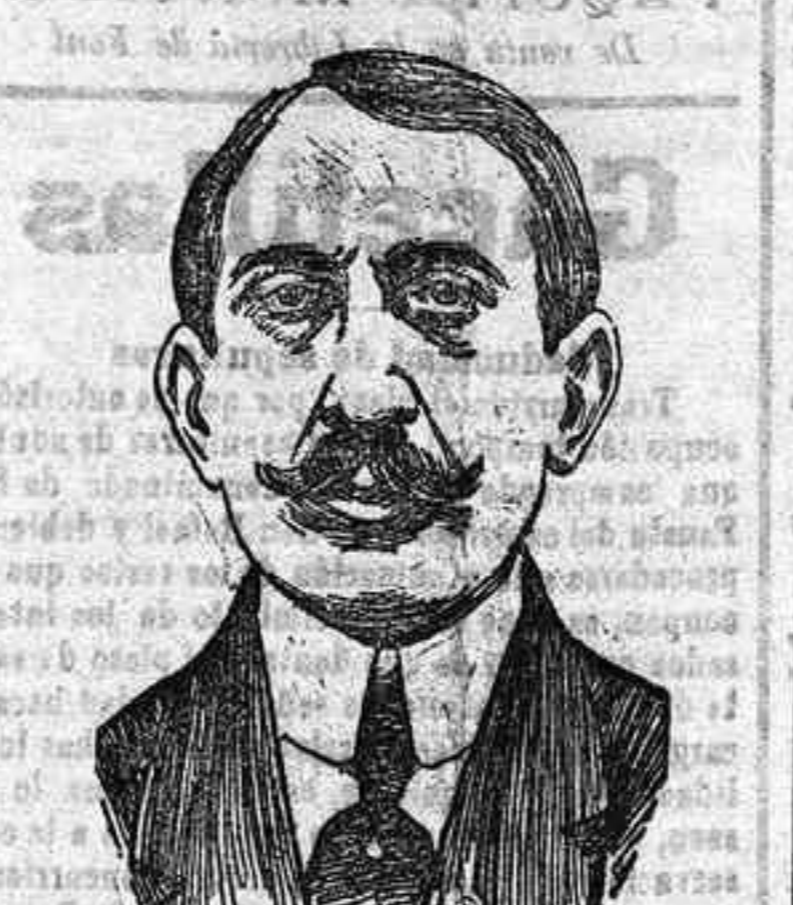
El Doctor Sergio Voronoff, descubridor del injerto de las glándulas intestinales para la curación de la vejez.