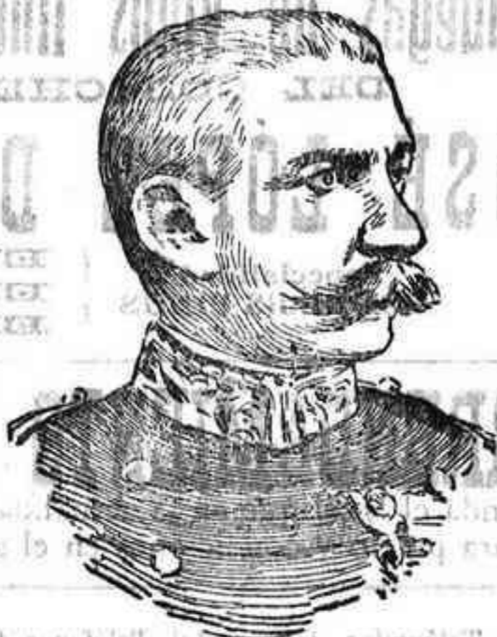
El general Lyautoy, nuevo ministro de la Guerra francés.

La Administración de este periódico ruega a los señores suscriptores que devuelvan ejemplares, que lo hagan sin quitarles la faja, para poder saber su procedencia.