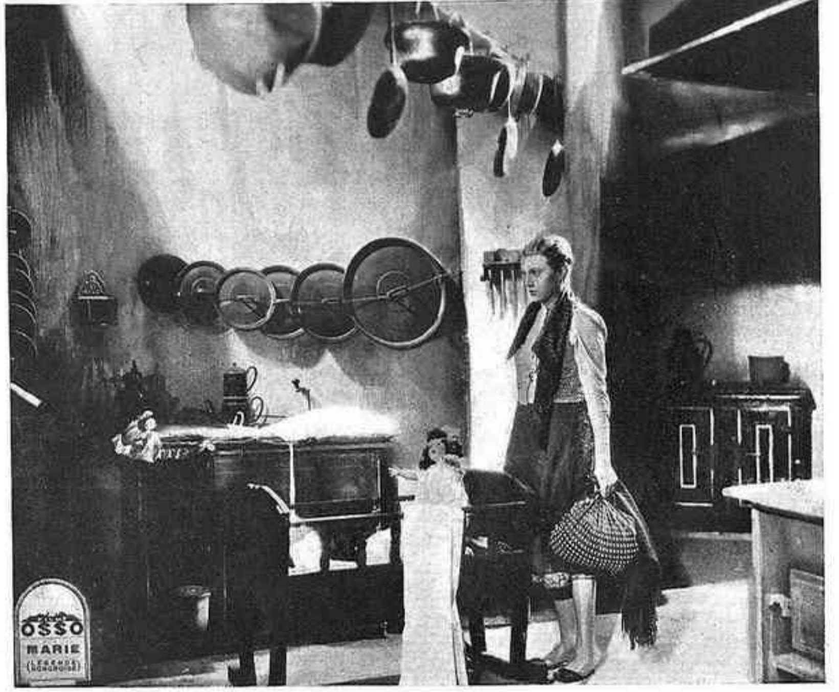
«Maria», llegenda hongaresa de Paul Fejos

Joan Crawford balla d'una manera veritablement engrescadora en el seu film Ànima de dansarina . Llàstima que de fet, balli poc! Ella és, com a dansarina, i més encara