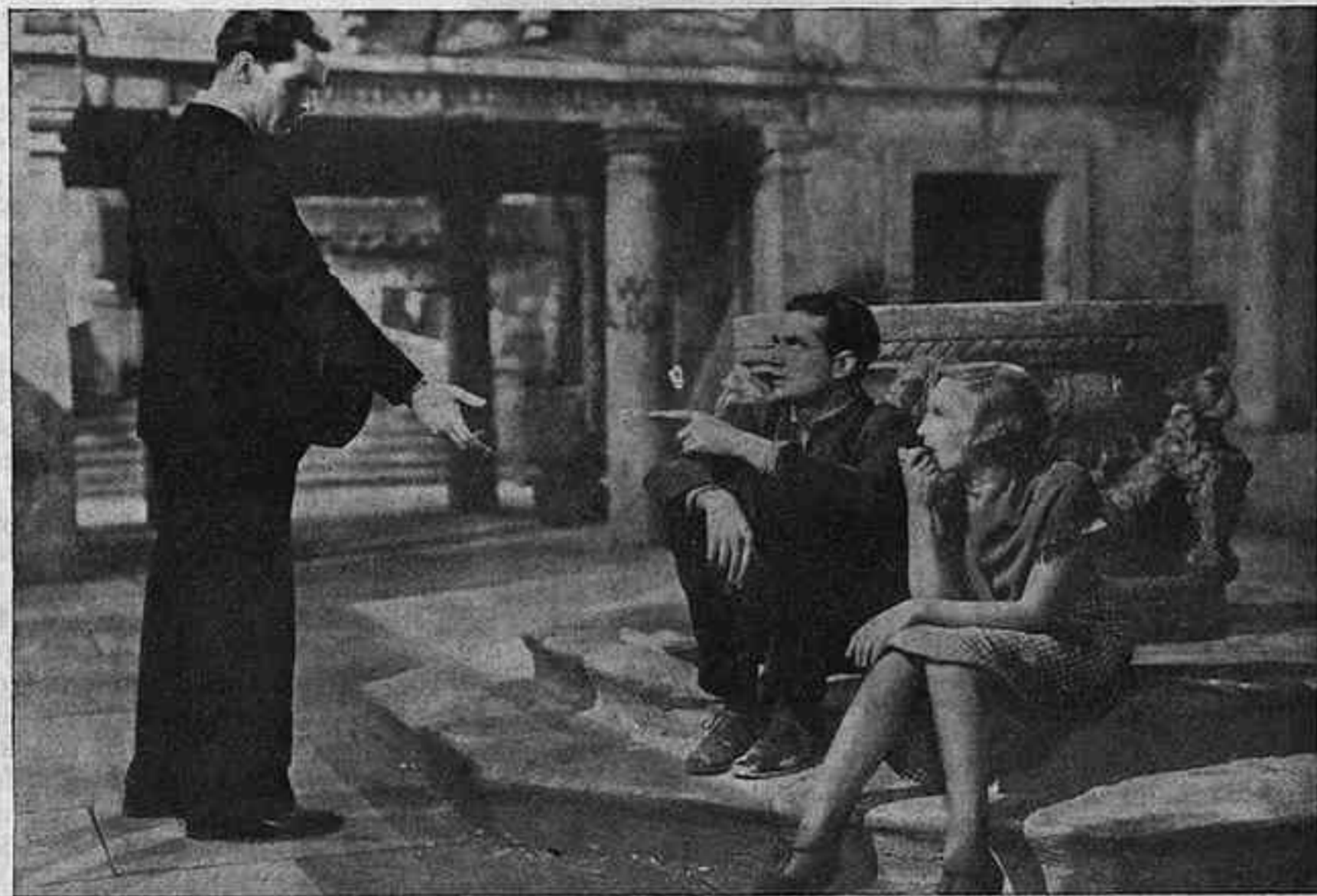
Gemma i els germans Sanger a Venècia. (Del film «No em deixis»)

hom ha vist el darrer film de Charlot. L'heu vist, no és això? I potser més d'una vegada! En teniu la impressió fresca, recentíssima. Doncs bé; és ara, entenem, que pot entrar-vos el desig de veure un film vell de Charlot, un d'aquells films ja quasi oblidats, i de veure'l naturalment, amb confort i en bones condicions de visualitat. Això és el que hem pretès d'assegurar. Cadascú, que pensi després el que vulgui d'aquesta confrontació.