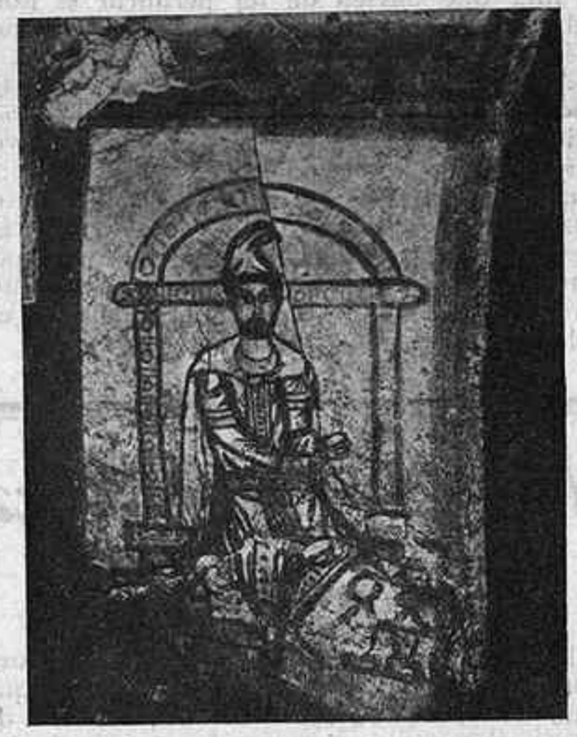
Figura de Dura Europos representant probablement Zoroastre

coberts ara en un llogarret de la Xina del Nord són indubtablement els del lloc de la fabricació de l'autèntic chien-yao. Les peces que s'hi troben són a milers, totes elles de reuig, segons les exigències exagerades dels antics ceramistes de la Xina, però en rigor de veritat, totes les peces, adhuc les deformades o fallides, resulten meravelloses pels ceramífils d'avui. No totes les peces