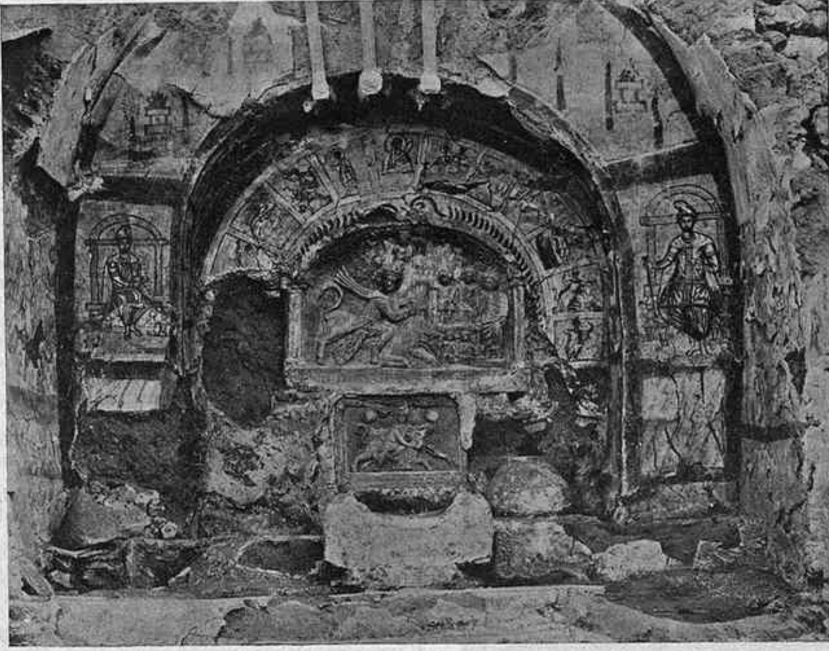
El santuari mitraic de Dura Europos

de llebre, a causa de la semblança de color i de qualitat que té l'esmail que la cobreix amb el platge de la llebre. D'aquesta ceràmica se'n coneixien sols les imitacions dels períodes posteriors al de la fabricació del chien-yao, que és el període corresponent al de la dinastia Sung (960-1227). Així i tot la imitació era estimadíssima i literalment pagada a pes d'or, a causa de la seva bellesa i de la seva raresa. Els testars des-