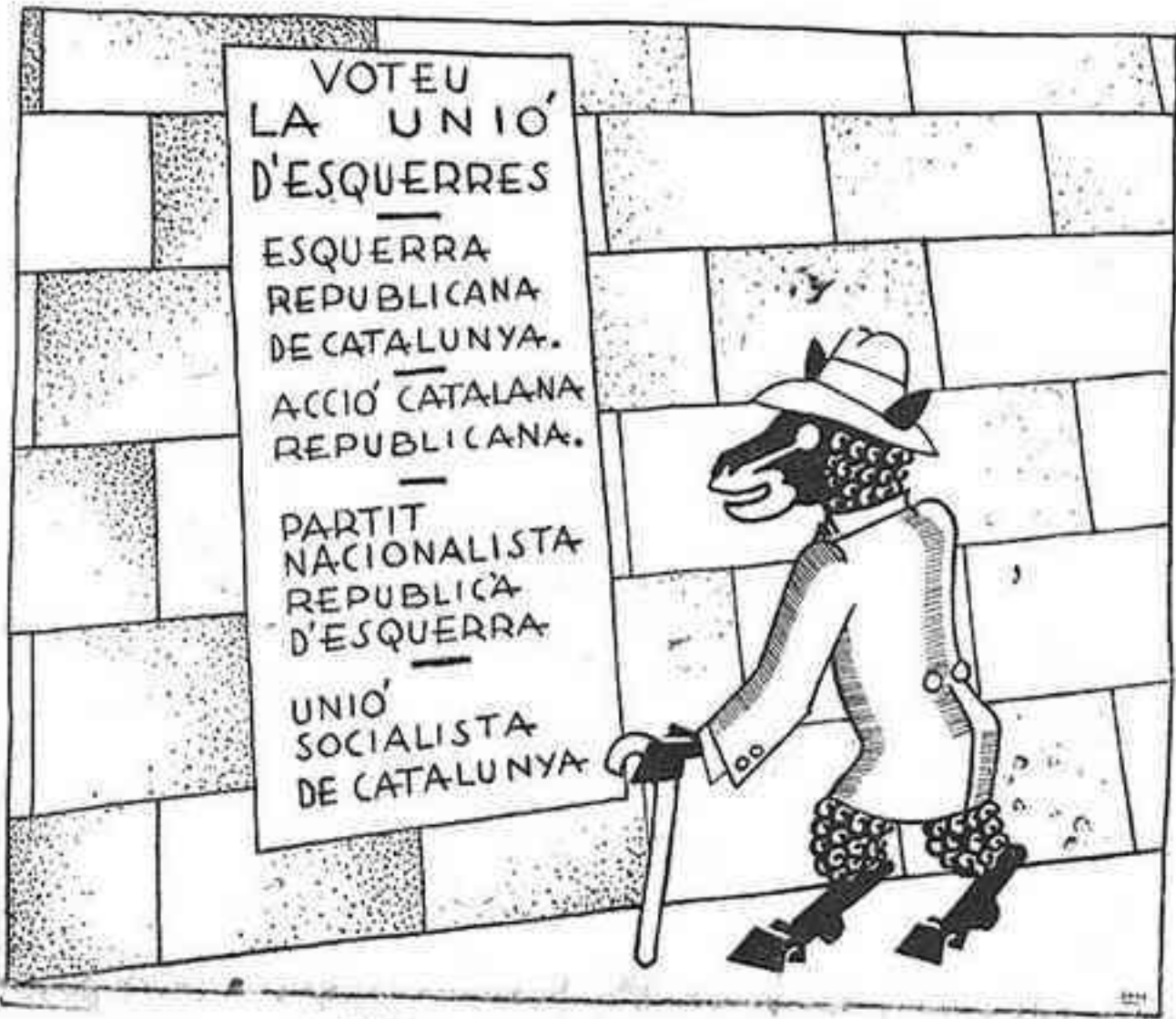
INTERESSOS SAGRATS El Be. — Si no fos tan republicà, quin tip de riure ens hi fariem!...

Ell aconseguí que Alba parlés com a republicà; ell aconseguí que Primo de Rivera Jr. victorregés Catalunya; ell aconseguí que la Lliga aclamés la República; ell aconseguí que radicals i socialistes s'entenguessin un cop a la vida i que un diputat de Gil Robles cridés d'un cop mori Catalunya. Aconseguí tant, que aconseguirà que les esquerres guanyin les eleccions. I és que les dretes no varen veure, quan l'agafaren de mascota, que era una mascota invertida en tots els sentits de la paraula, i que, natural-