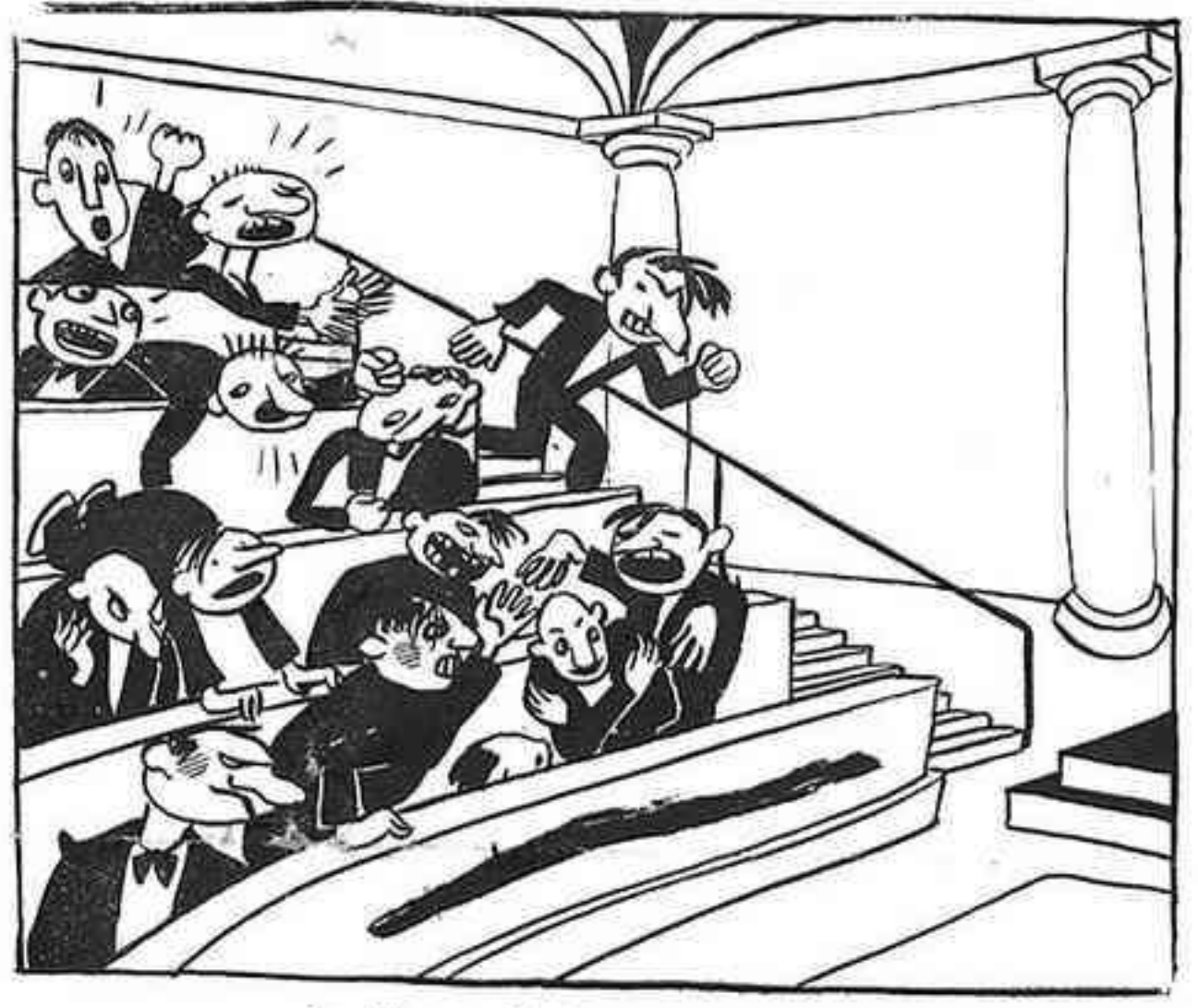
Sessió necrològica en la realitat