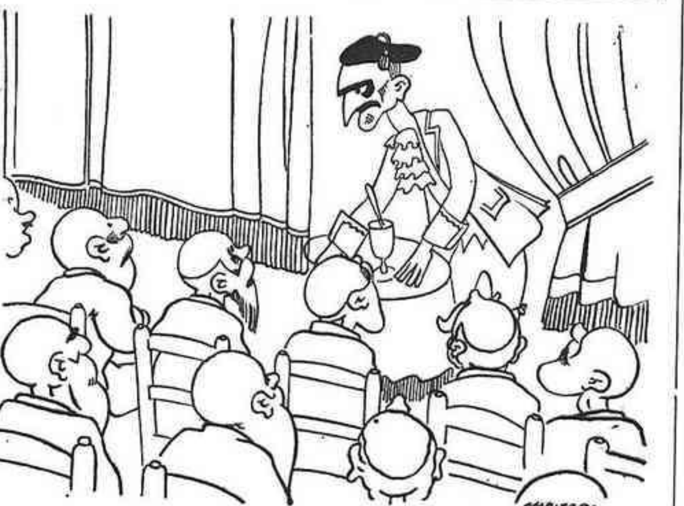
LES GRANS FRASES

Cambó. — I jo us dic que les eleccions les guanyarà qui tingui més vots! Un del públic. — Si totes les seves profecies haguessin estat com aquesta, s'hauria estalviat molts mals de cap.