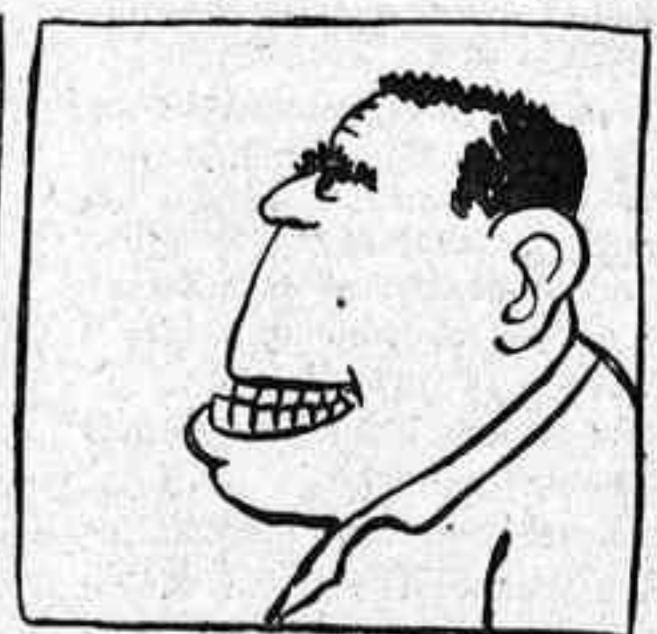
En Grisó vist de perfil