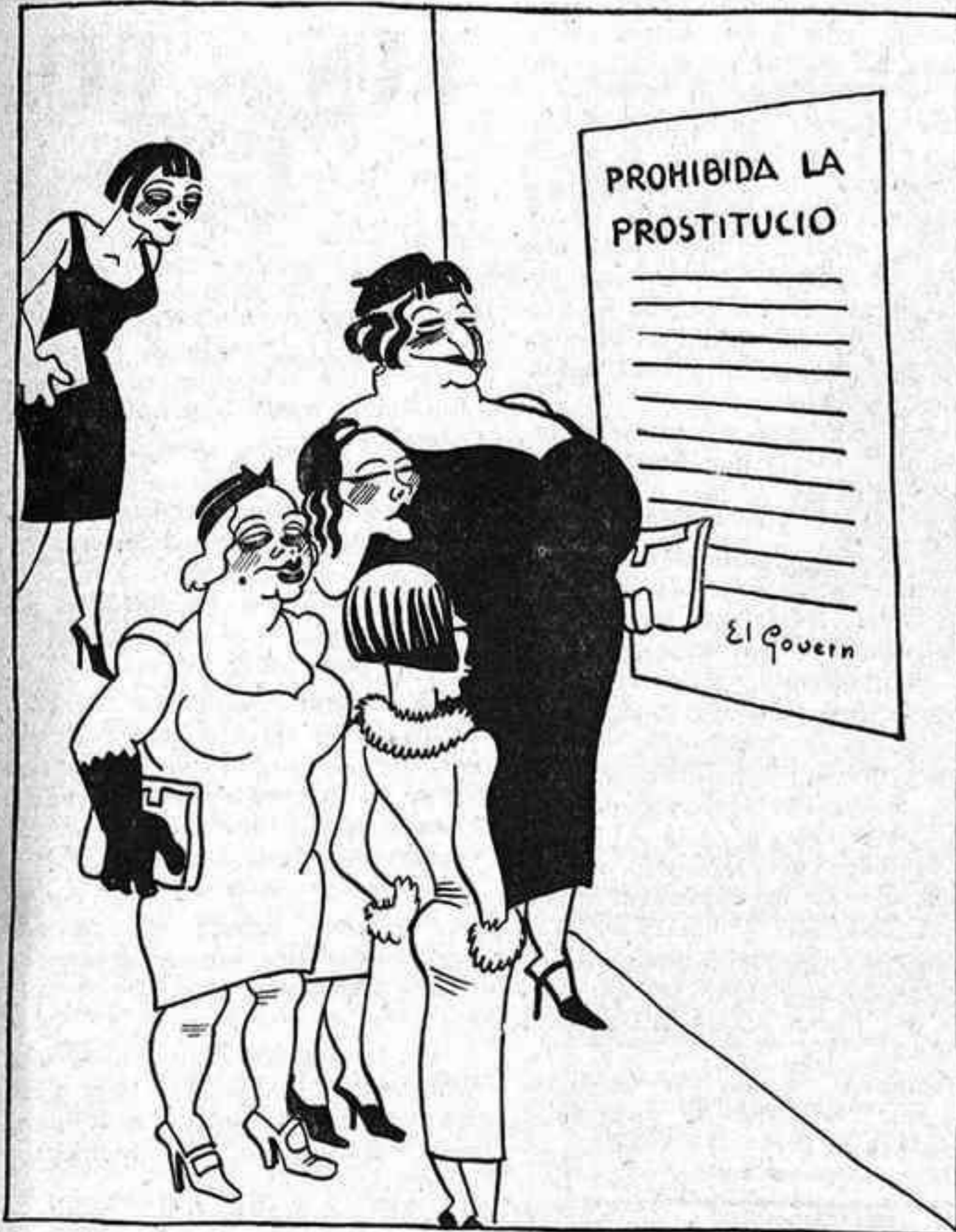
—Nosaltres sí que serem ciutadanes de segona classe!