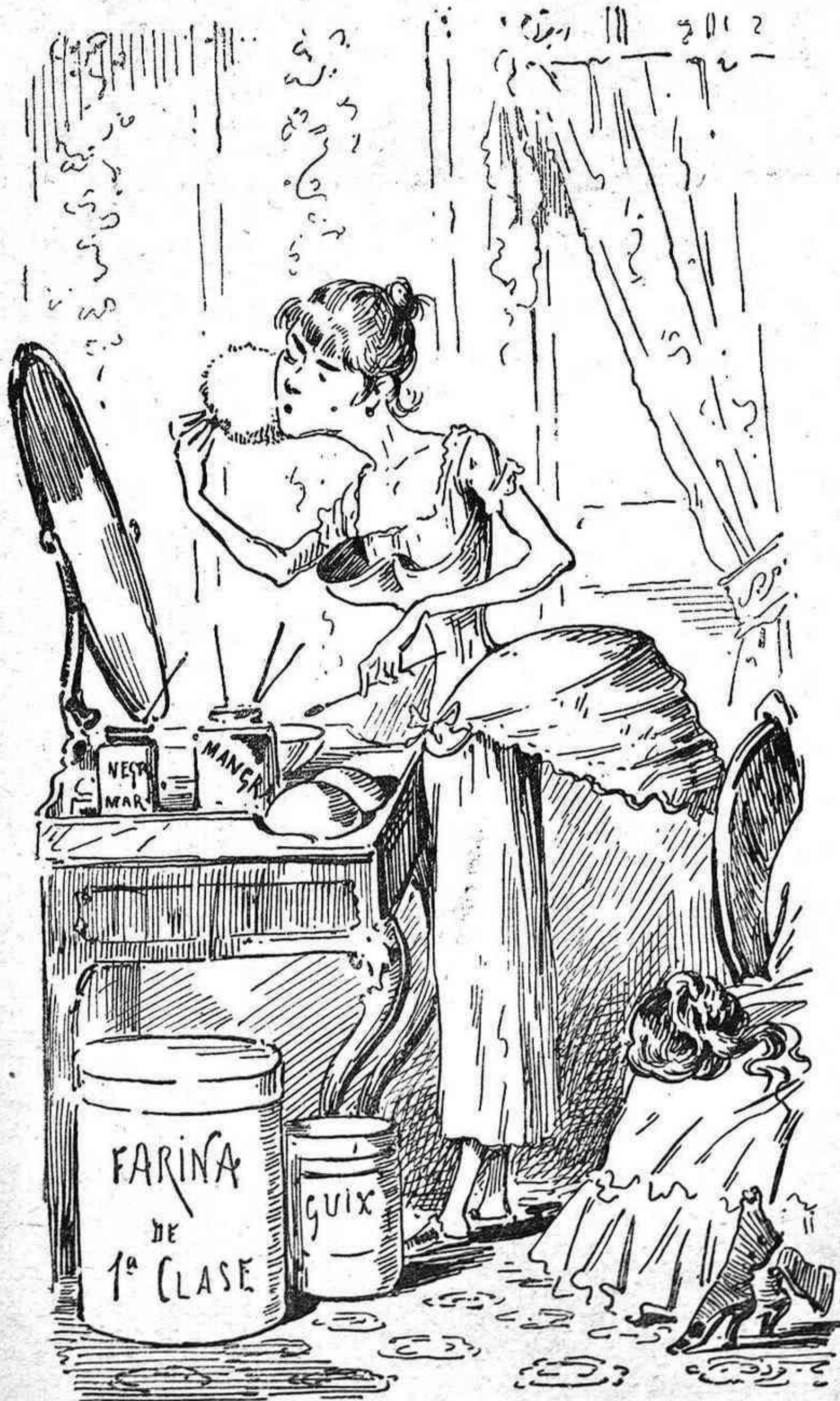
Lo que 's véu.