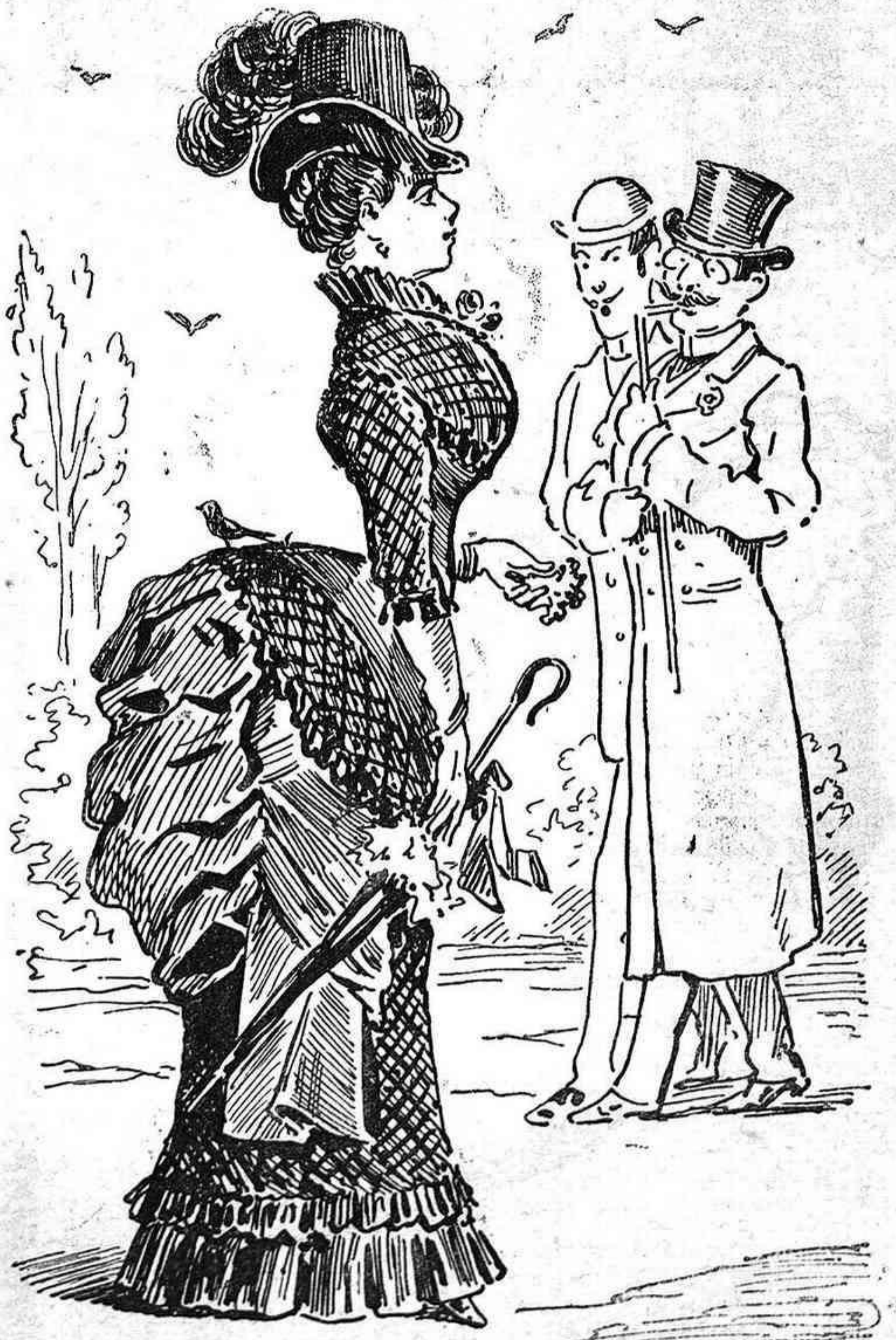
Lo que no 's véu.