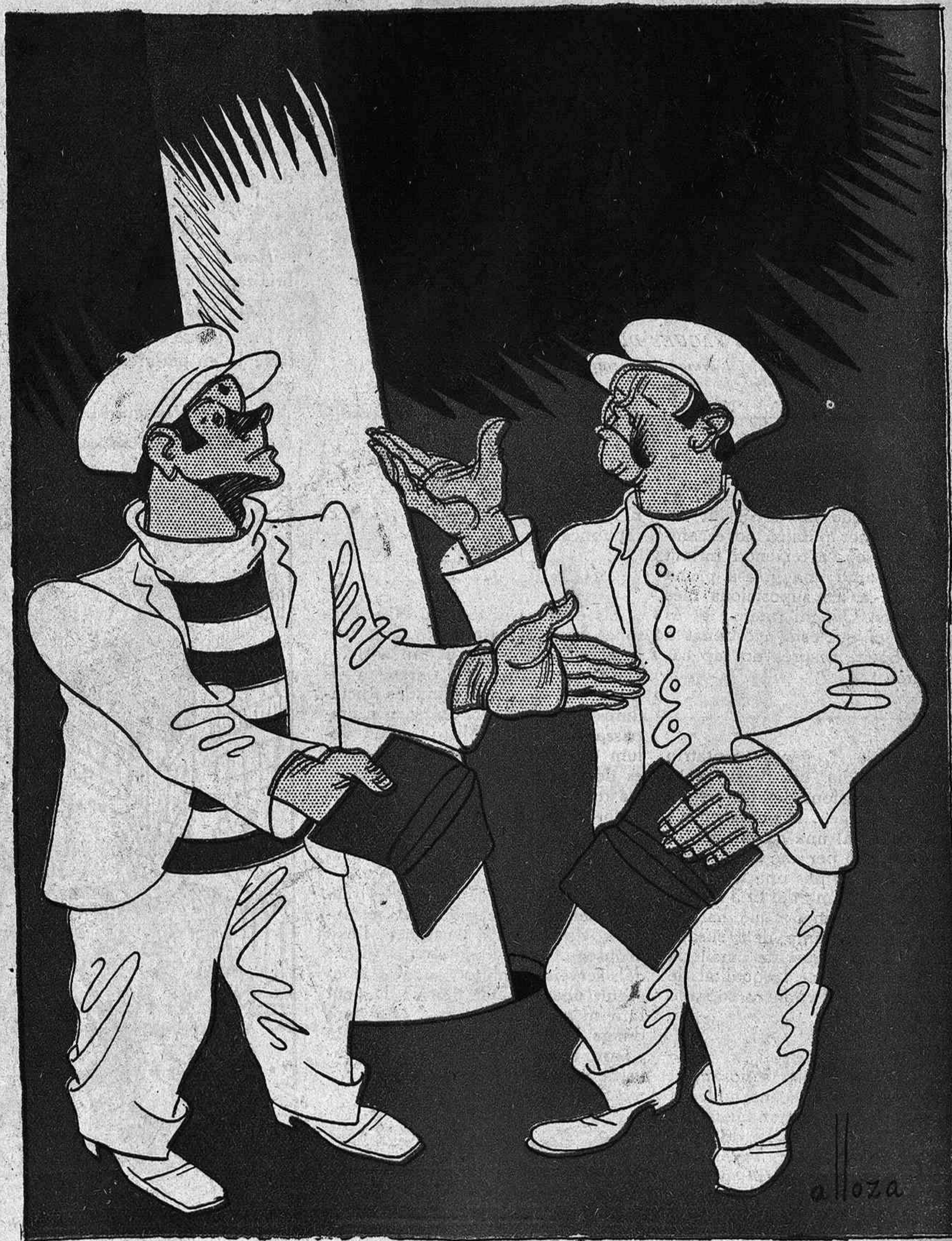
L'EMILIANO AL PARALLEL