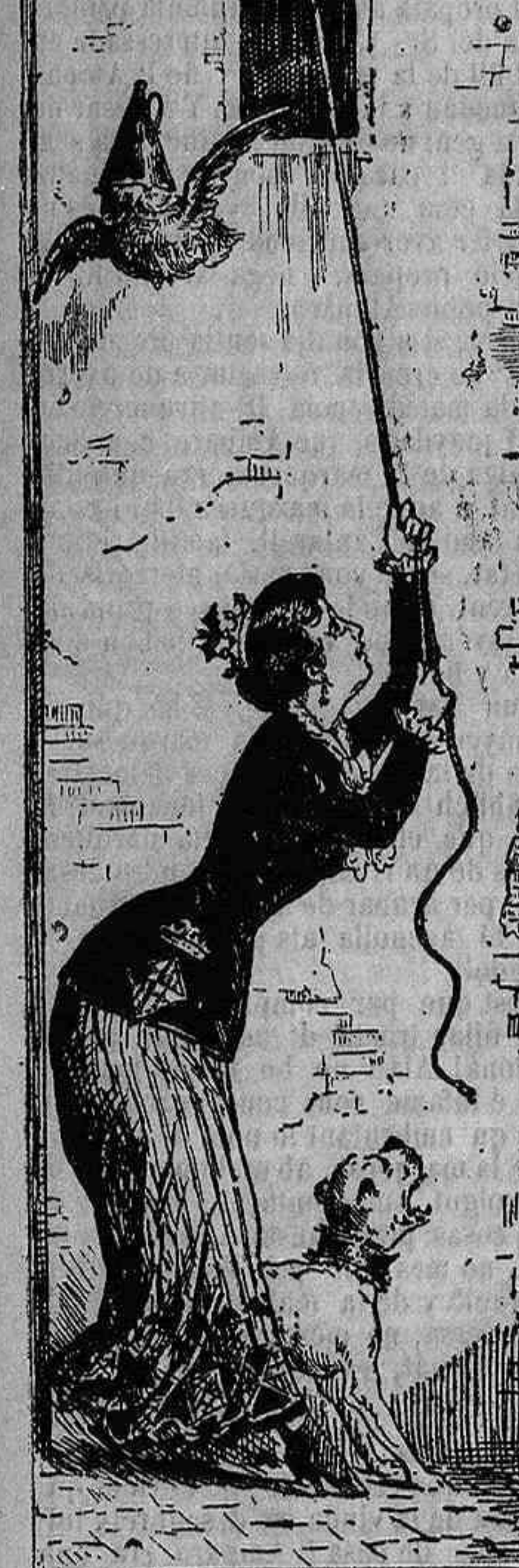
A EL DILUVIO.

Fora de Barcelona, cada trimestre: Espanya 8 rals. Cuba y Puerto-Rico, 16.—Estranger, 18.