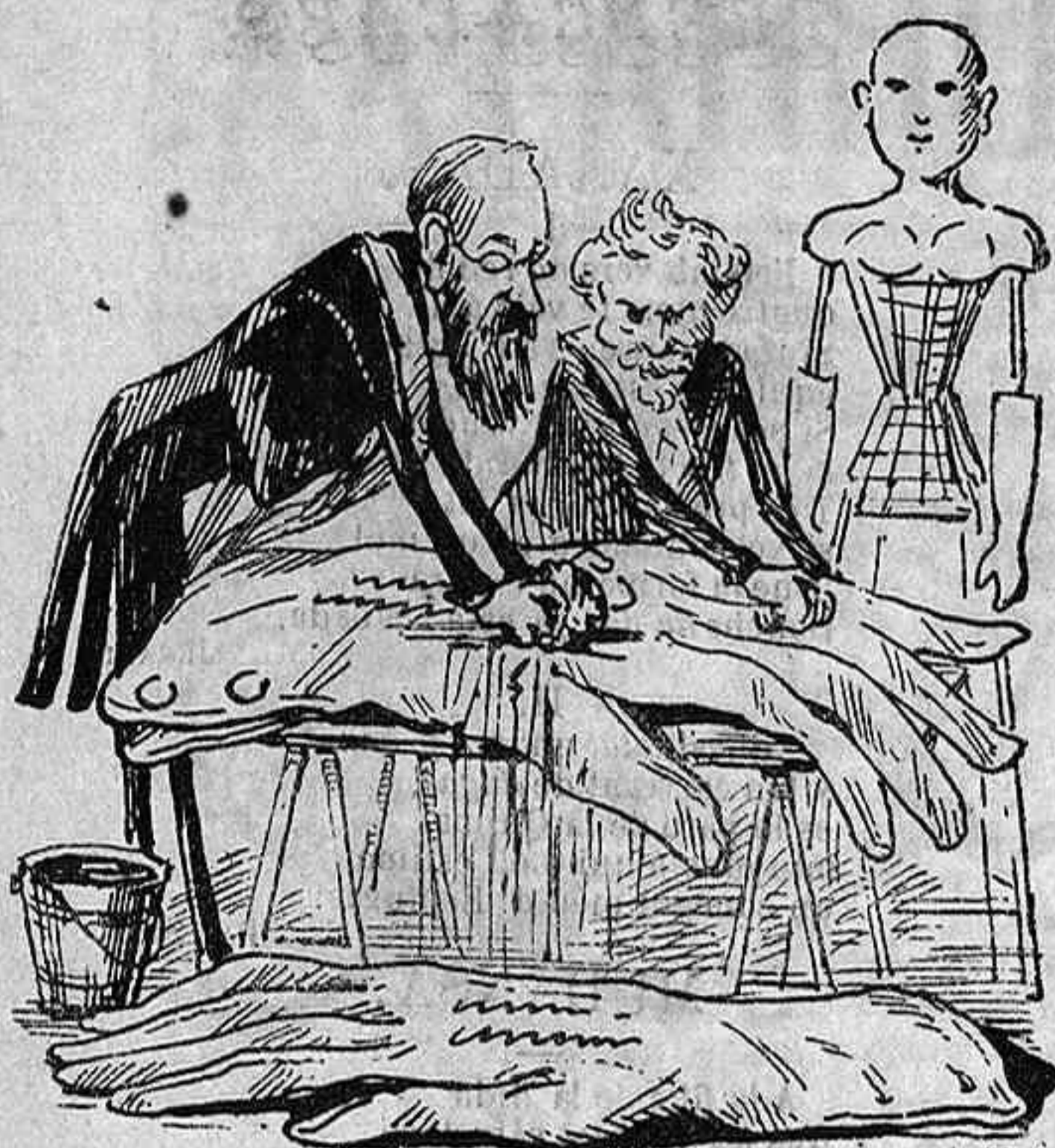
Totas las cosas fossen tant fàcils de rentar, com los guants de la geganta.