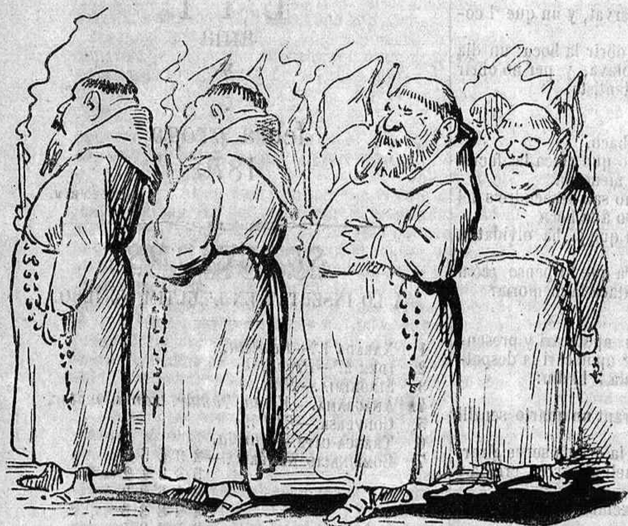
¡Si portarán segons fins anant a la professò!... Jo crech que apesar d' aixó la professò vá per dins.