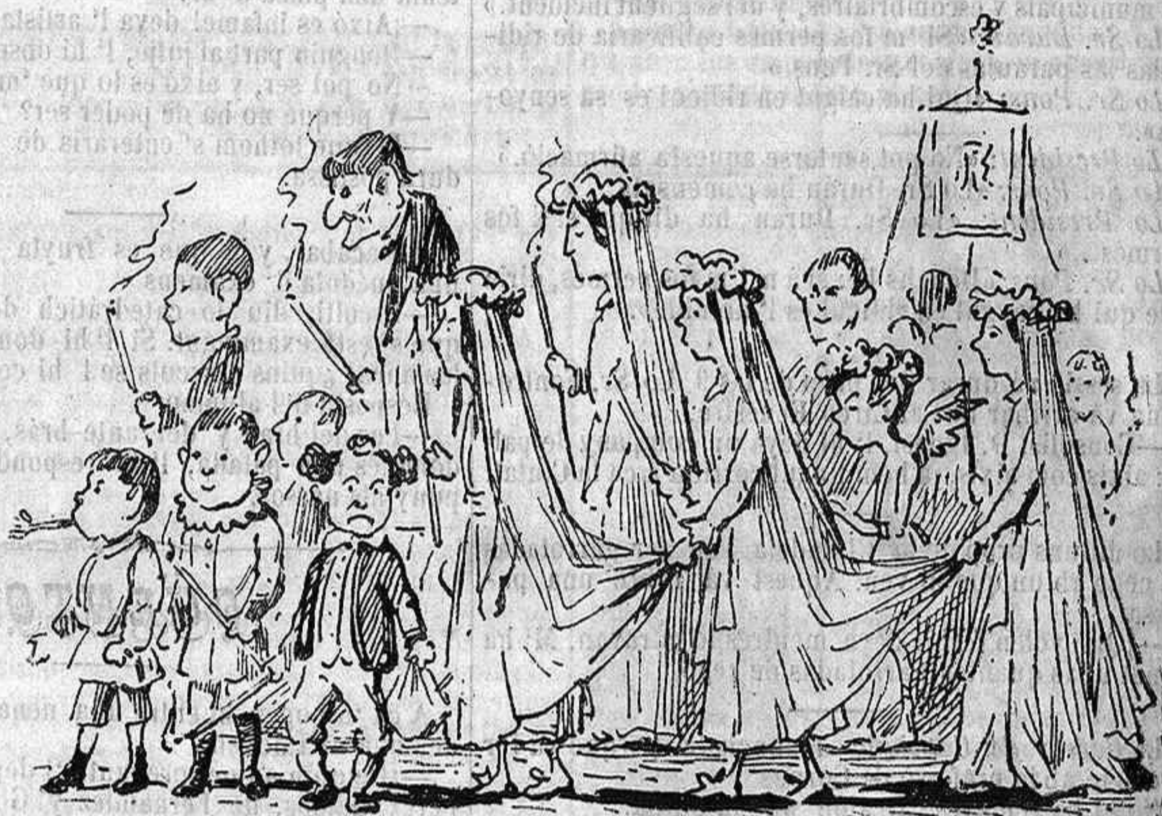
Molta canalla y hasta 'l tio fresco.