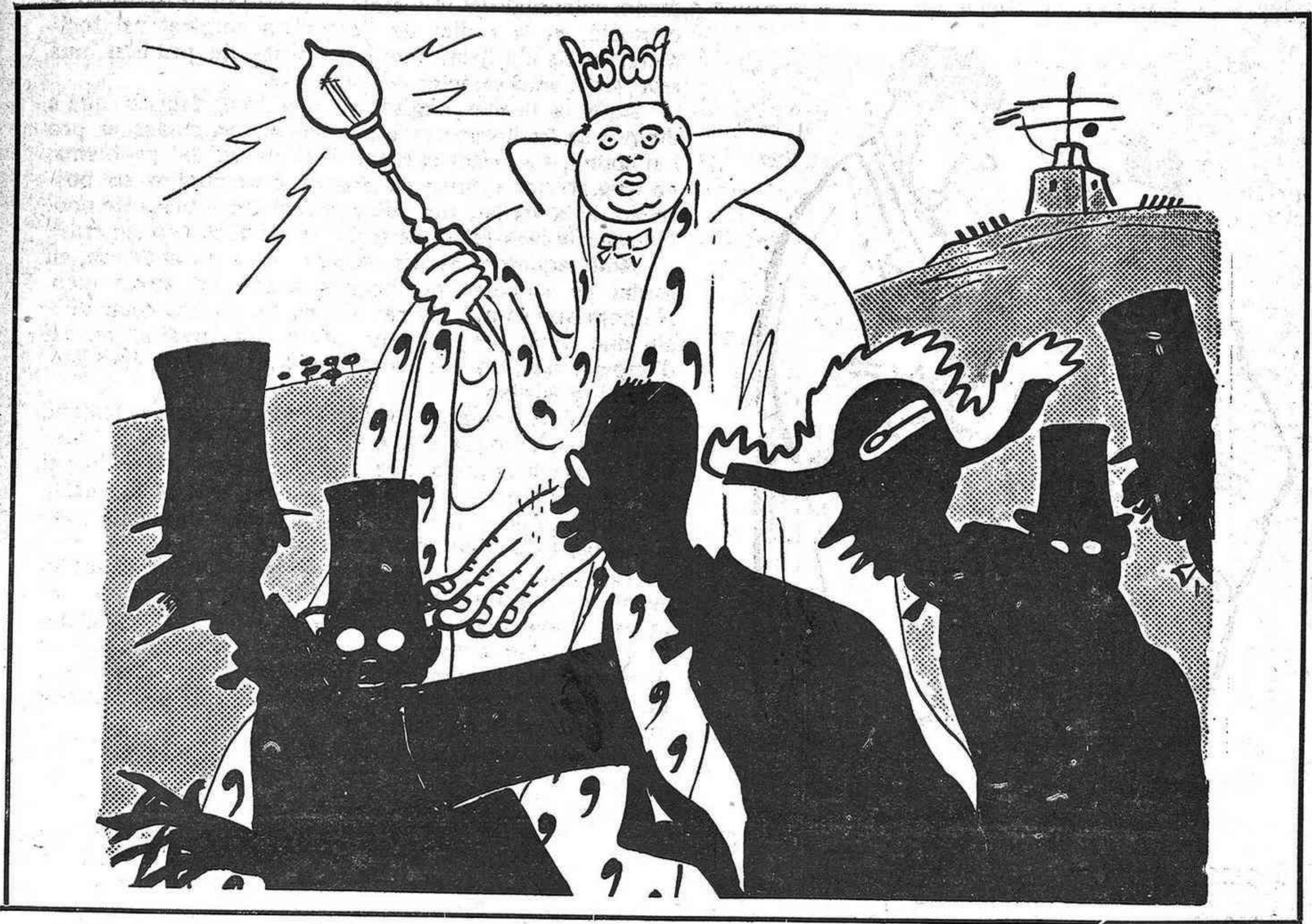
EL REI DE MONTJUIC PRESIDINT EL «BESAMANS».

—Vagin passant, vagin passant, no s'entretinguin.