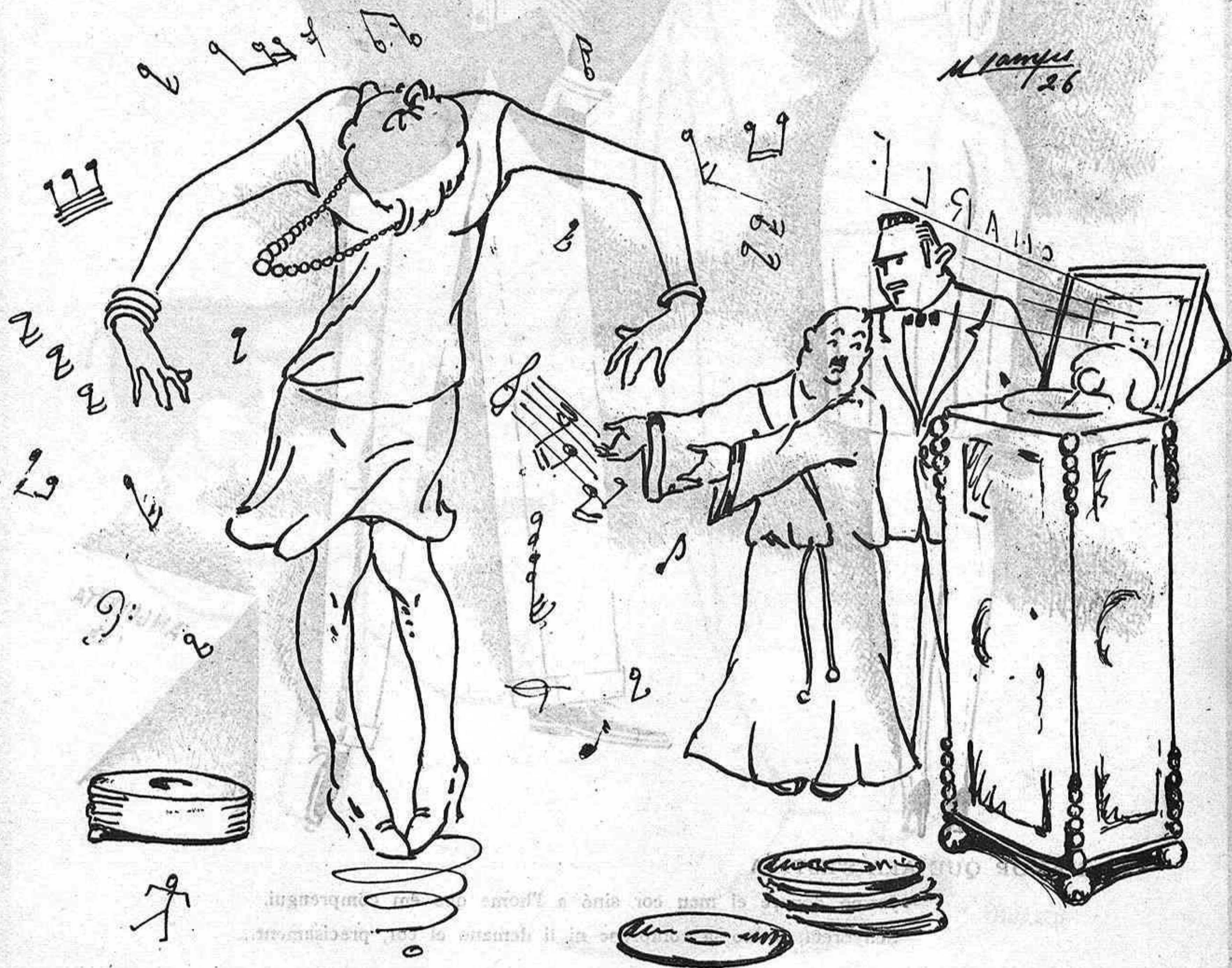
LA VIDA MODERNA

Altre artista no gaire conegut, però ple de simpatia també per les obres que exposa, és en Zaragoza-Navas, el qual ens presenta, figures, paisatges i interiors ben estudiats, sobresortint d'una manera notable en el