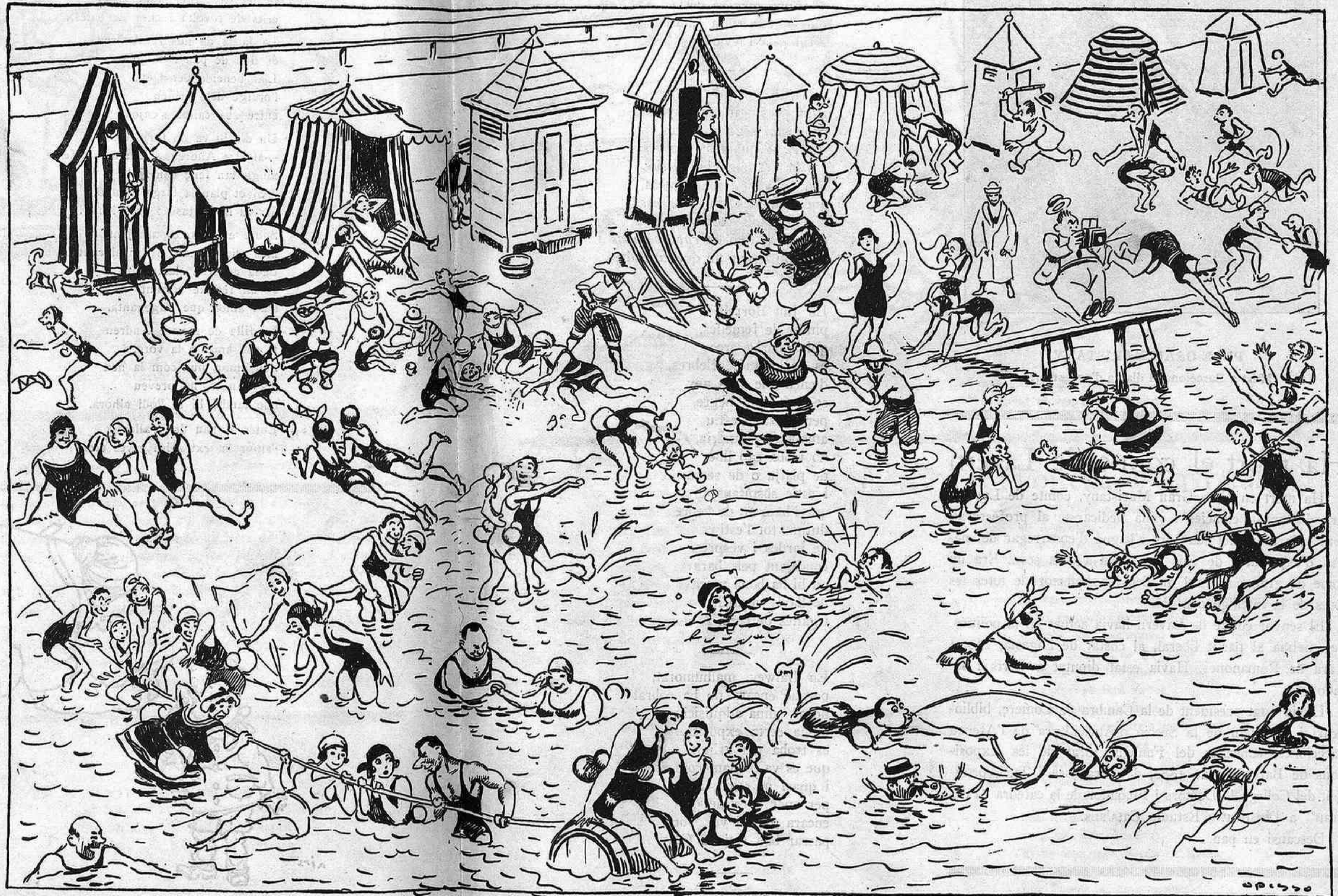
VARIETATS DE LA COSTA

No és digne de tota lloança, això? Al món han existit poques persones tan humanitàries com aquests nou senyors bandolers. A l'elogi universal de les persones honrades, nosaltres hi afegim la nostra felicitació.