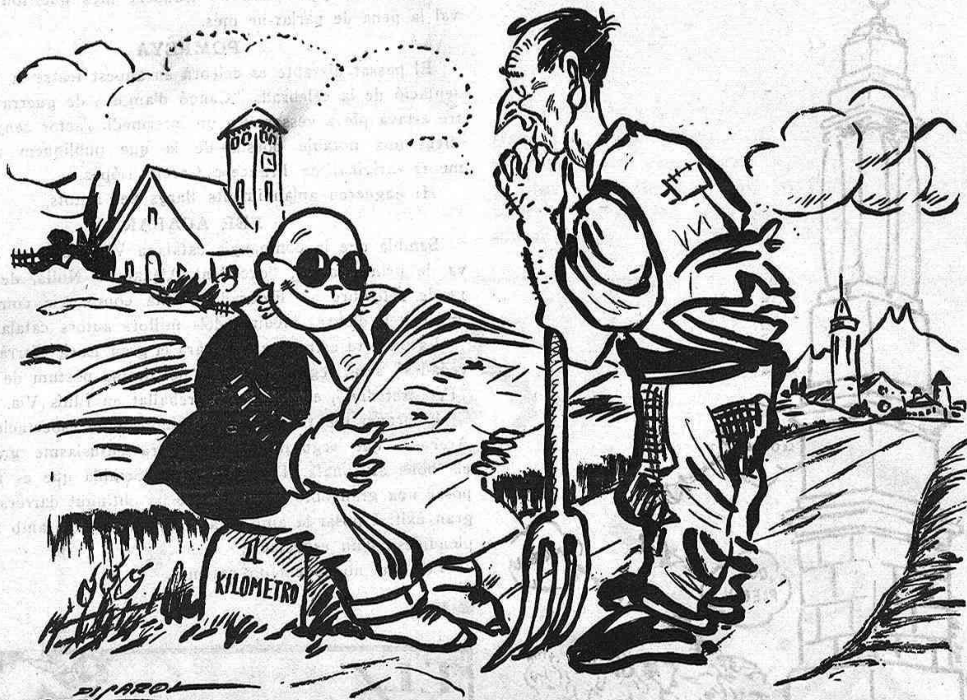
ELS NOSTRES FINANCIERS

—I què em diu del franc? —Que aviat el veurem de franc.