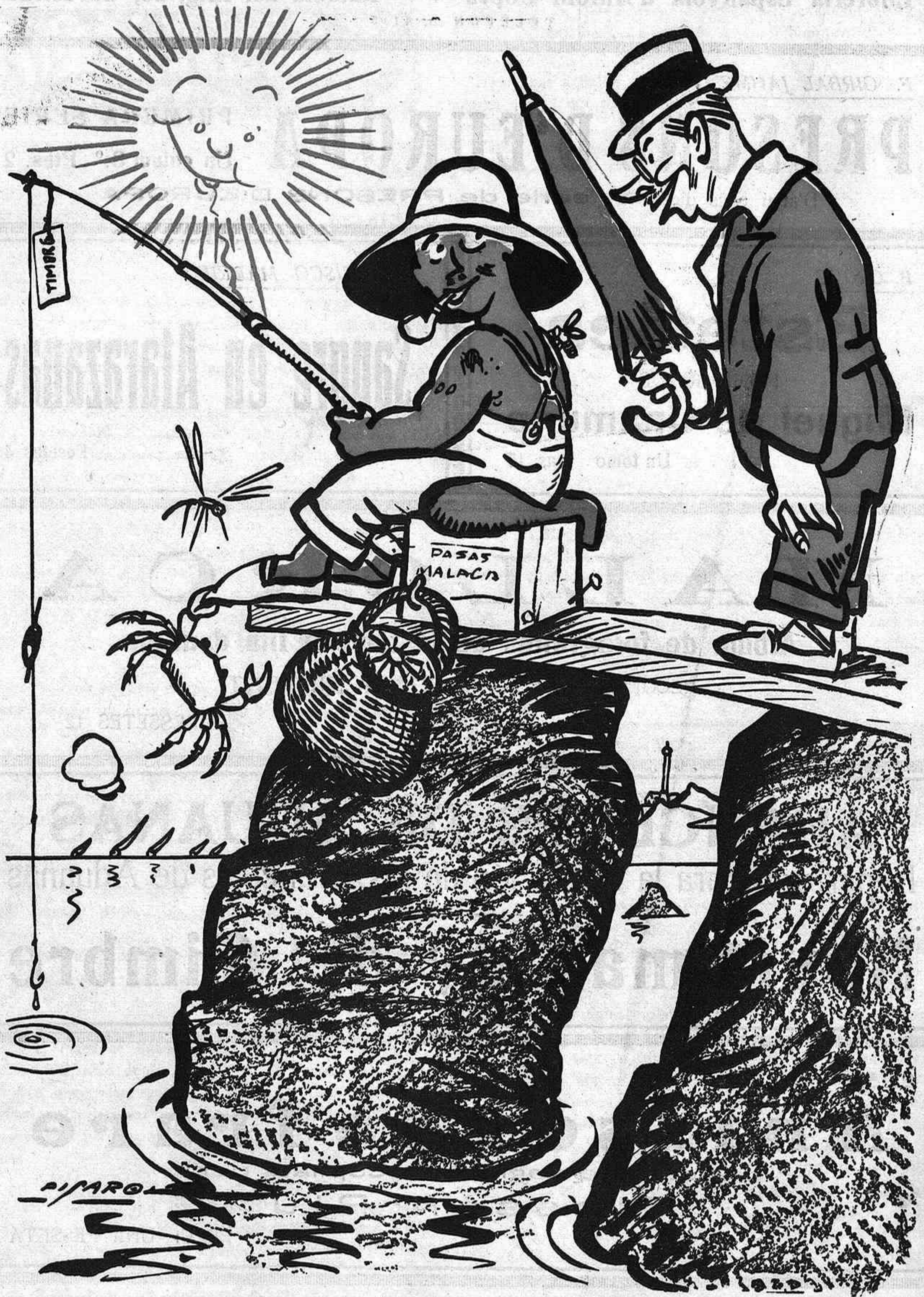
ELS PESCADORS DE CANYA

—Que no piquen? —Ja ho crec! Pica tot en aquest temps!