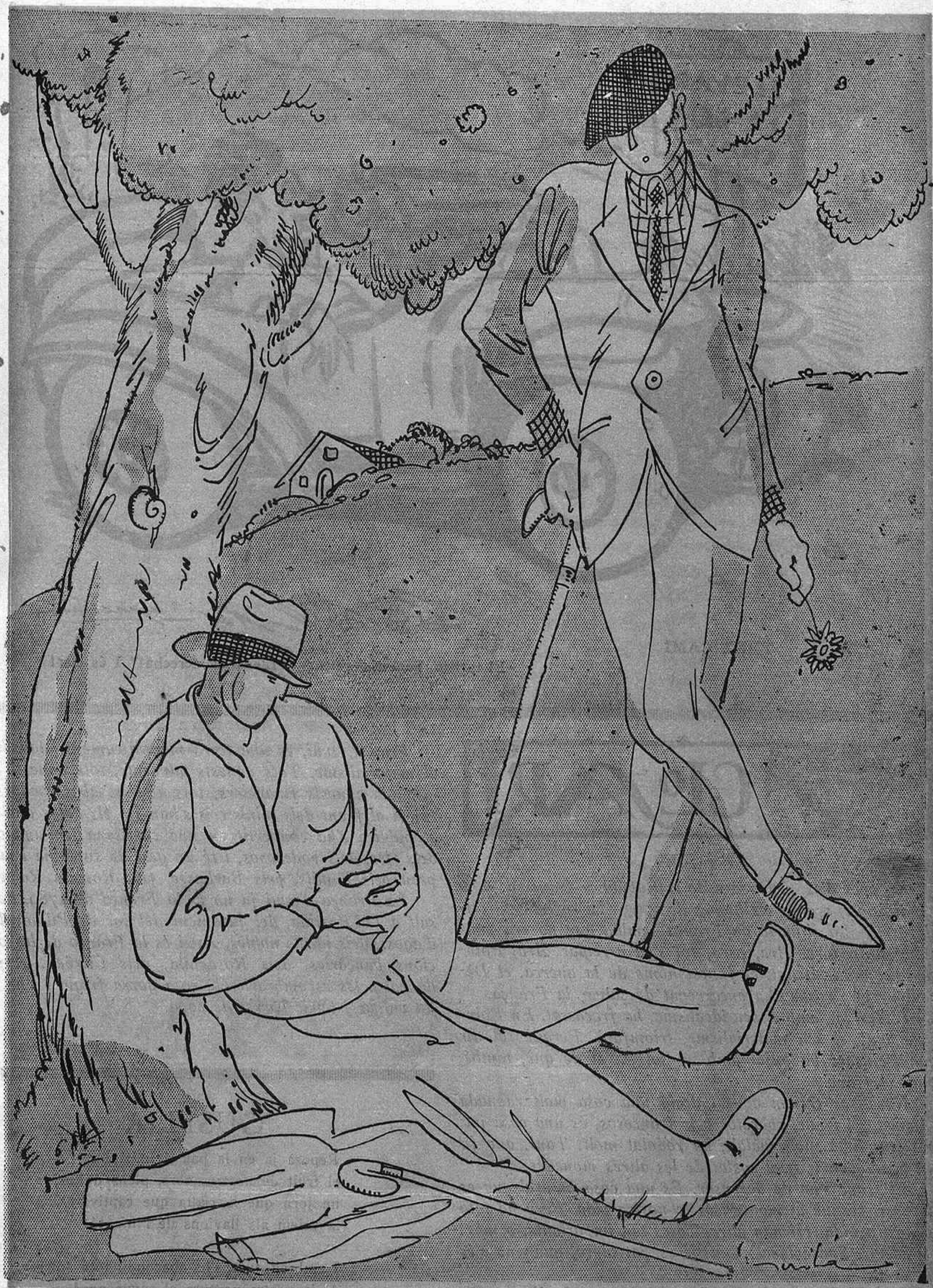
ELS PLERS DE LA NATURALESA

—No et canses de fer el gandul? —Si, per això descanso.