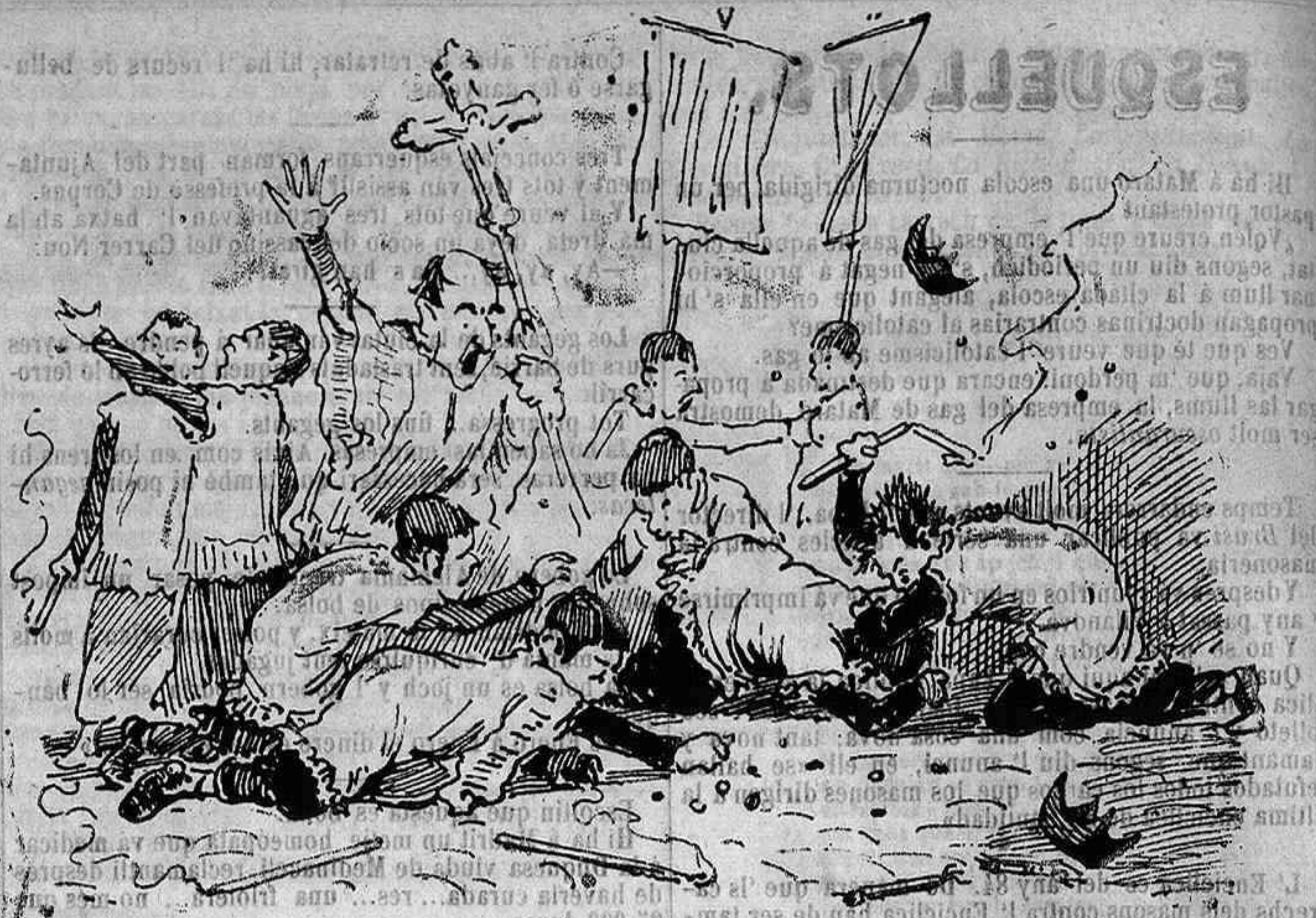
Devoció á l' aranya-estira-cabells.