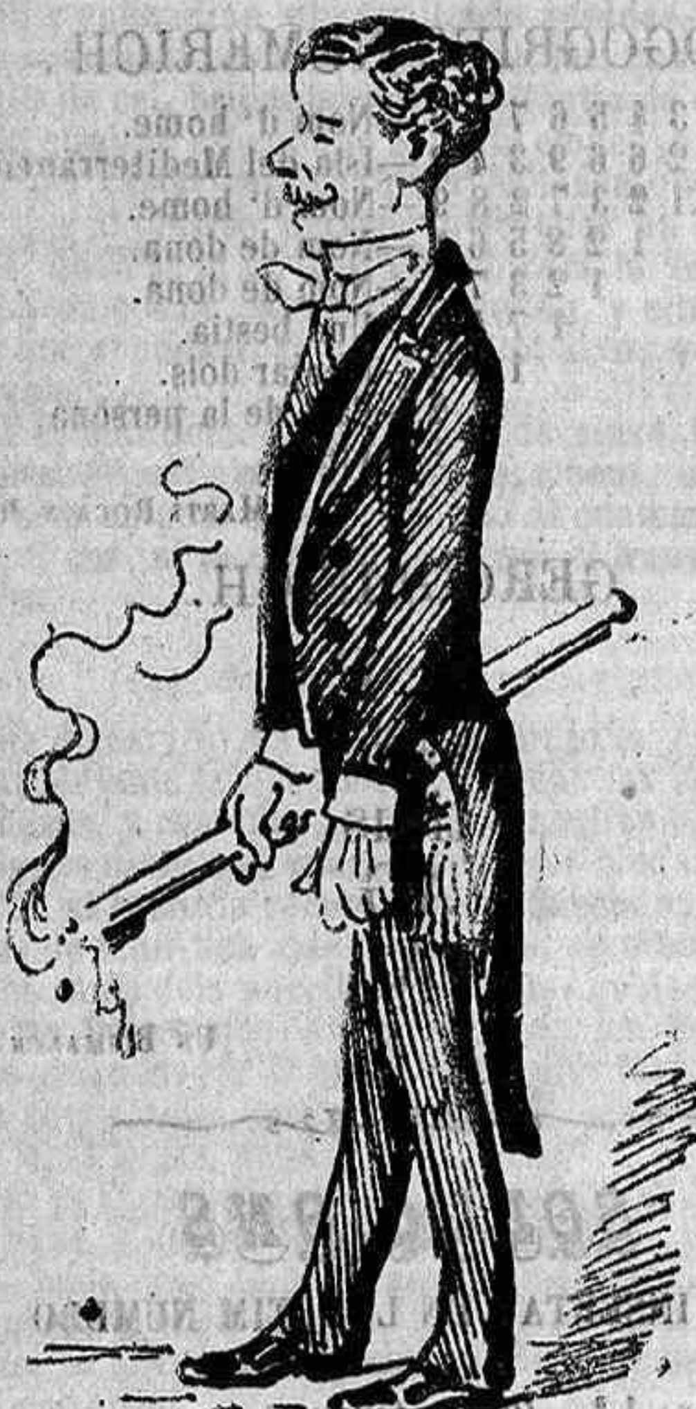
Un de la colla de la banda amagada.