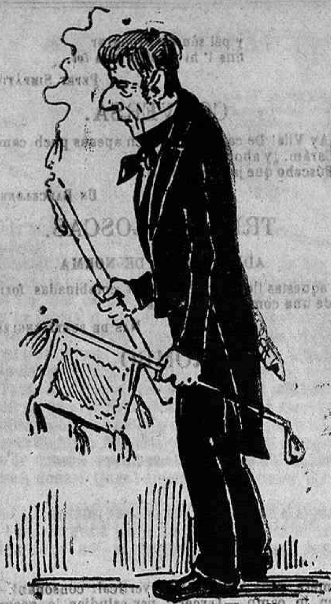
Un abonat desde l' any 20.