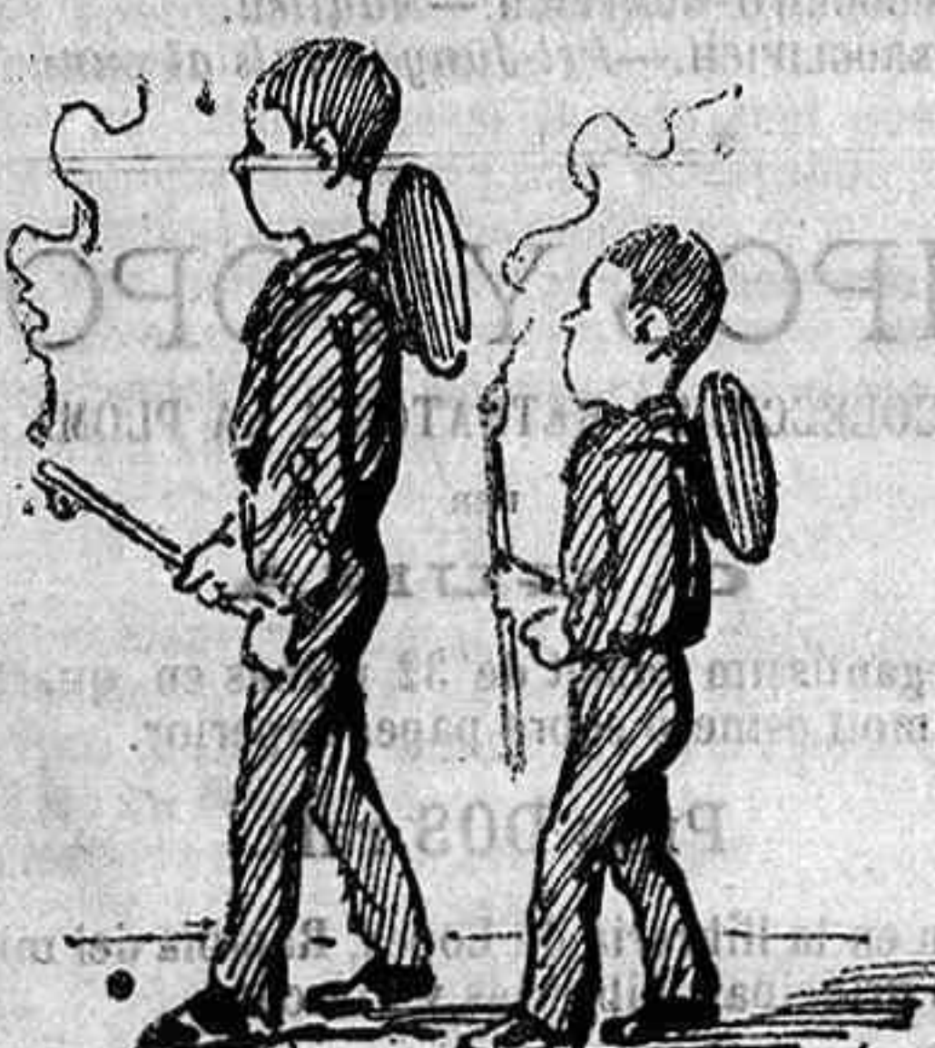
Los noys del Centro professional.