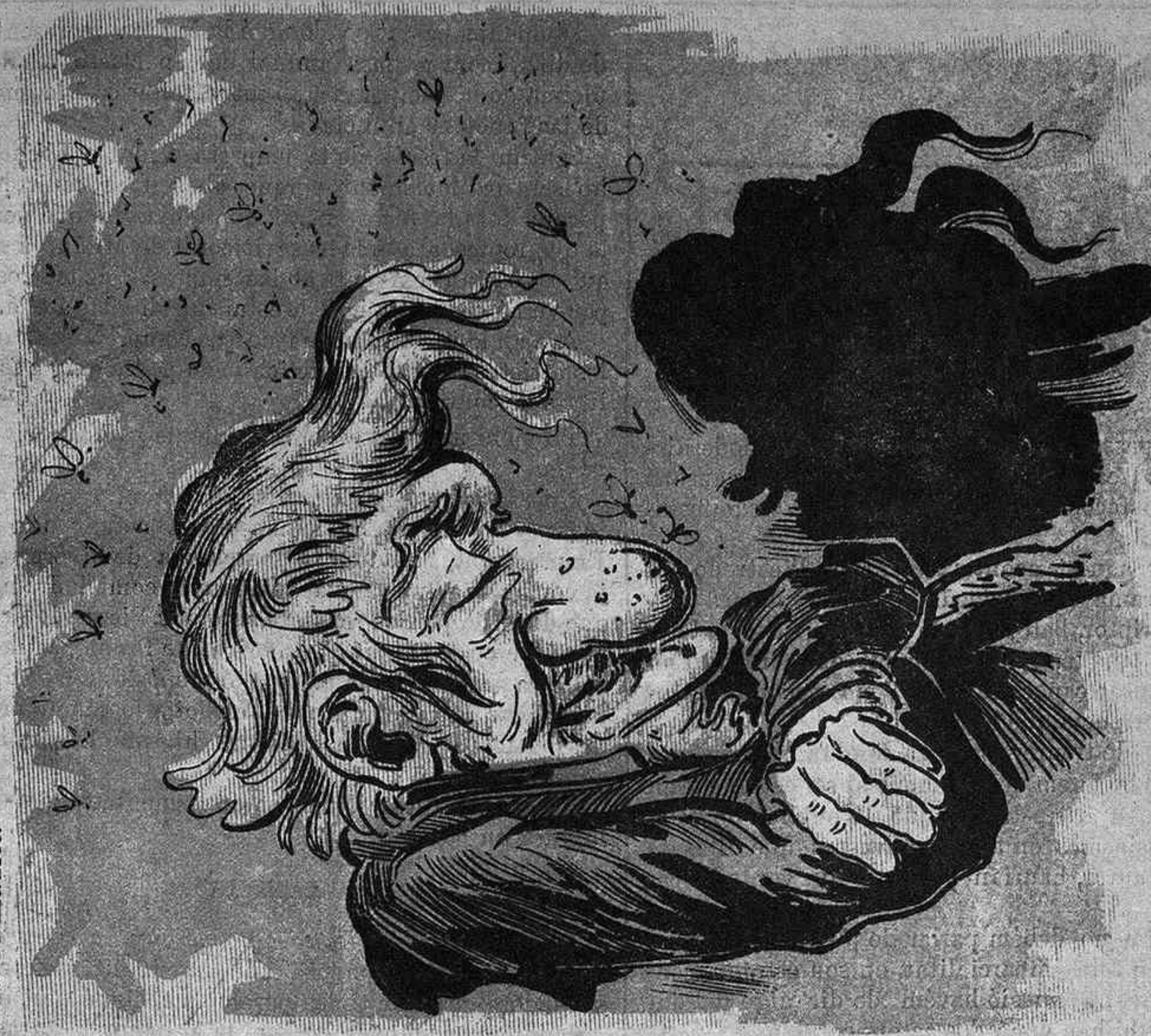
Y en tant que d' aquesta patria l' horitzó se 'ns vá enfosquint, voltat per aixams de moscas el jayo segueix dormint.