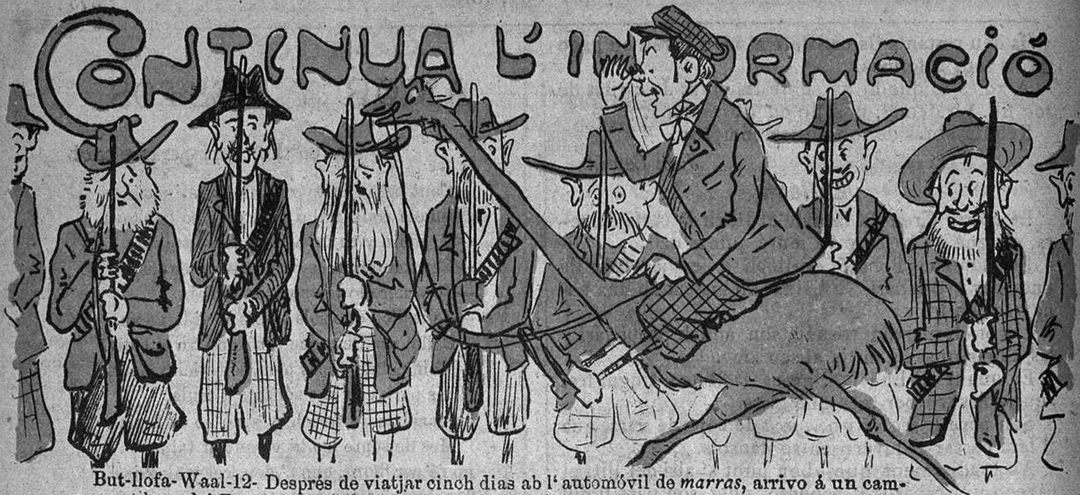
But-llofa-Waal-12- Després de viatjar cinch dias ab l'automòvil de marras, arribo á un campament boer del Transvaal. Els burghers 'm reben ab honors militars com pertoca á un enviat de LA TOMASA.