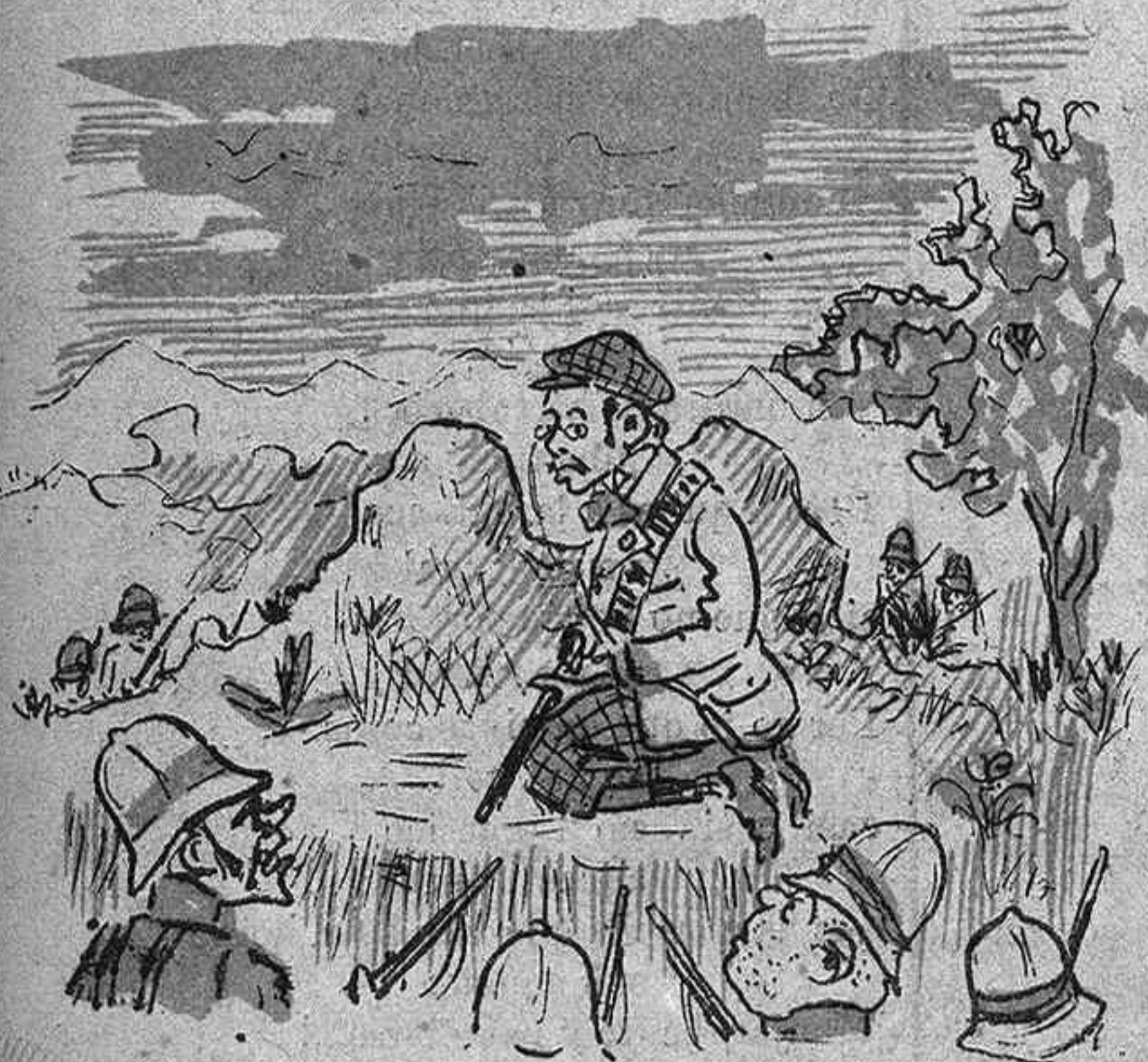
Tururut-Koop-14. Allistat en un commando caich heróicament. 'M sembla que no ho contaré. Avisin á la mare.