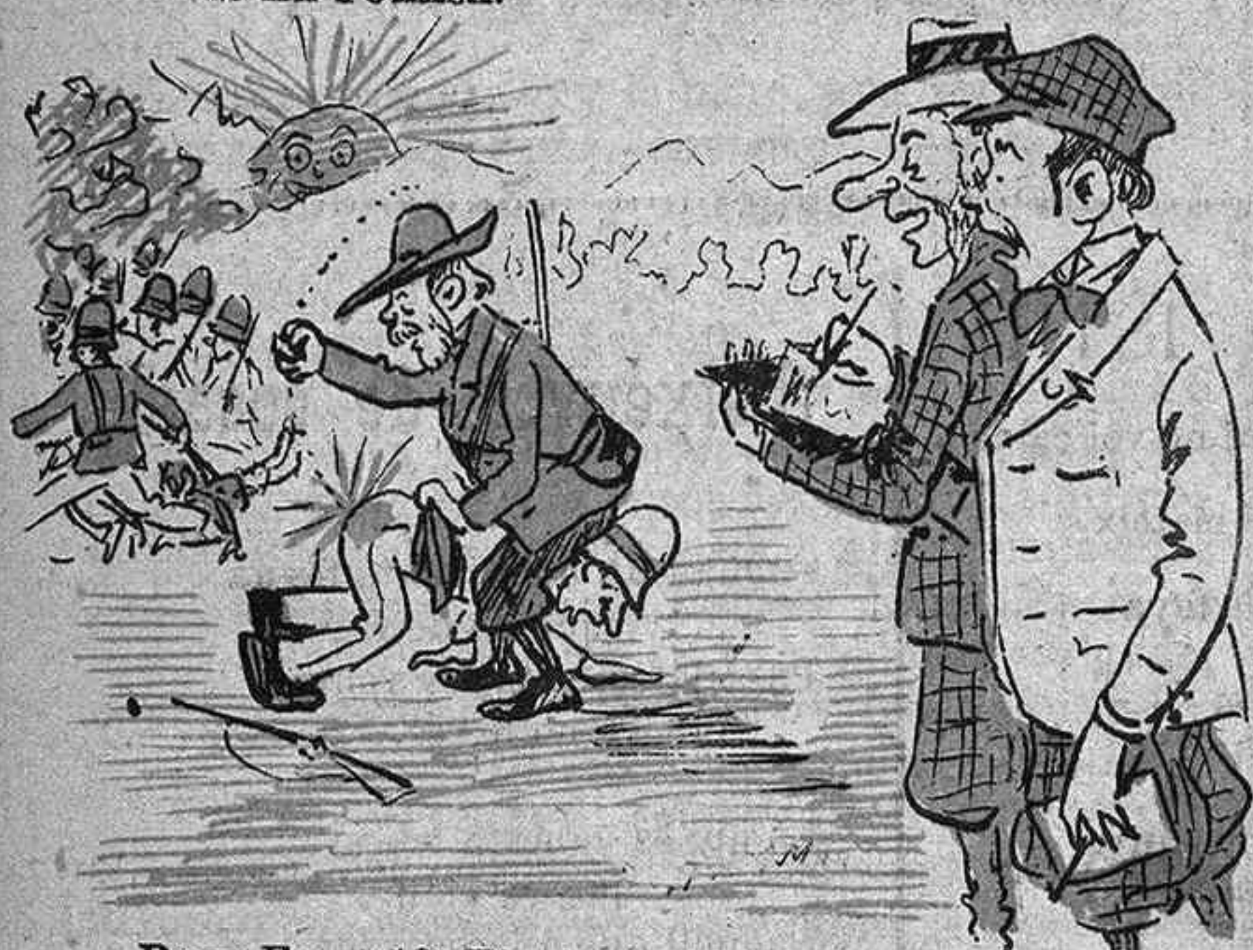
Pega-Foort-13. Tinch ocasió d'assistir á un combat, ahont queda demostrada la superioritat inglesa. En aquest sentit, un corresponsal del Times, tima al seu periódich.