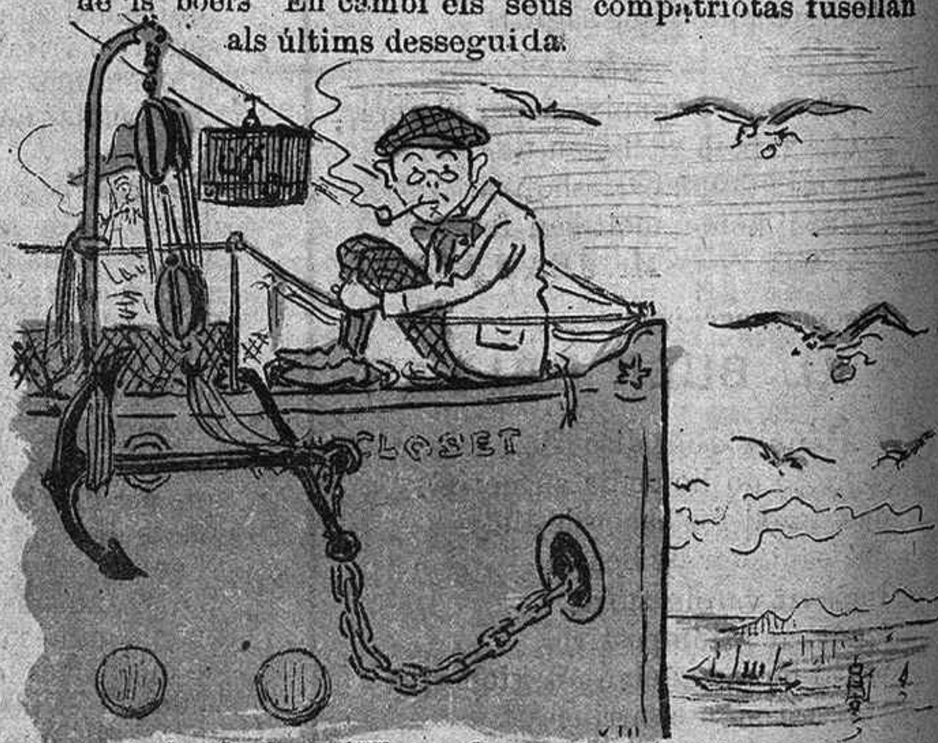
A bordo de l'"Water-Closet" -14 1ª2. Els inglesos 'm condemnan á ser deportat. Surto cap á Santa Elena. Llestos! Ja no telegrafiaré mes. Al menos Santa Elena 'm fés tants bons tractes com una Elena que jo coneixia y no era santa.