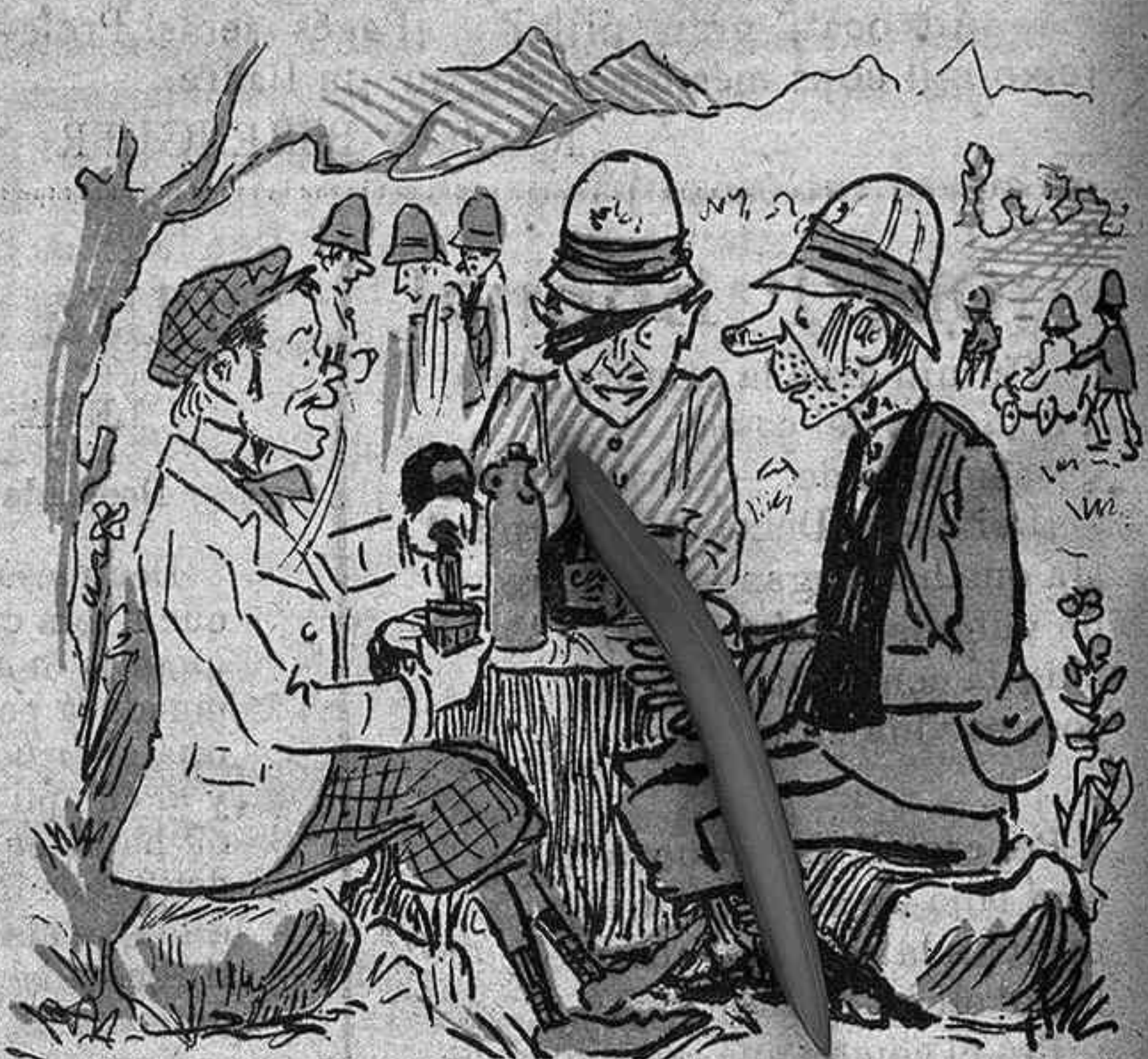
Camelo-land-14 Tinch una interwiev ab dos presoners inglesos. Es la 124ª vegada que cahuen en mans de ls boers. En cambi els seus compatriotas fusellan als últims desseguida.