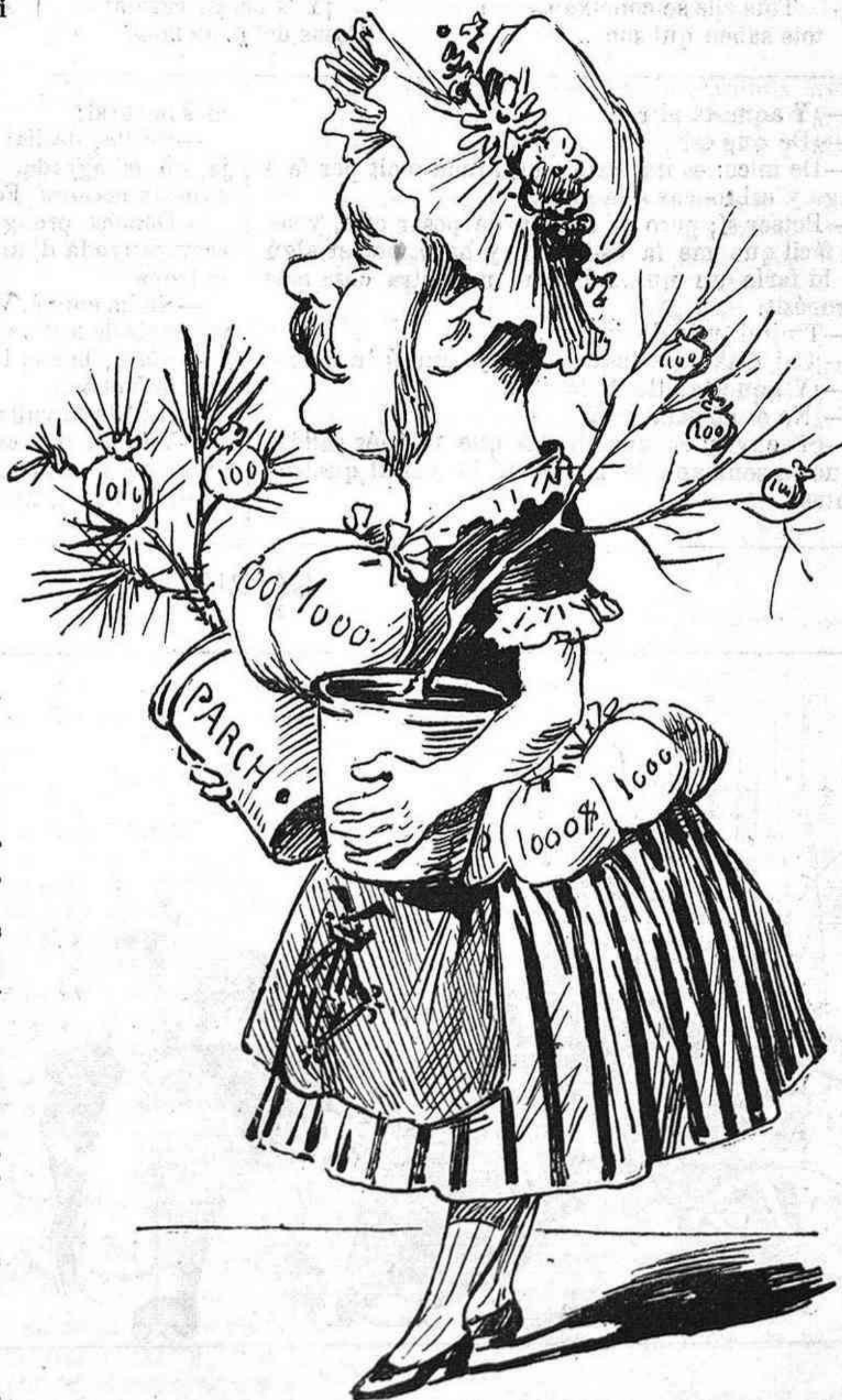
La Jardinera municipal (Traje que costa mes del que val.)