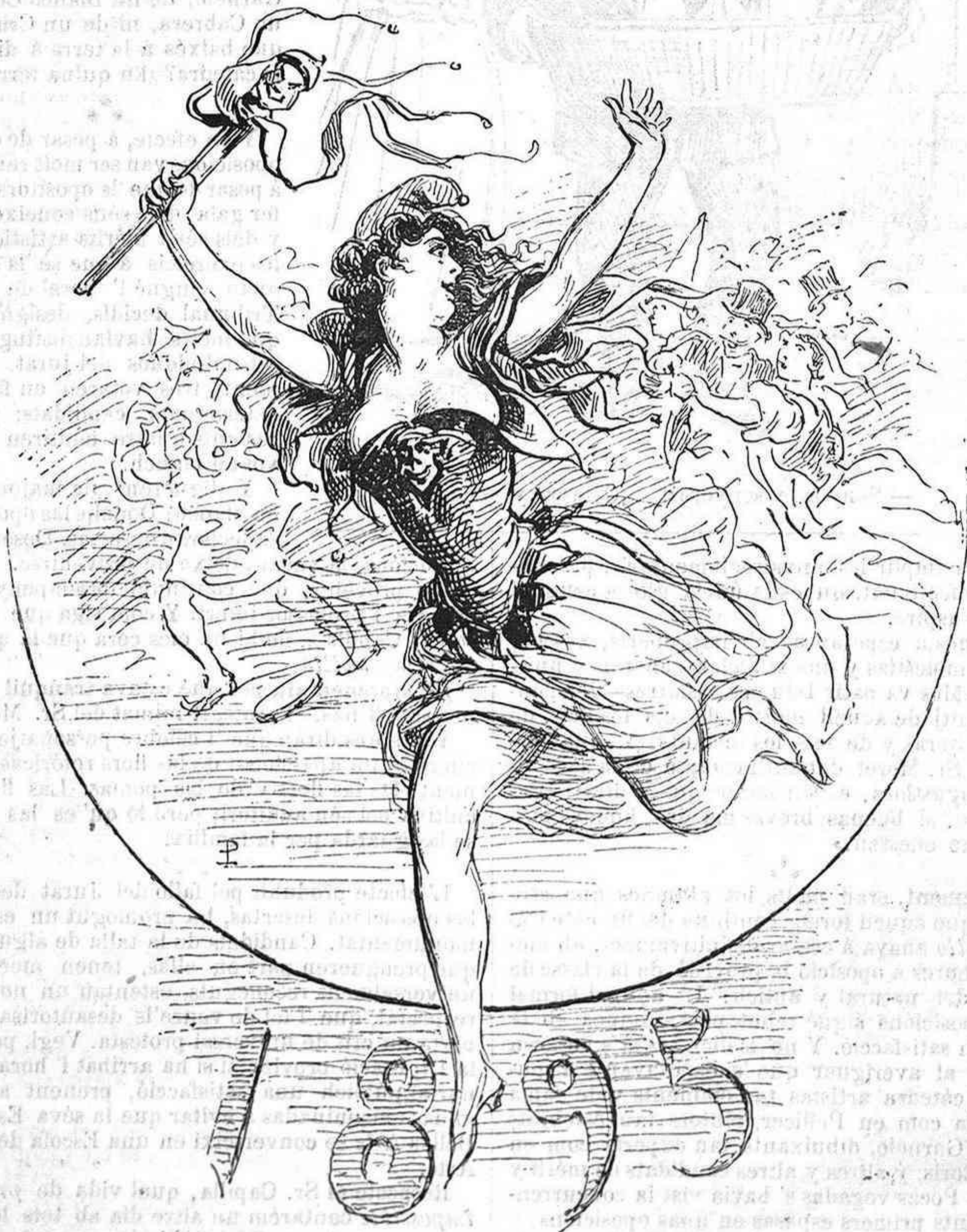
L'imatje de la alegría (Desde aquí á la bojería.)