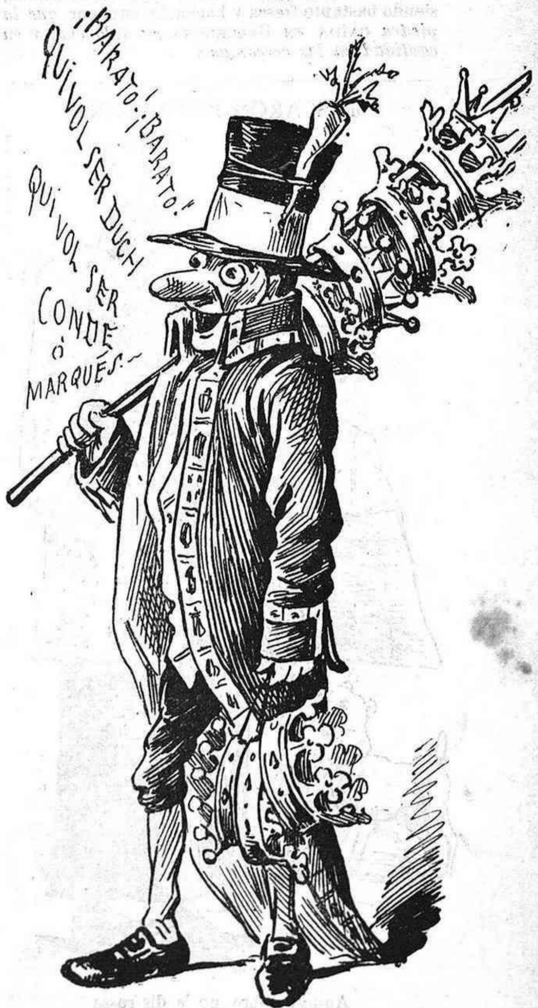
Fabricant de nobles.