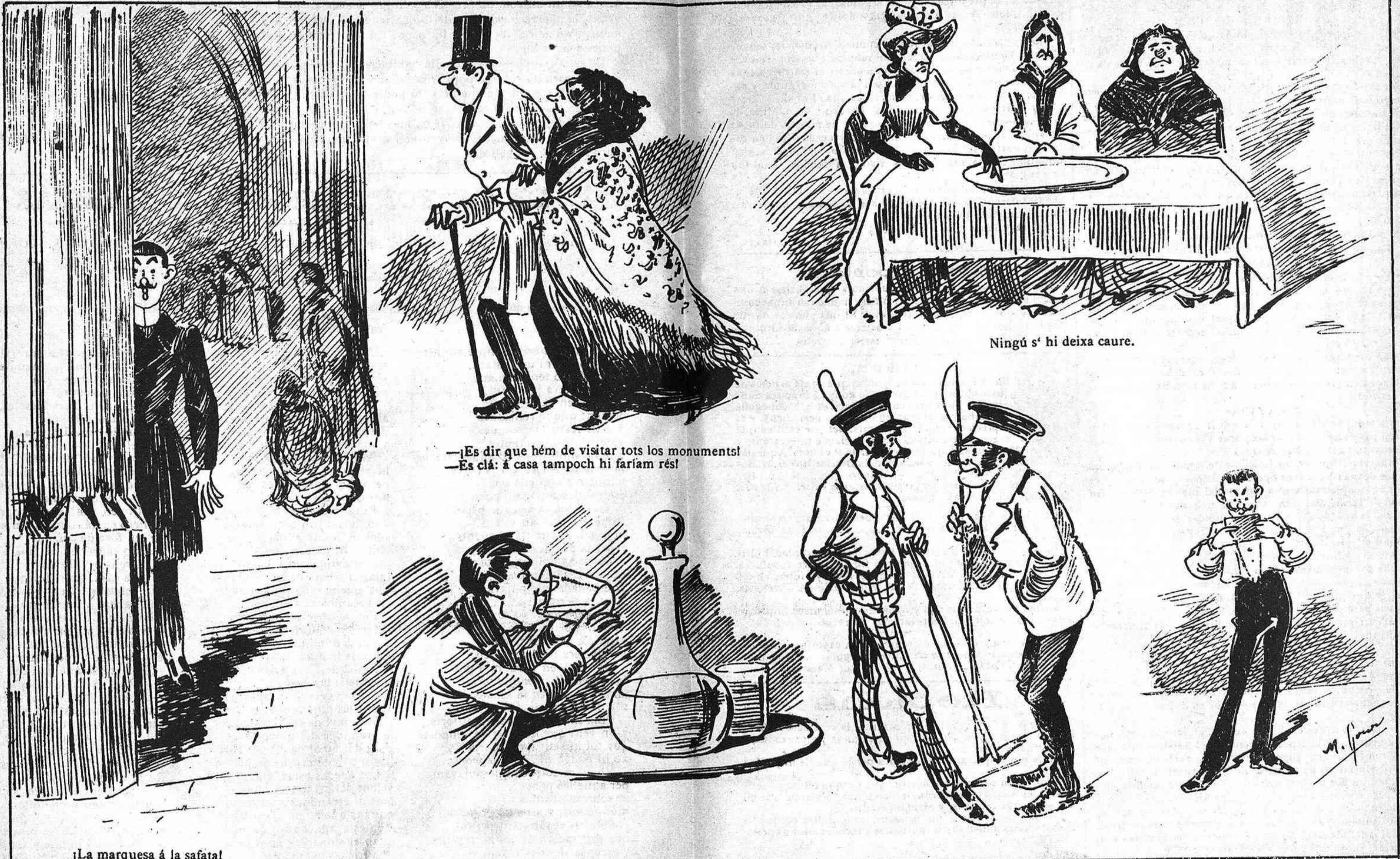
Ningú s' hi deixa caure.