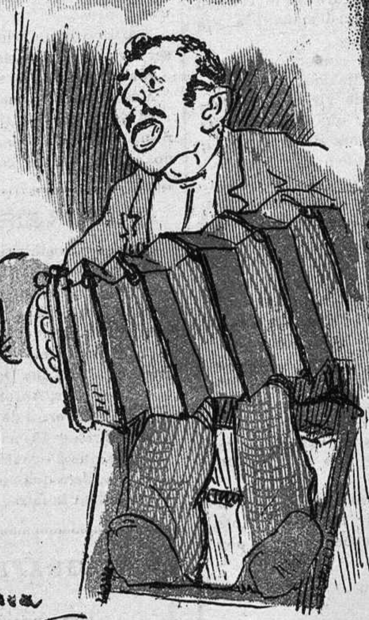
Qui tocant l' acorde3n