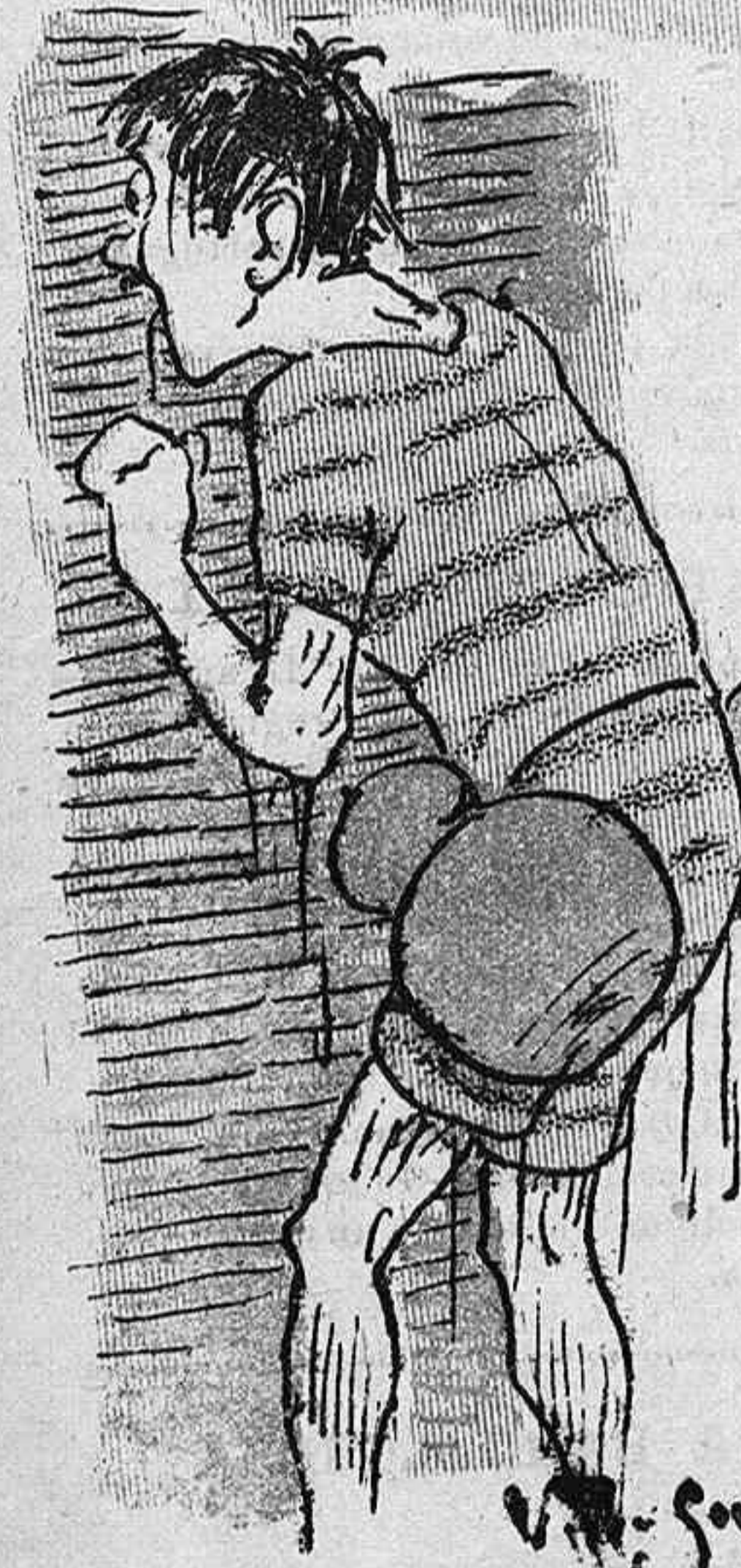
Qui als banys ab racci3ns de vista.