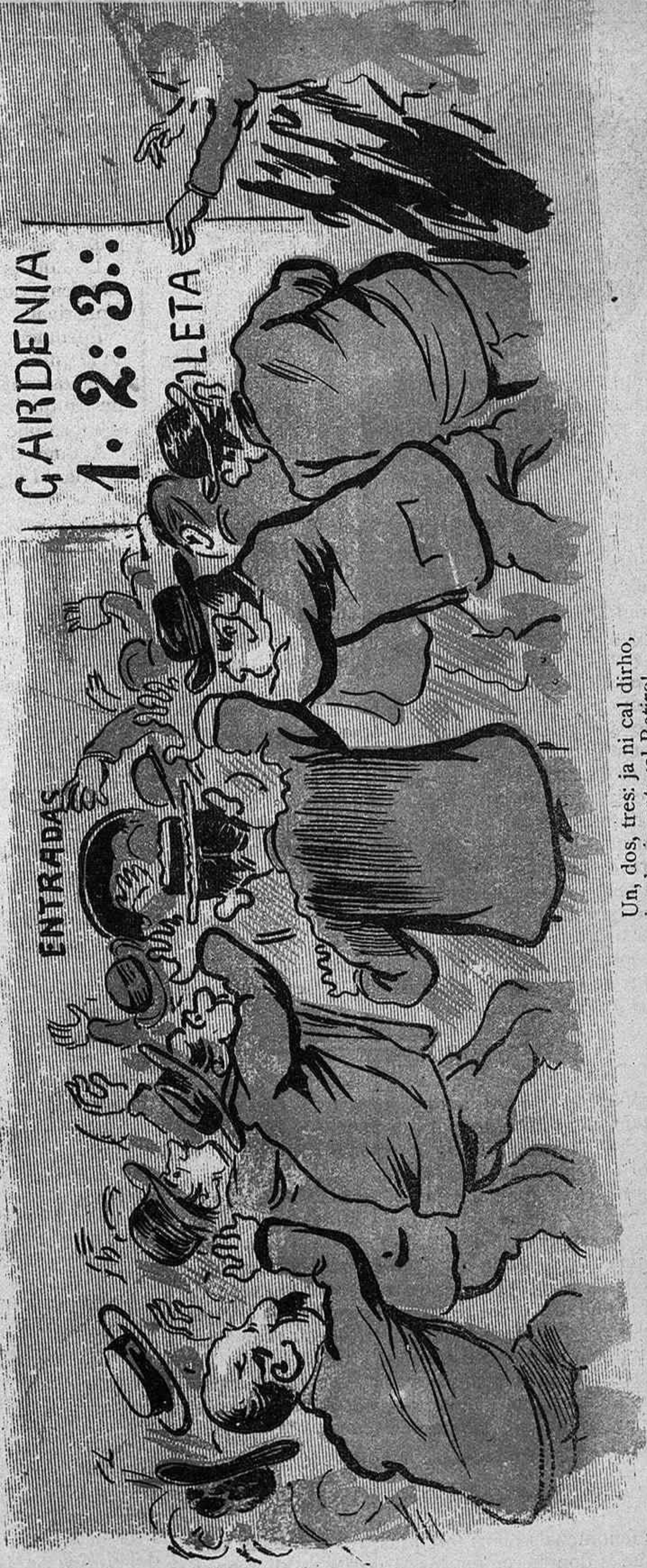
Un, dos, tres: ja ni cal dirho, qui vulgui punts ja! Retiro!