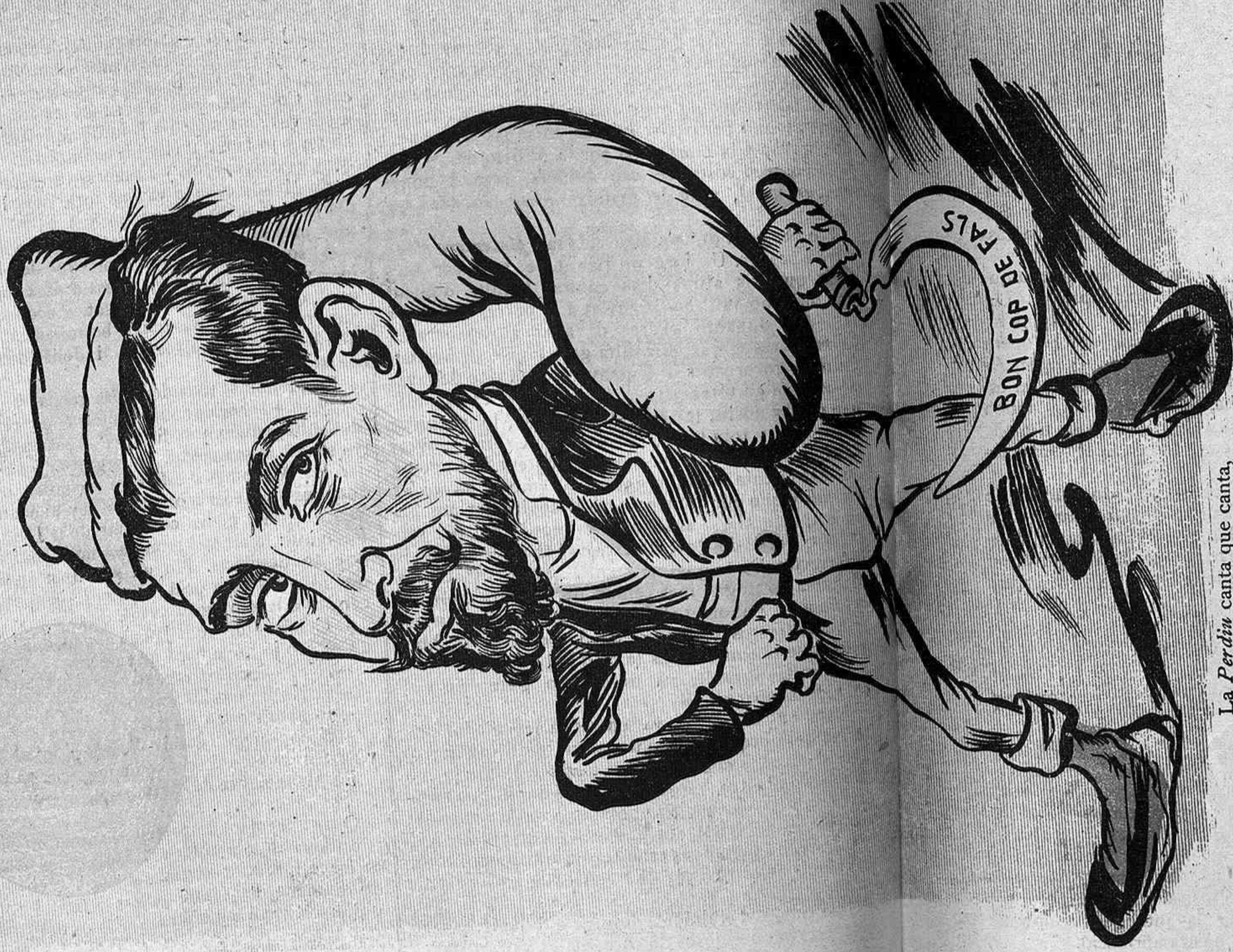
La Perdiu canta que canta, ja trinan molts regidors perque l'hi han tornat la vara al mes brau dels segadors.