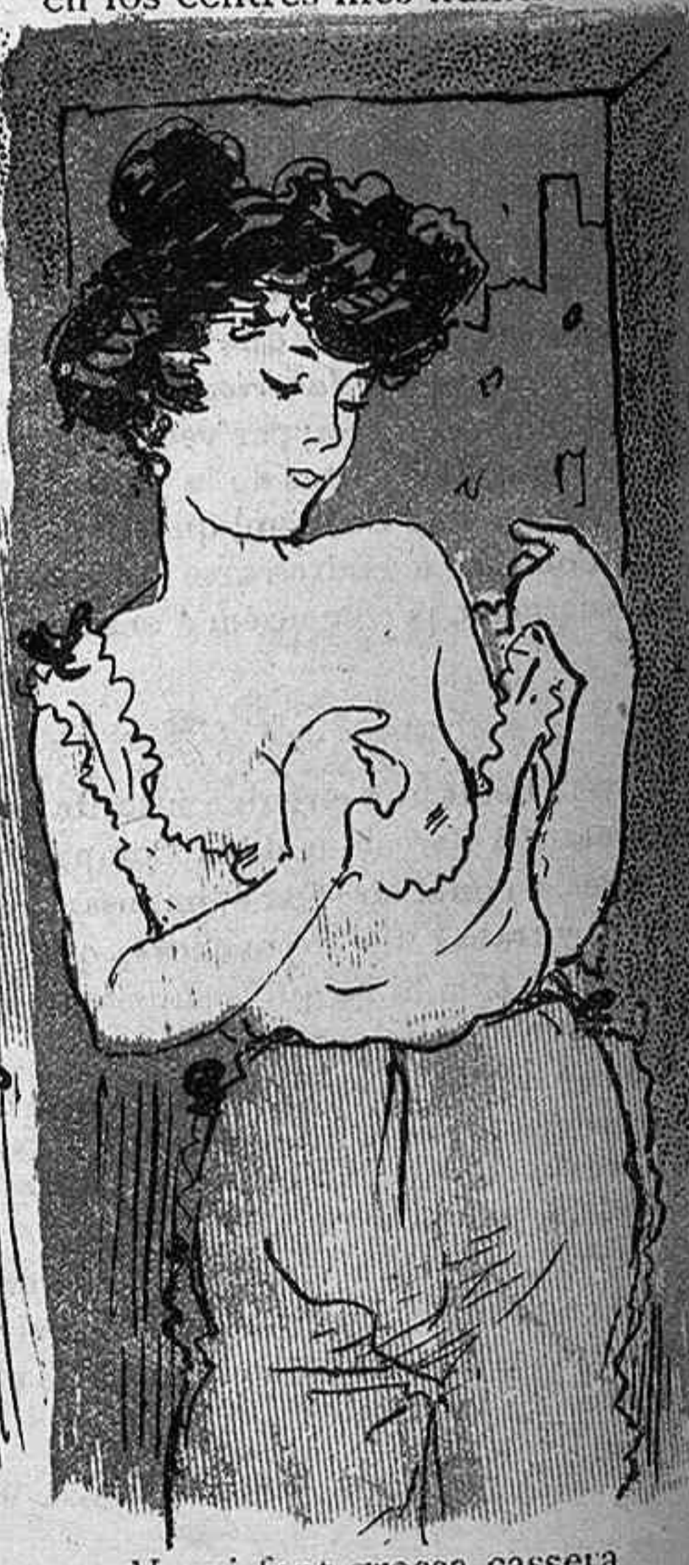
Y qui fent grossa cassera sense teme cap afront.