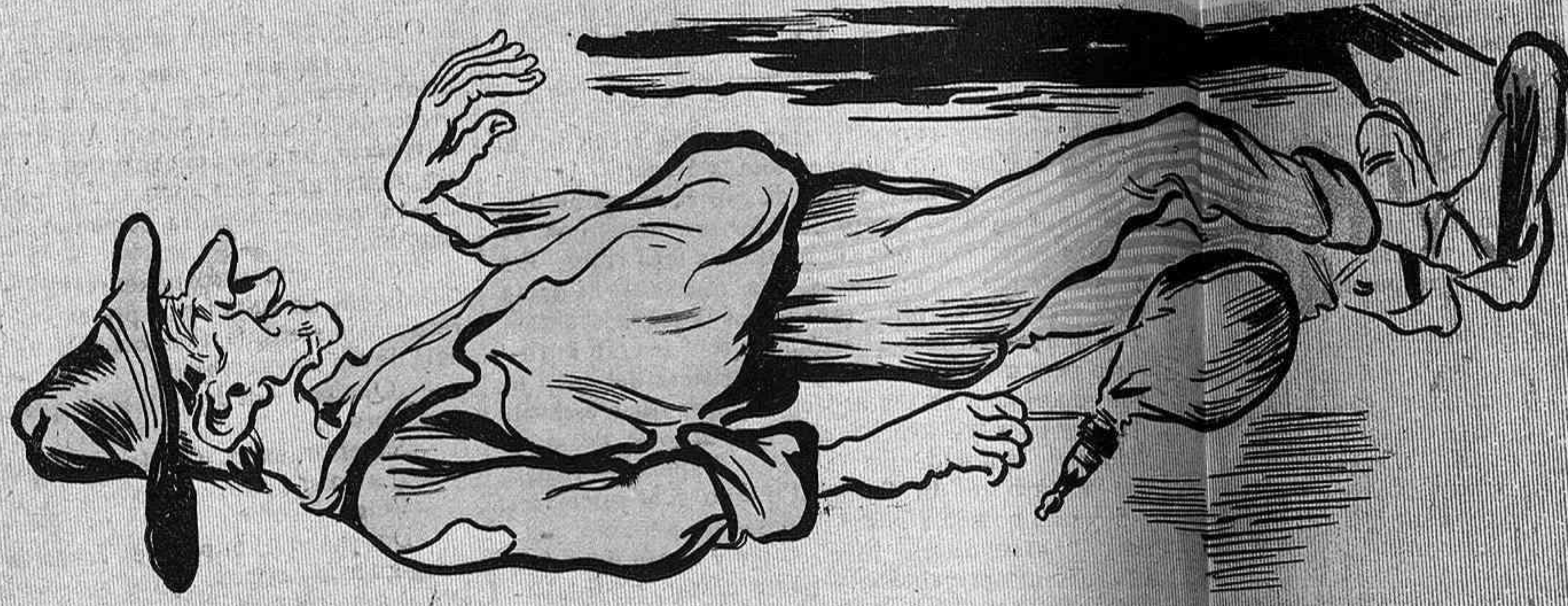
Setembre. Mes de las vinyas precursoras de las pinyas.