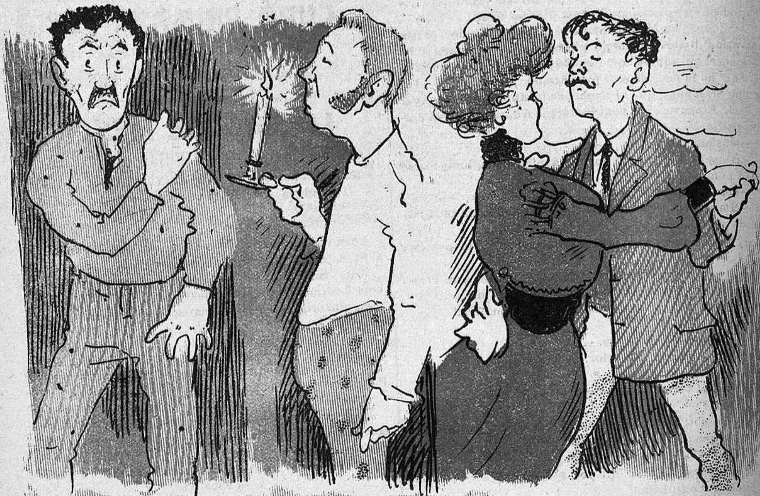
Hi ha qui 's diverteix gratant.