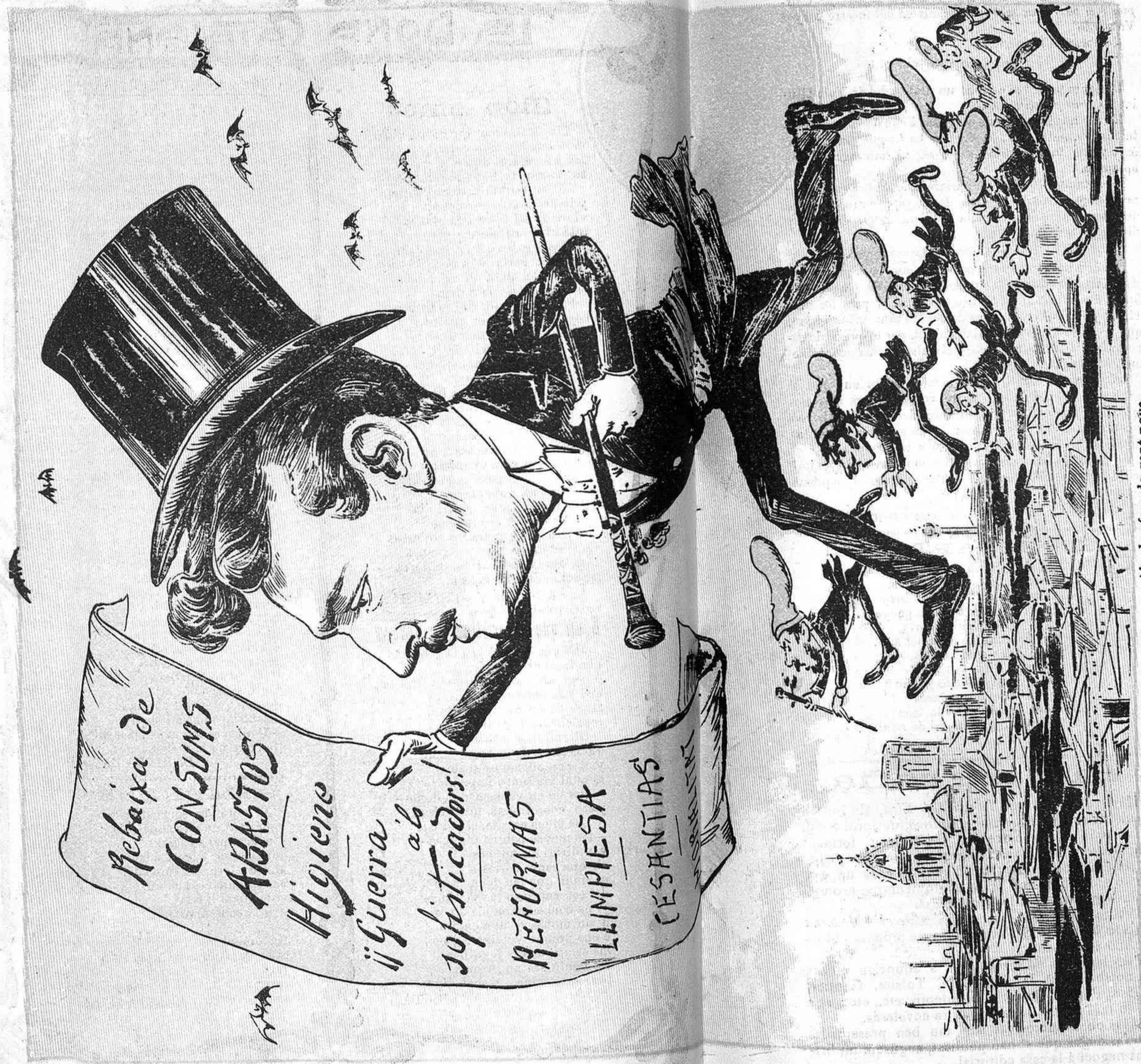
Ab el refors de gent nova molt més dalit té l' Amat per escampar las reformas pels àmbits de la Ciutat.