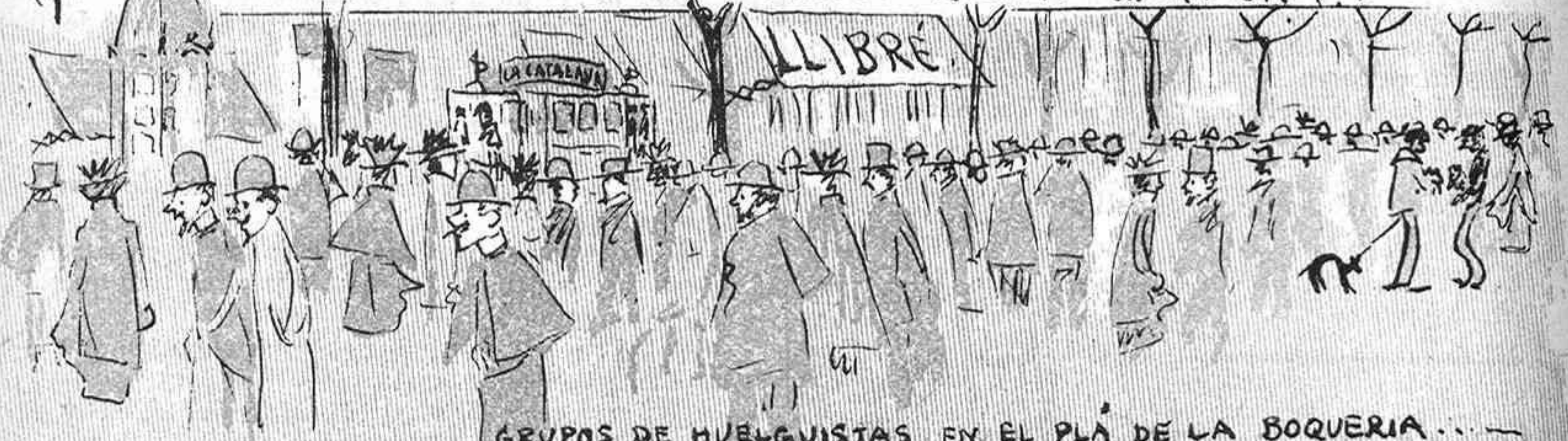
GRUPOS DE HUELGUISTAS EN EL PLA DE LA BOQUERIA.....