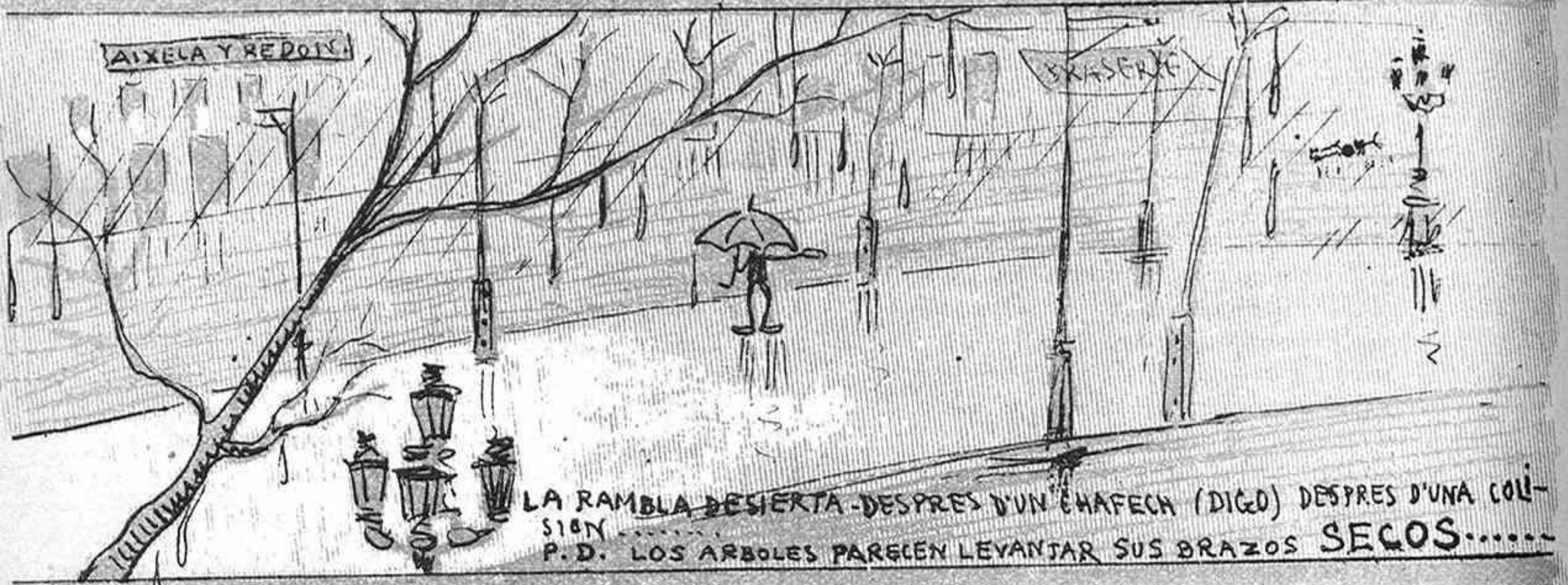
LA RAMBLA DESIERTA - DESPRES D'UN CHAFECH (DIGO) DESPRES D'UNA COL- LISION..... P.D. LOS ARBOLES PARECEN LEVANTAR SUS BRAZOS SECOS.....