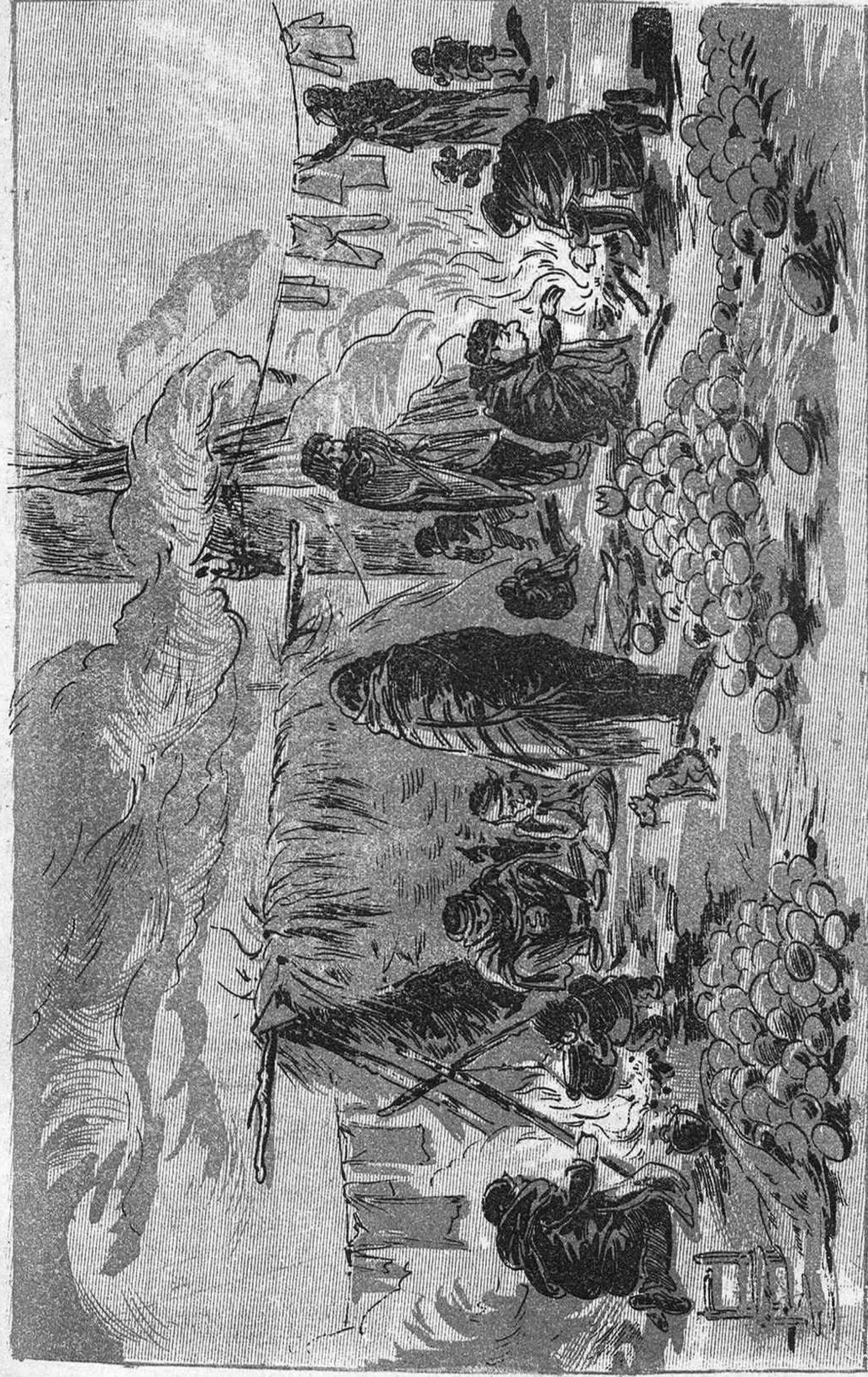
Ja las festas son passadas, no hi han firas ni turrons; ja las tribus dels aschamis no hi ensenyan els meions.