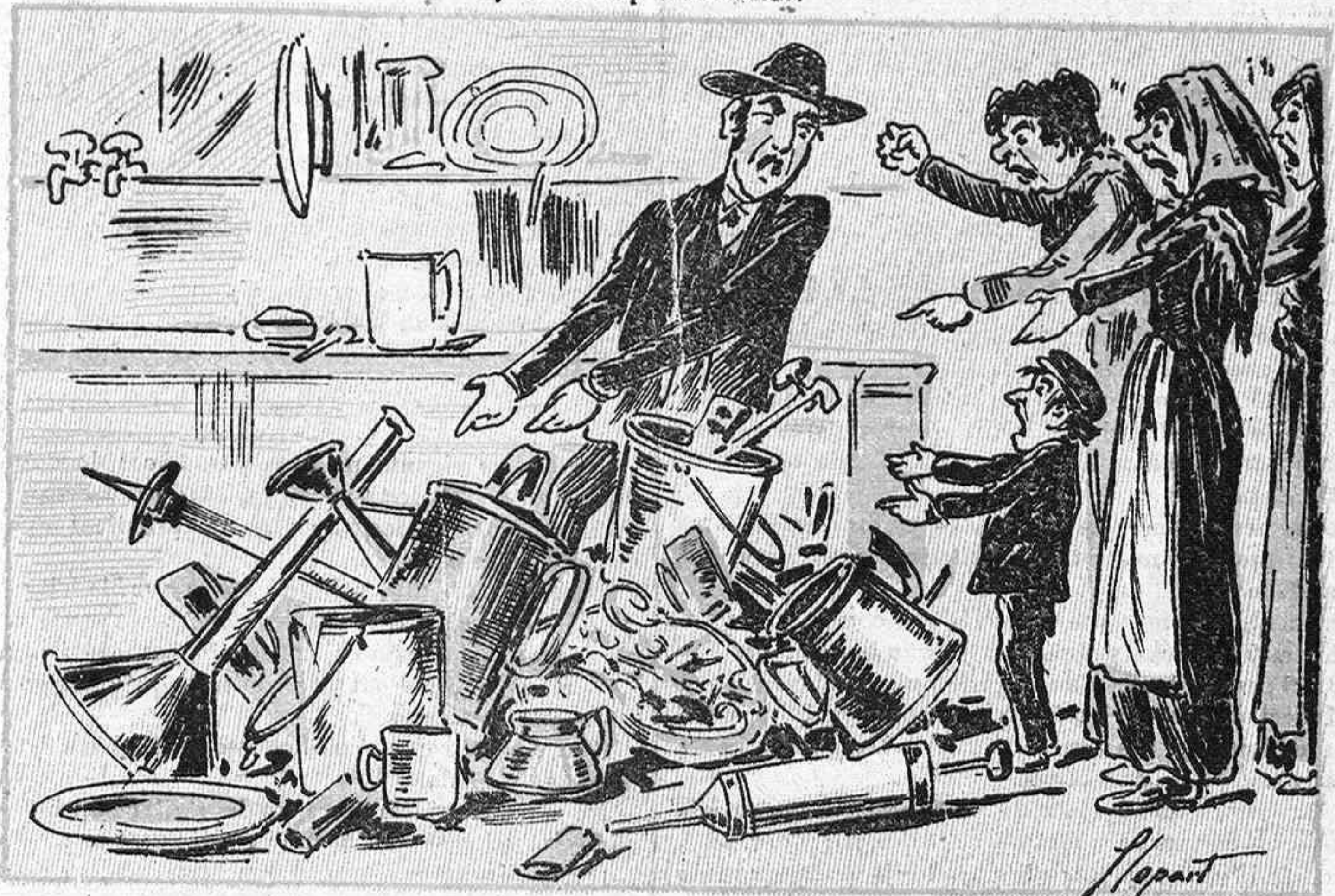
ELS PARROQUIANS DEL LAMPISTA