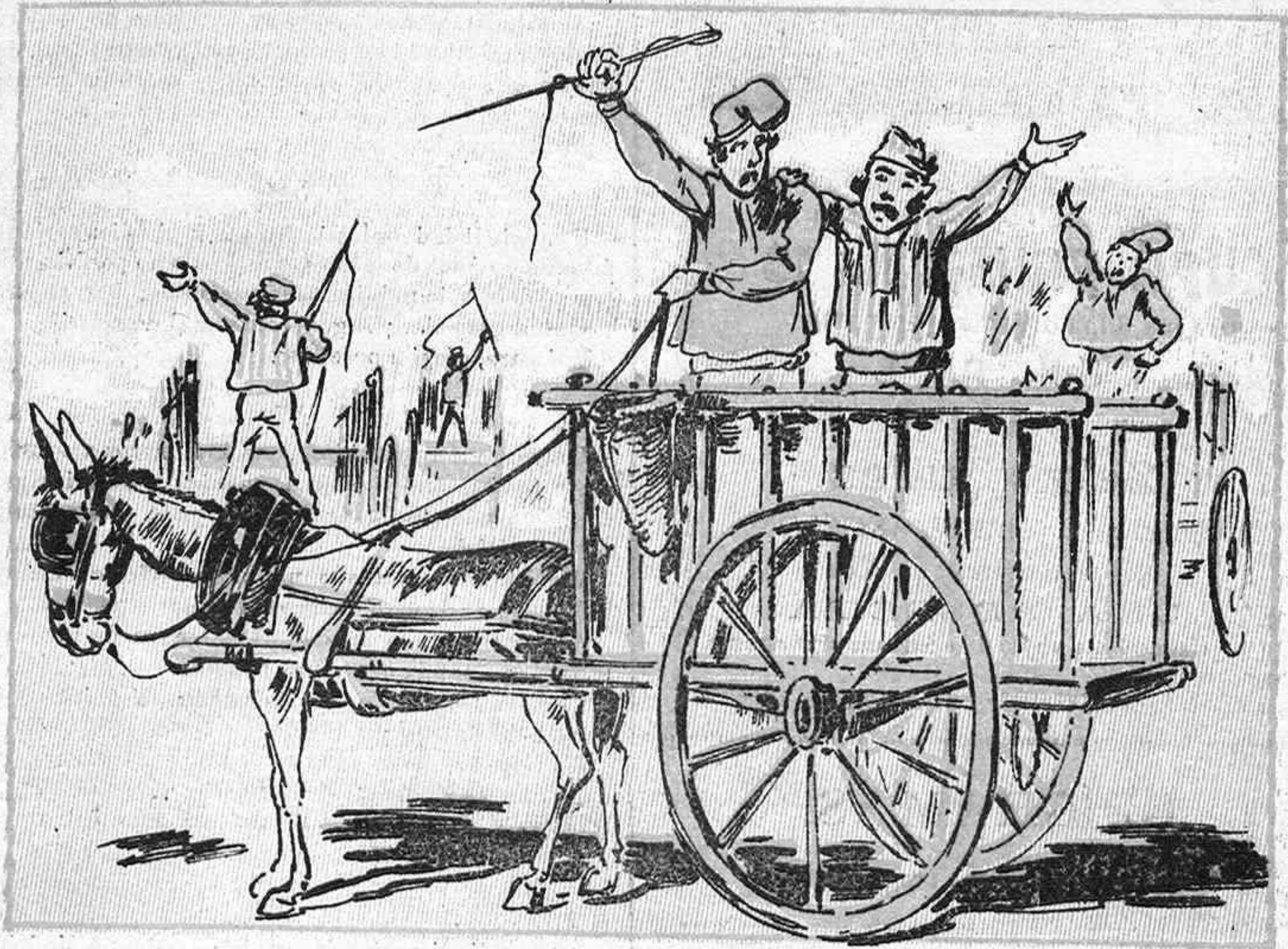
Carreter, enganxa y tira que la huelga s' ha guanyat. Carreter ¡péti la tralla! y altre cop á treballar.