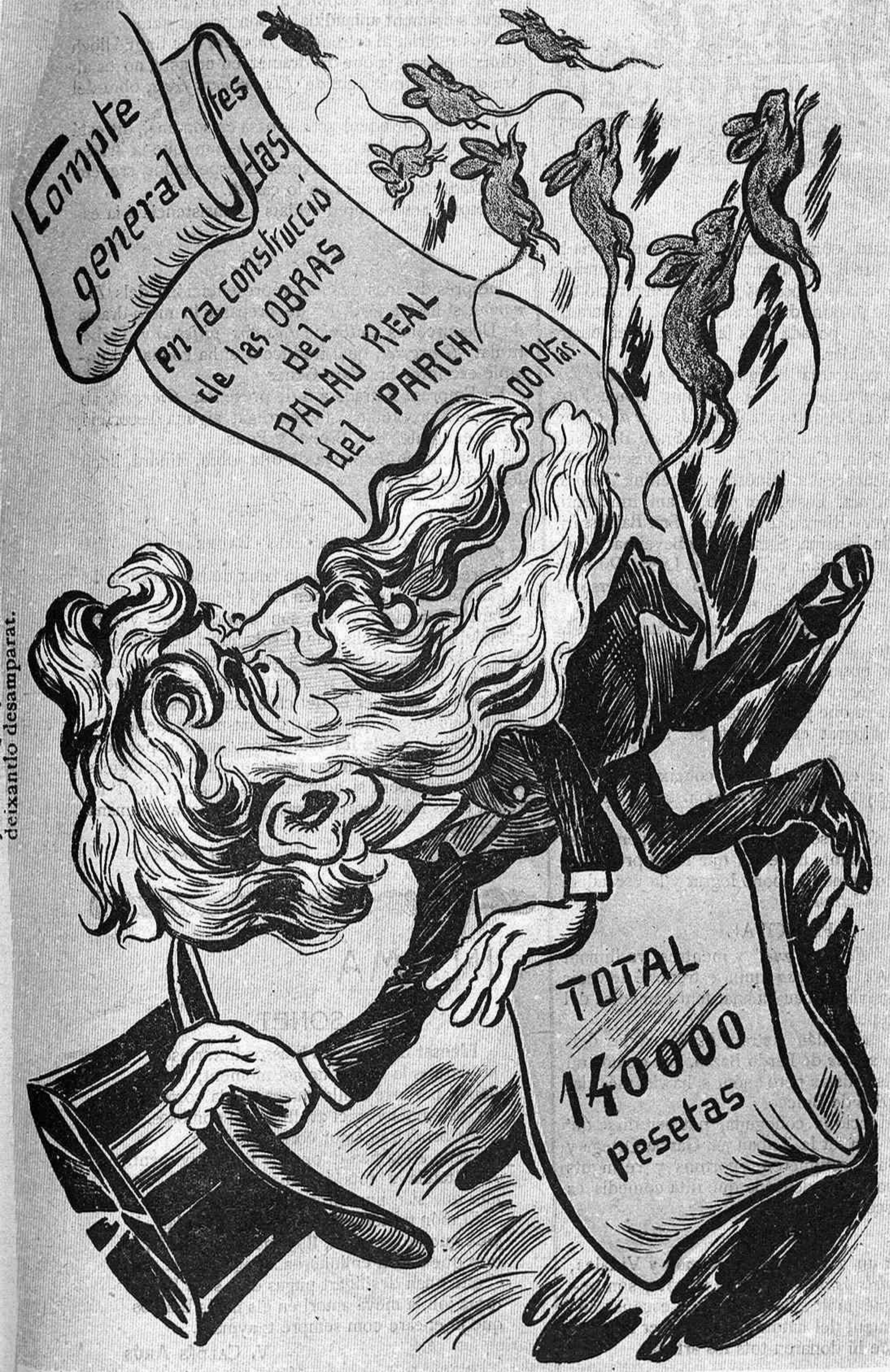
L' aixericit ex Boladeres ab frescura sens igual, diu qu' ell no vol pagá comptes que deu pagar la ciutat