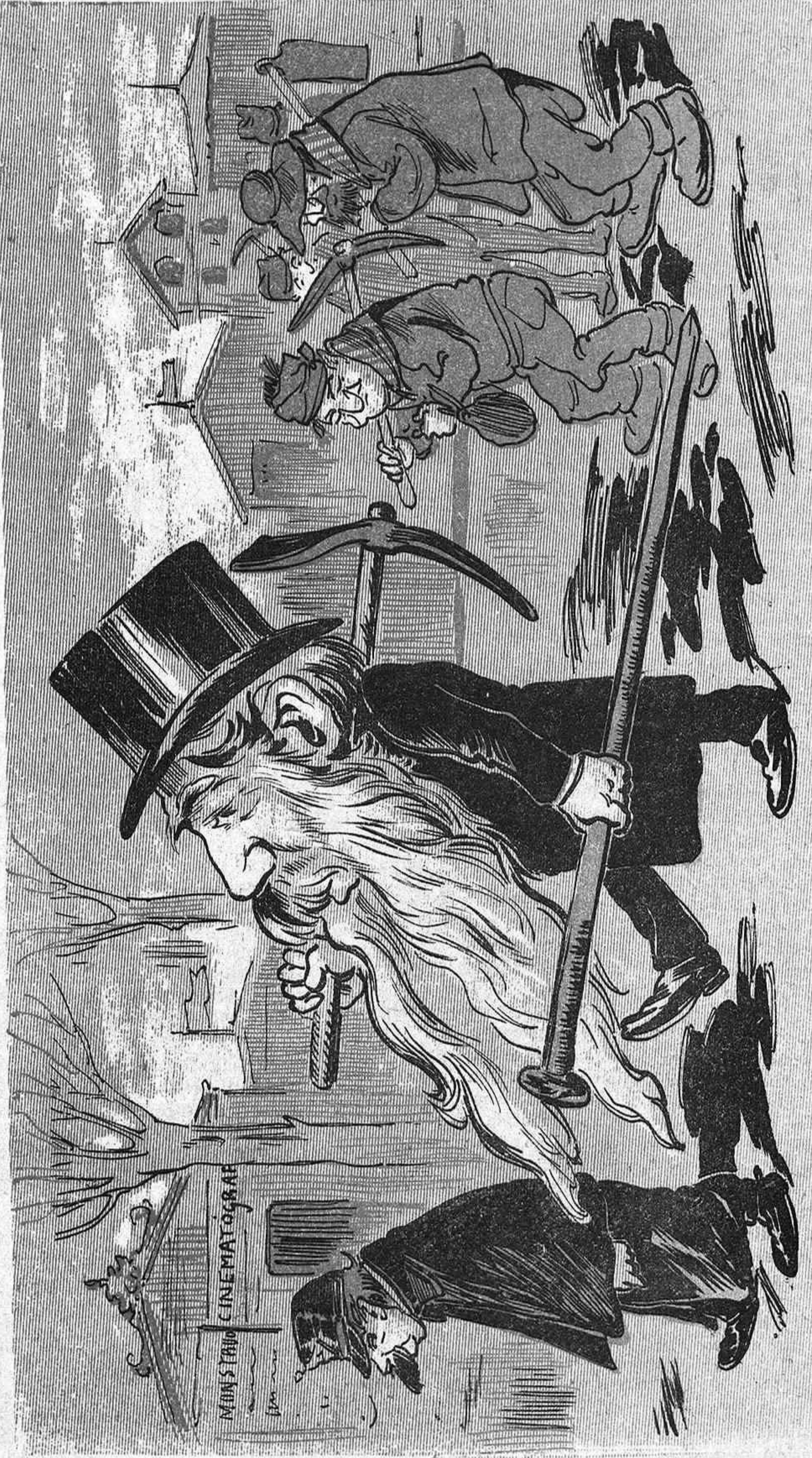
Al véure'l tan armat, tremolan de canguelo las obras ilegals que hi han al Paralelo