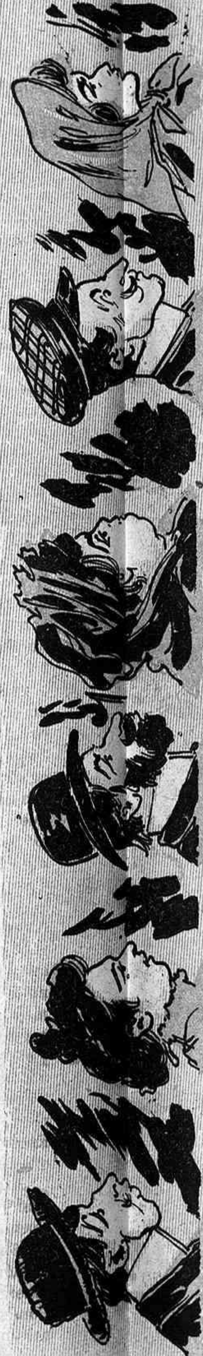
El sol escalfa 'l cos, l' hivern resta veusut, i ja sent la primavera, i' alegre joventut!