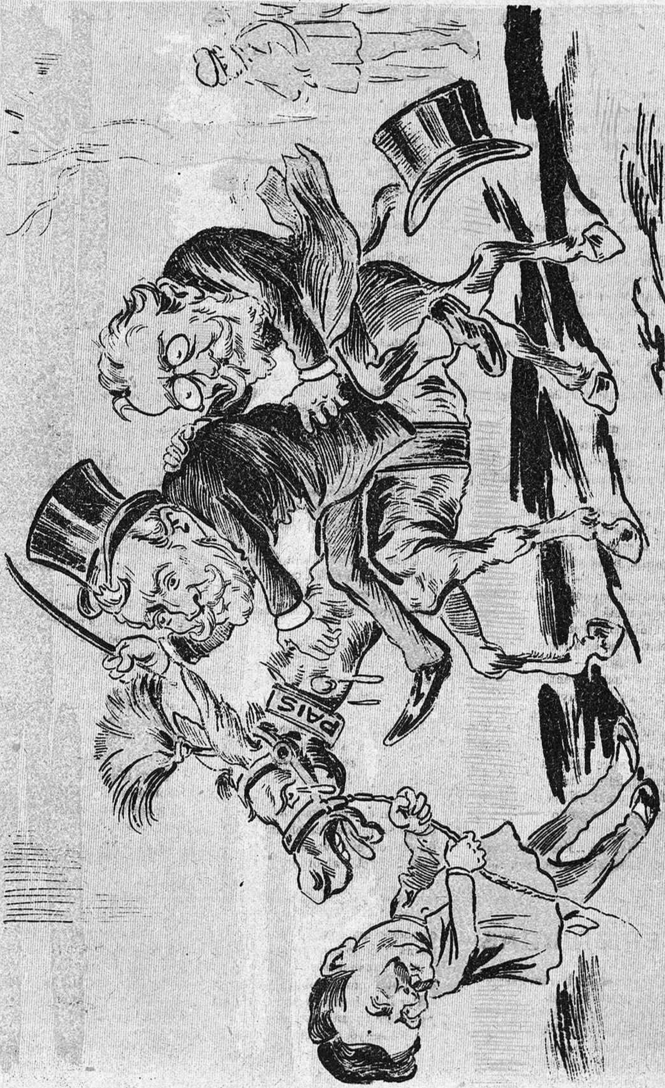
¡Pobre País! Fa molts anys que ab tu van als tres-toms la mateixa càfila de gitanos. ¡Fassi el Poble que aviat hi vagis montar ab la xicota que tu desitjas!