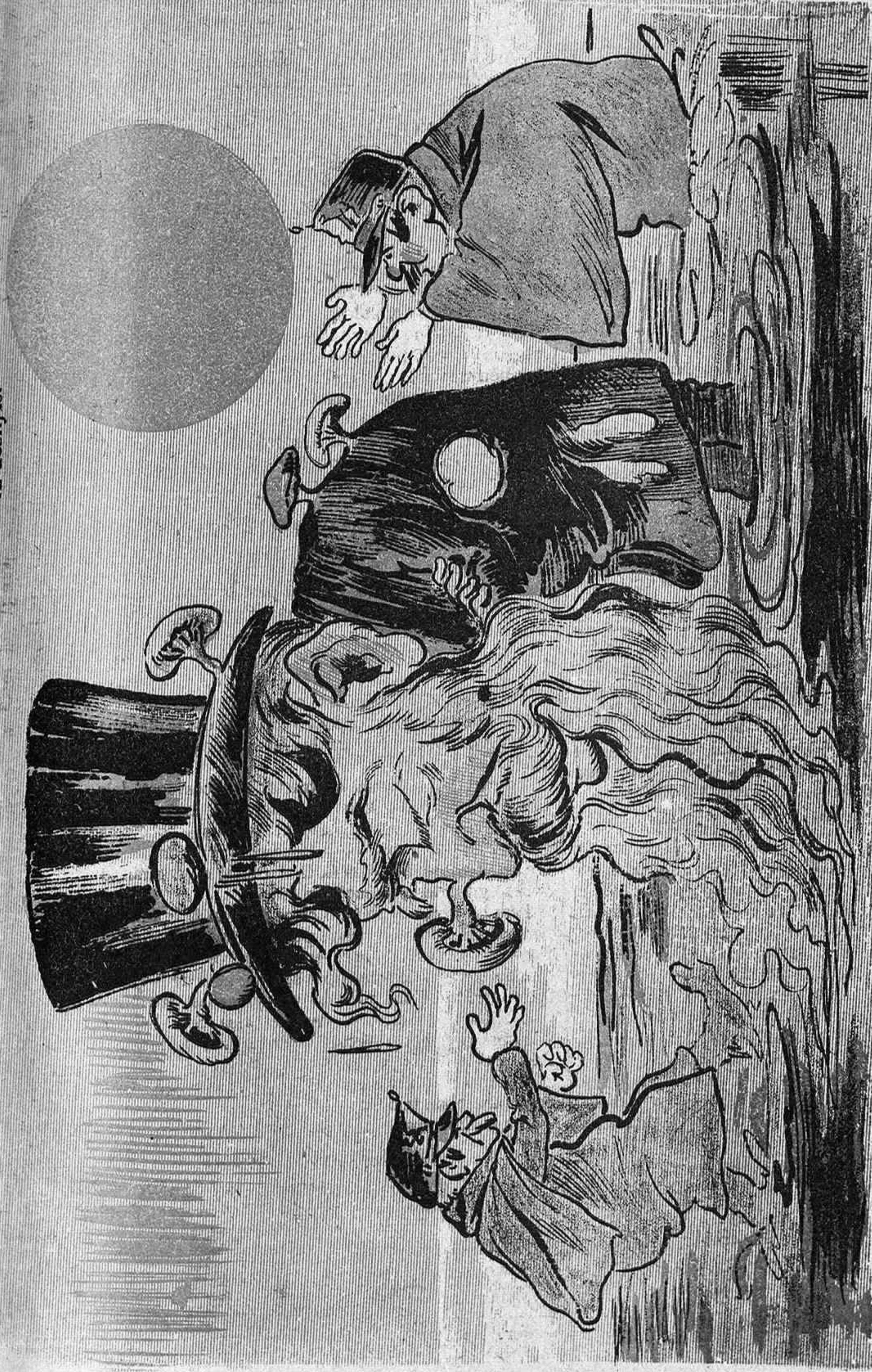
... El fang y la porqueria als carrers han invadit; fins s' hi enfonzan las patillas... ¡y el batlle, sempre dormint!