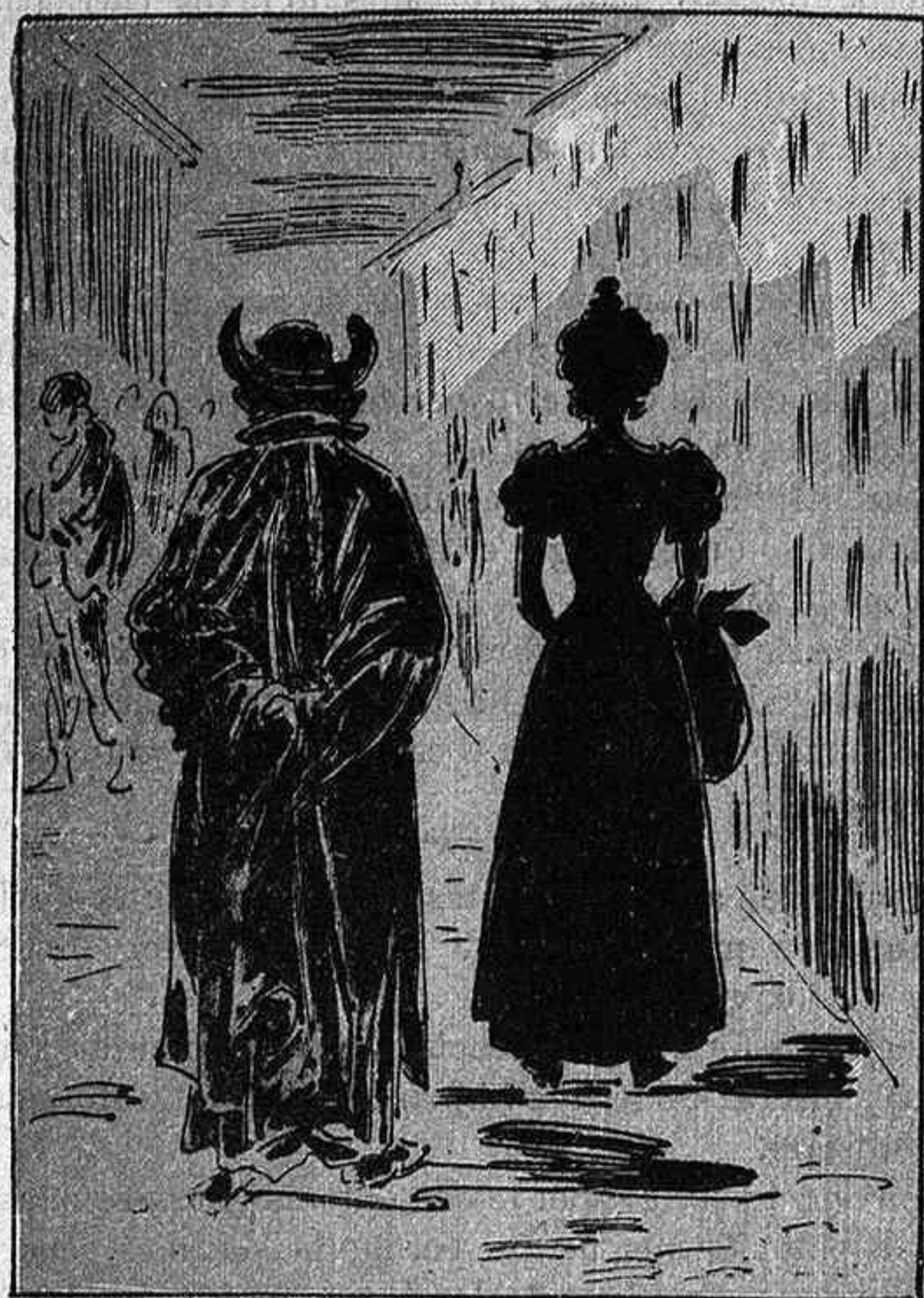
Un capellá molt salau al detrás d' una modista va pel carrer d' Aribau.