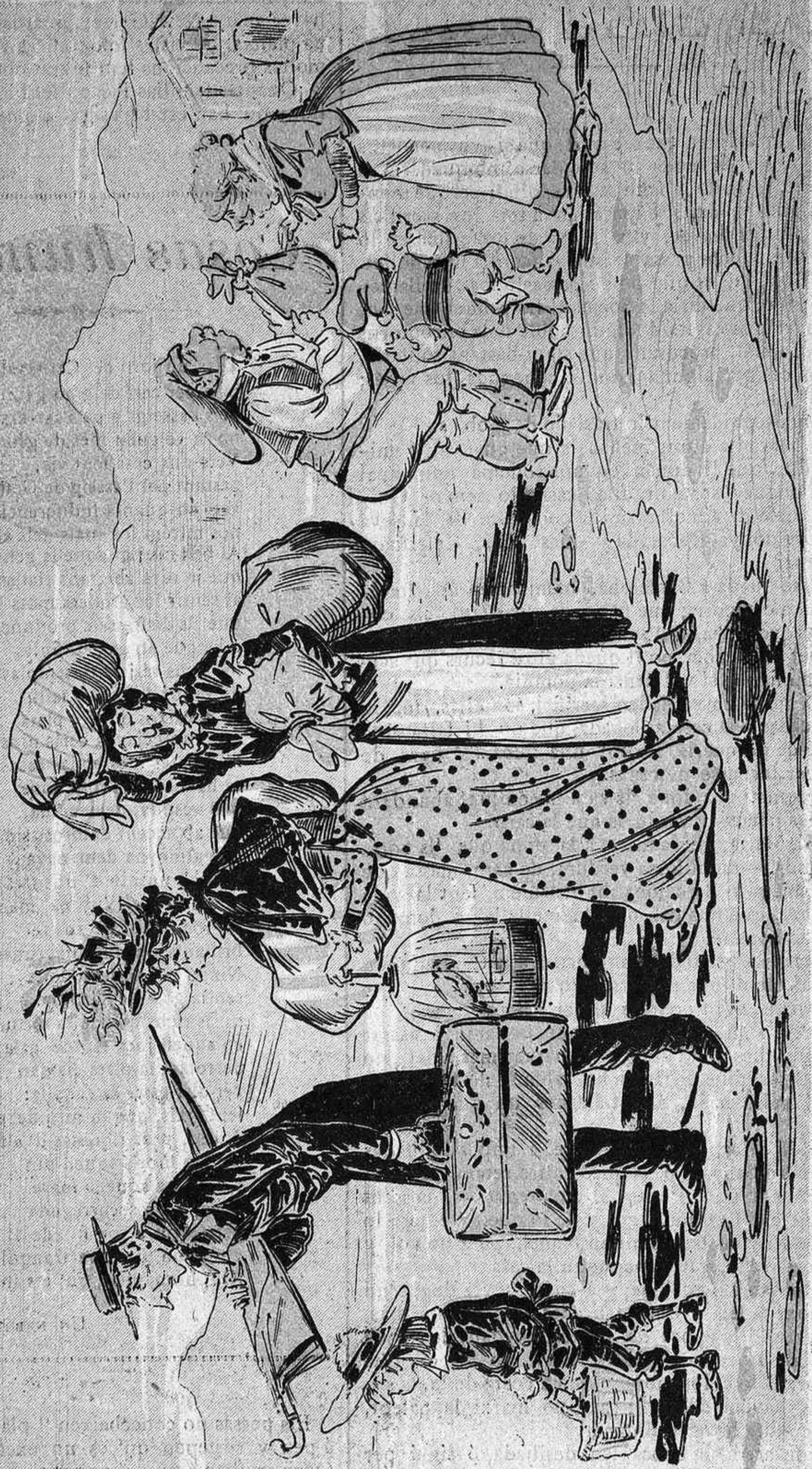
Mireuse 'ls. Son els últims exemplars de la muy distinguida colonia veraniega de Vilagreixims. Tristos, magres, carregats de pollis de gallina y de picadas de mosquit, buys de butxaca y de ventrell, retornan á la vida ciutadana. Per la lley eterna de las compensacions, la gent pagesa se 'ls ho queda tot: salut y quartos.