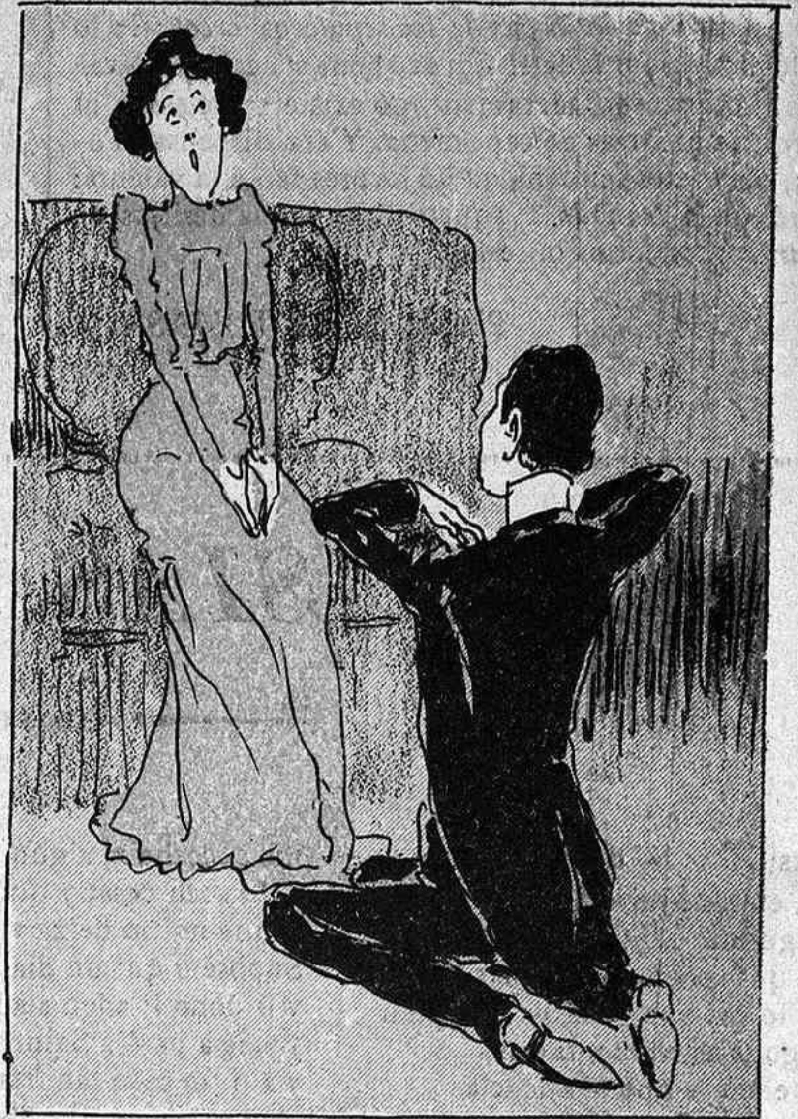
Lo poeta de cor ardent, ab un fogós parlament.