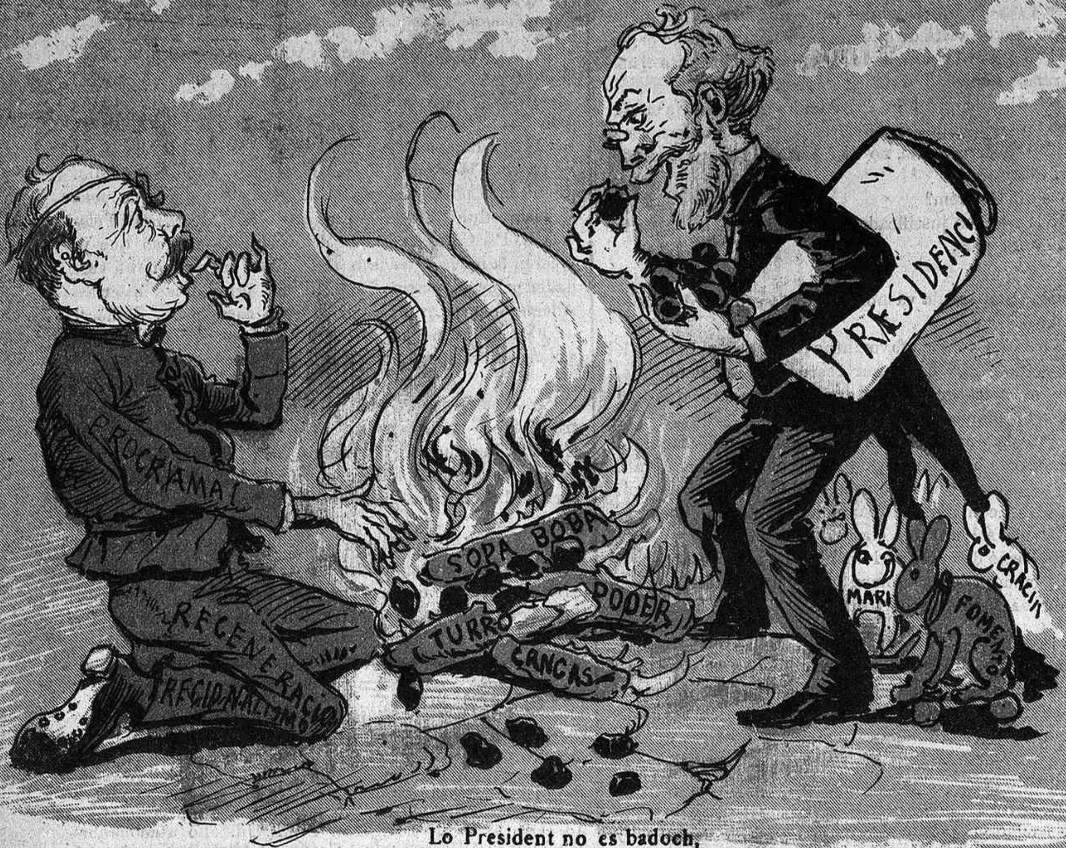
Lo President no es badoch, y valentse de sas manyas ell se menja las castanyas que l' altre li ha tret del toch.