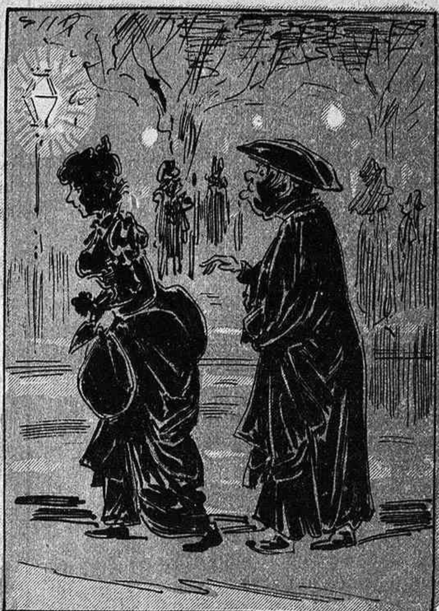
Fadrineta, la fadrina, si tu vols juntarte ab mi t' ensenyaré... la doctrina.