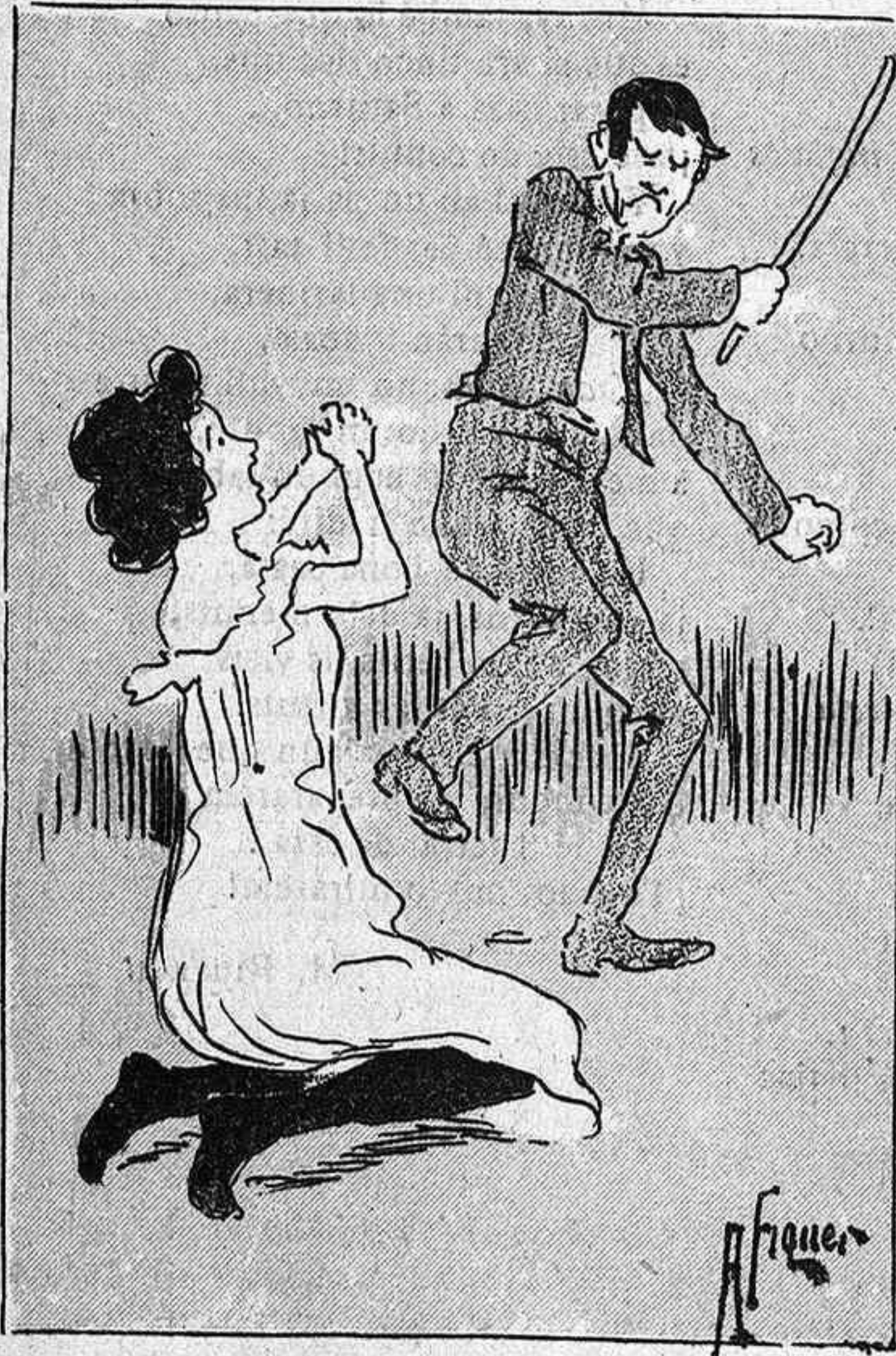
Lo pinxo de carreró, repartint cops de bastó.