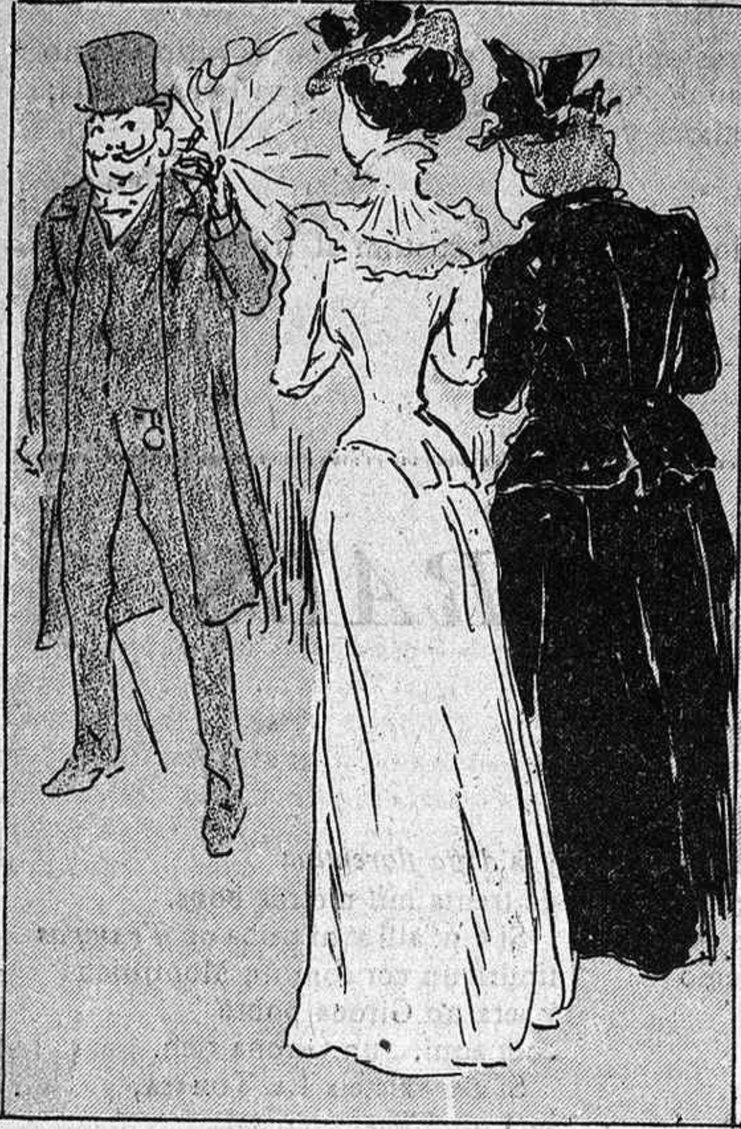
Lo riquissim comerciant, exhibint un gros brillant.