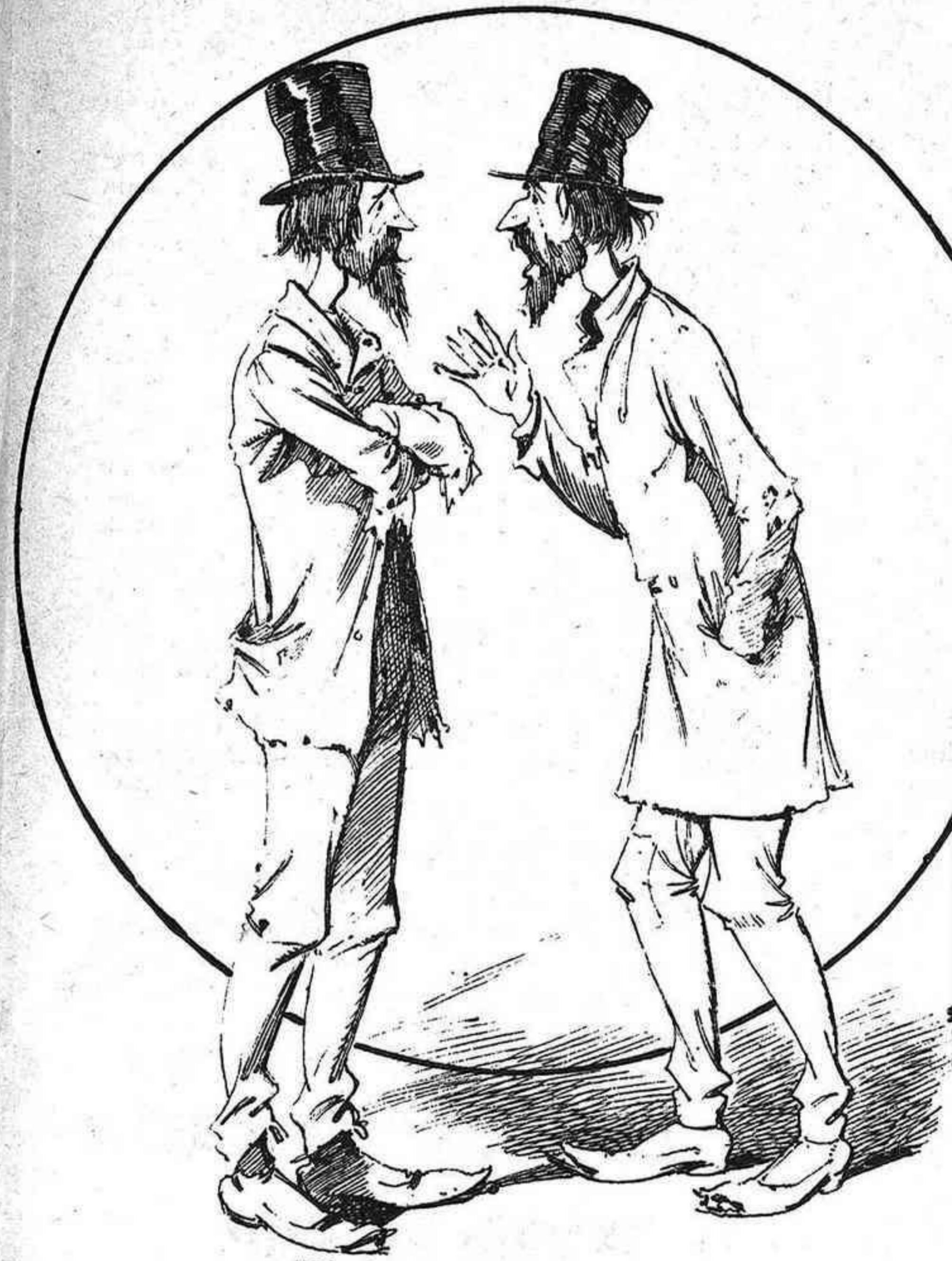
—Véndrers al mestre per trenta monedas! No digas... —Segons, home, segons... Jo soch mes católich que tú y avuy me 'l vendria per un biffsteack.