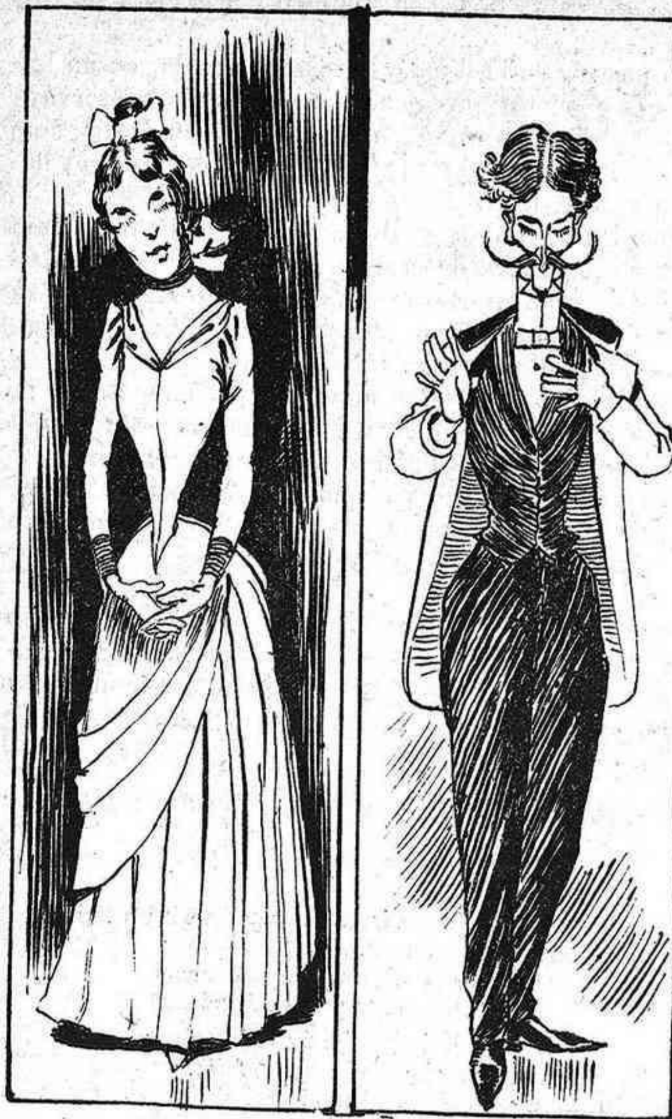
Facsimile de dos enamorats que van morir dissecats.