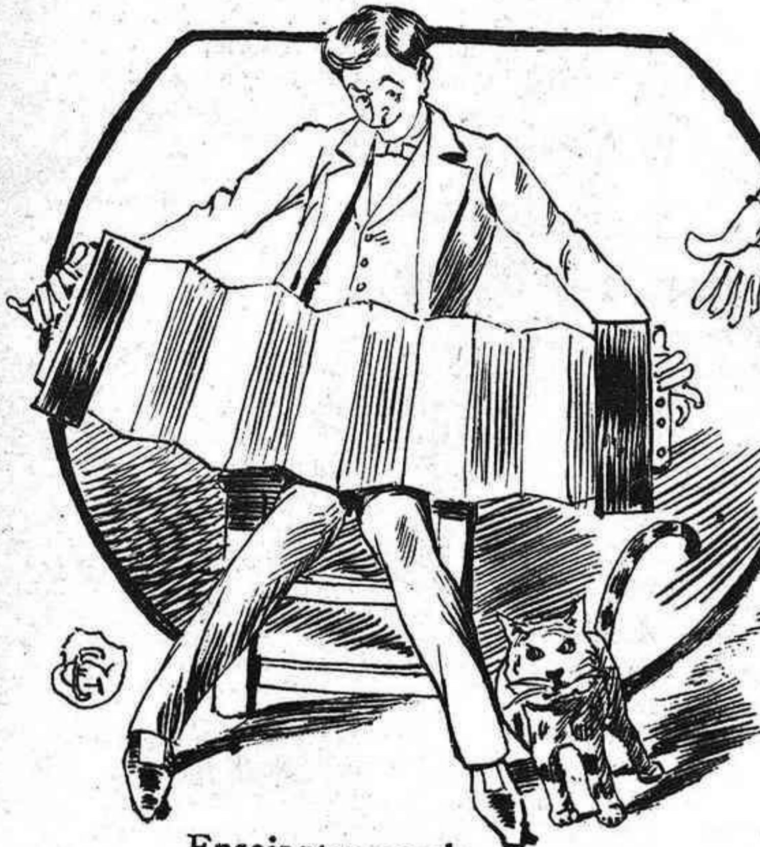
Ensejantse per la serenata d' un Marqués dimissionat .