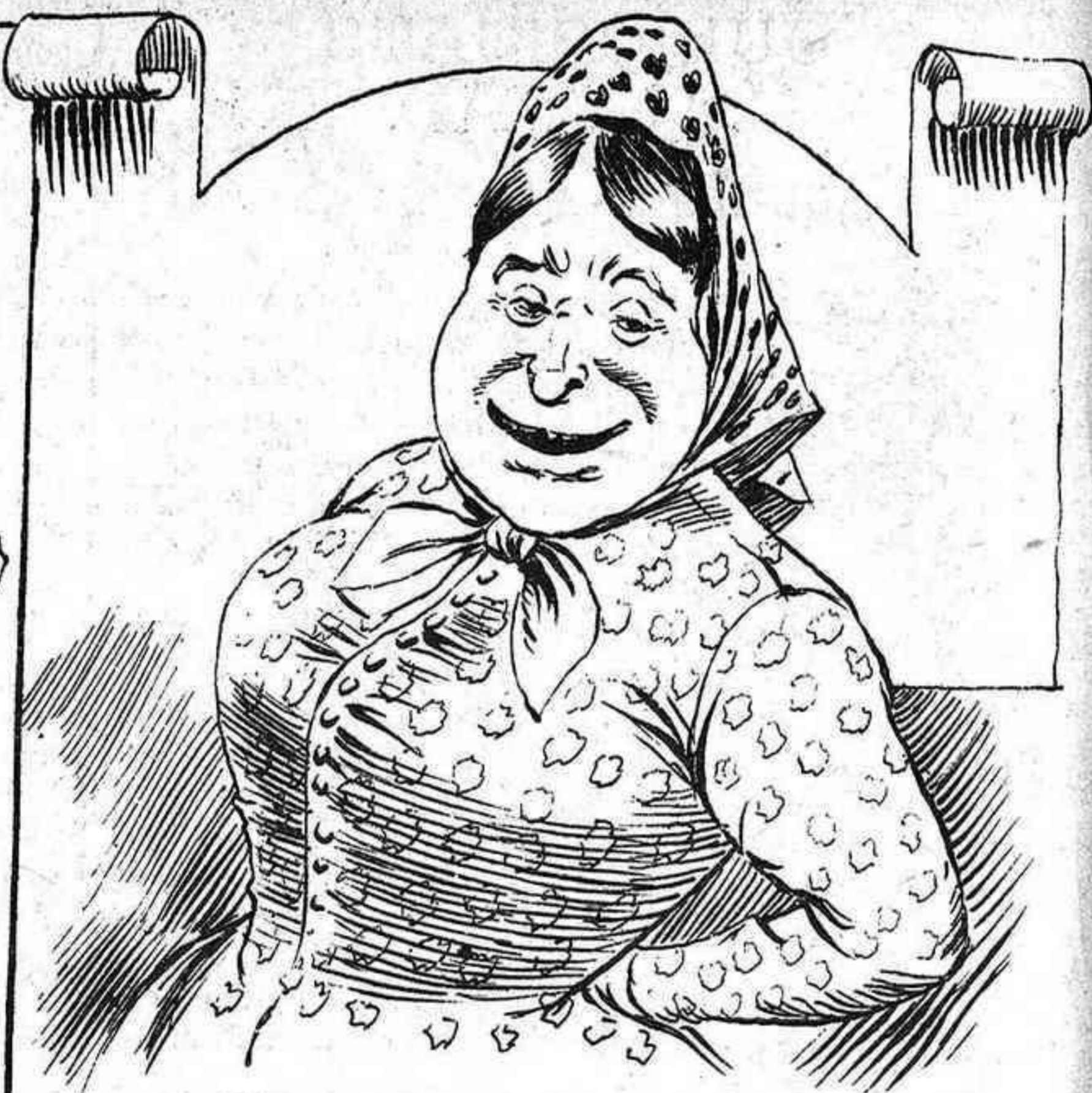
Mira qu' atrevirse á dirme que tinch la boca grossa!..