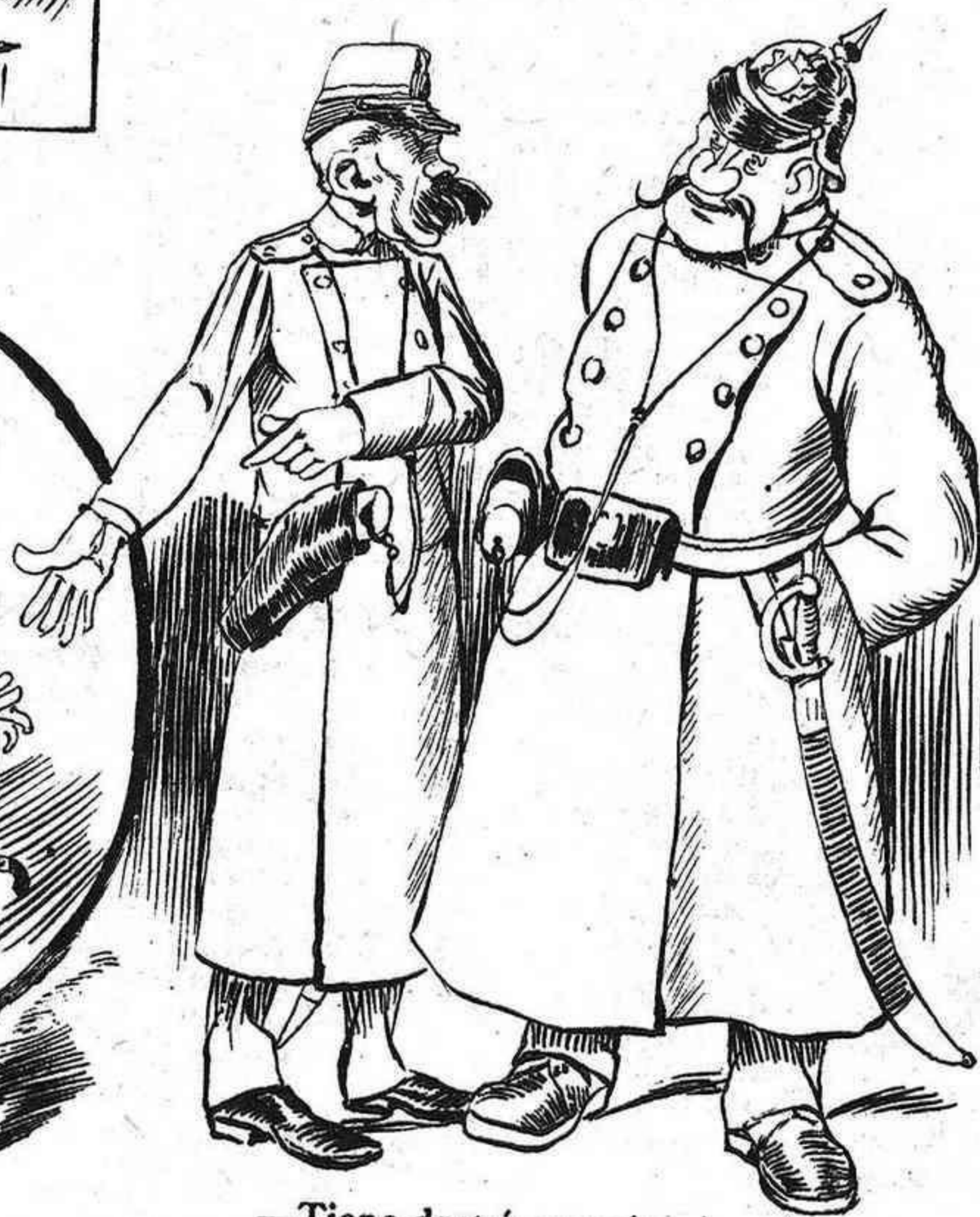
—Tiene dret á ensuciarse en la esquina aunque la casa sea suya? —Se donan casos.