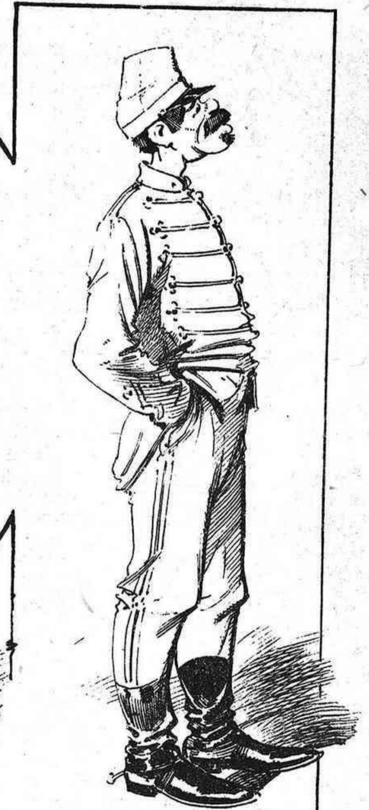
A ver... Dos pasos al frente el que ha hecho esta indecencia.