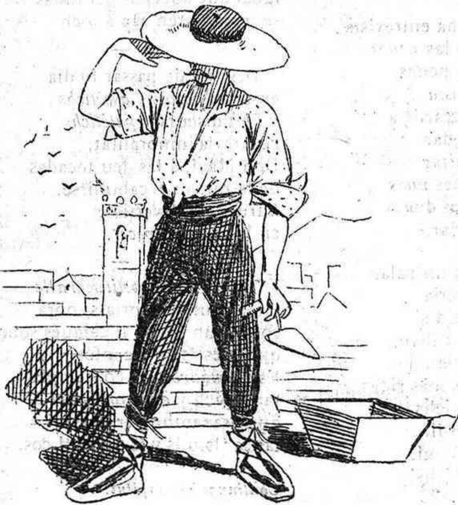
—Vaya un sol!...! si anés acompanyat....