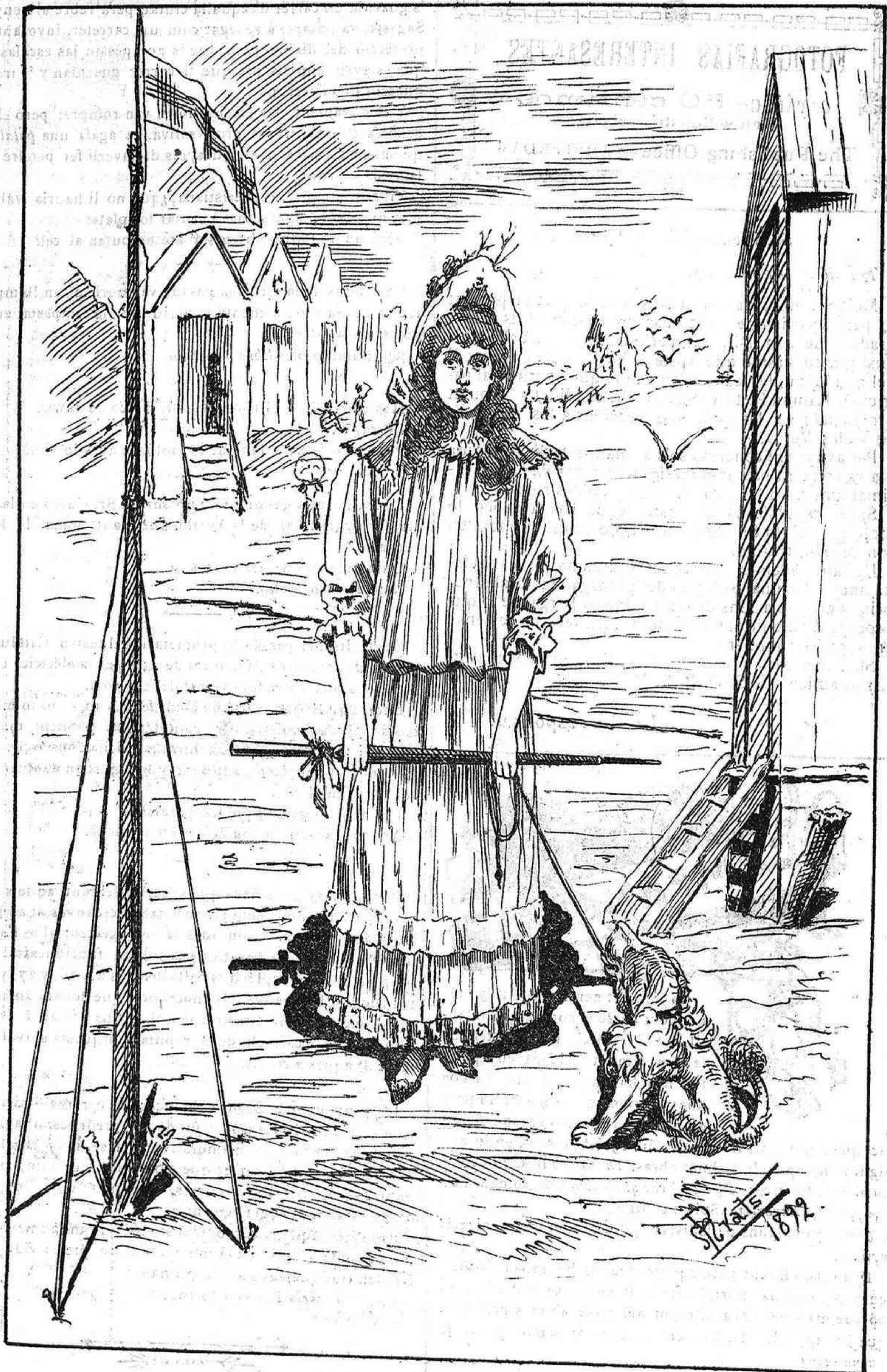
—¿Que estarán fent tant rato alli dins la tia y D. Ignasi?