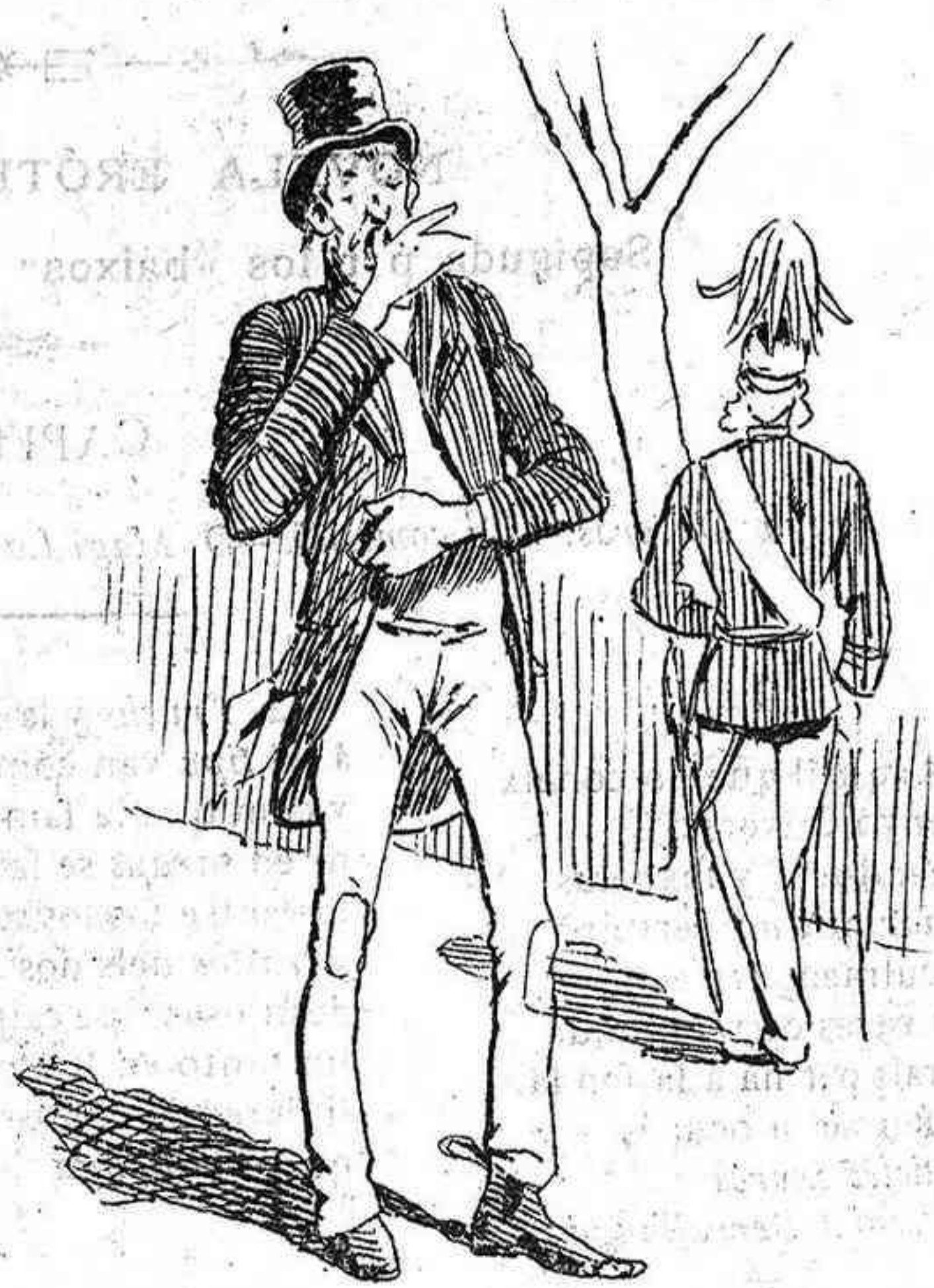
—Tothom se queixa de set .... Quina sort!.....