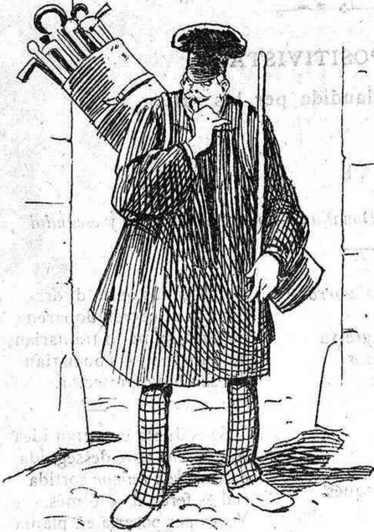
—Jo crech que no plourá may mes.