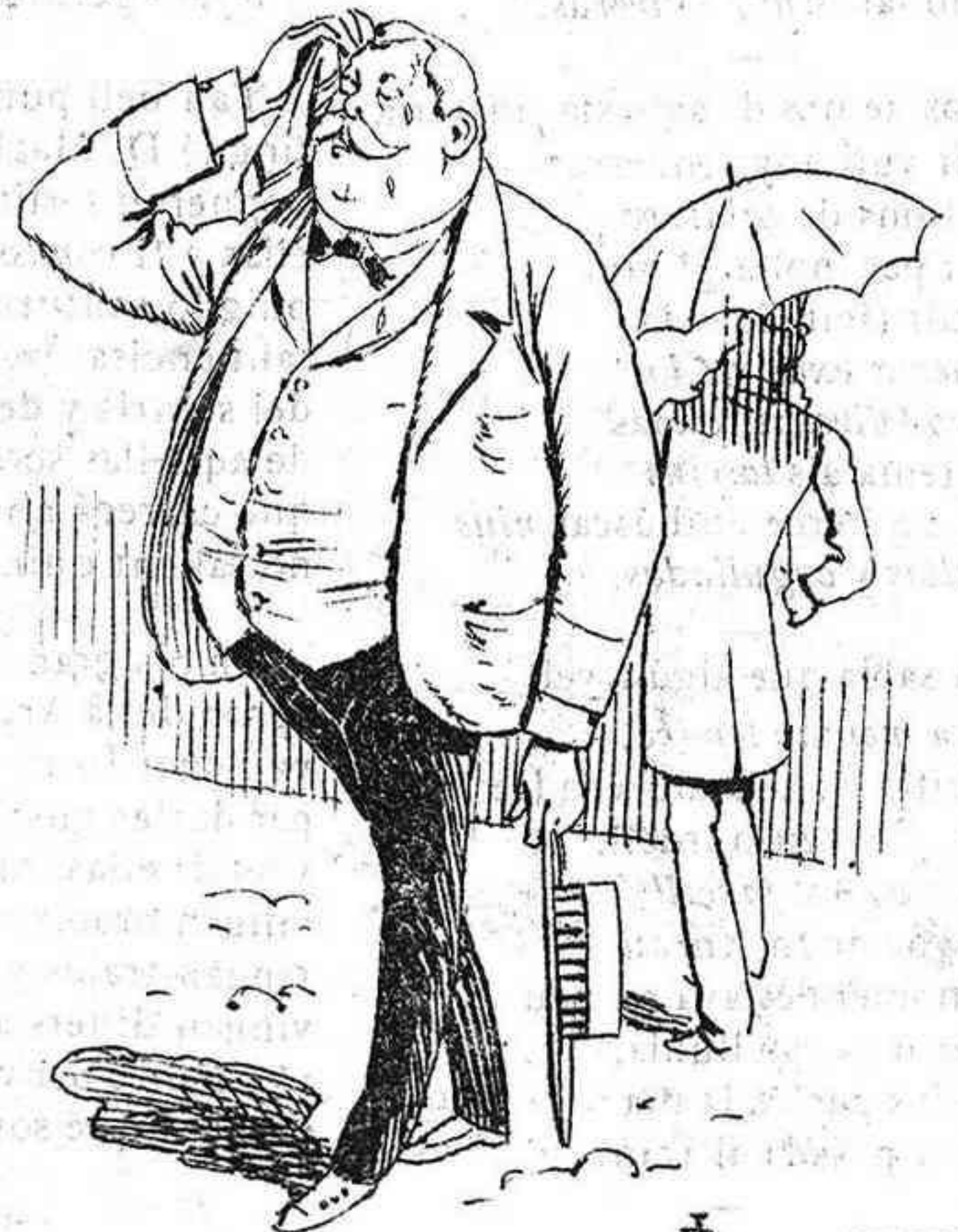
—Quin modo de suhar!.... aquell ha obert lo paraygua pensant que plovia.