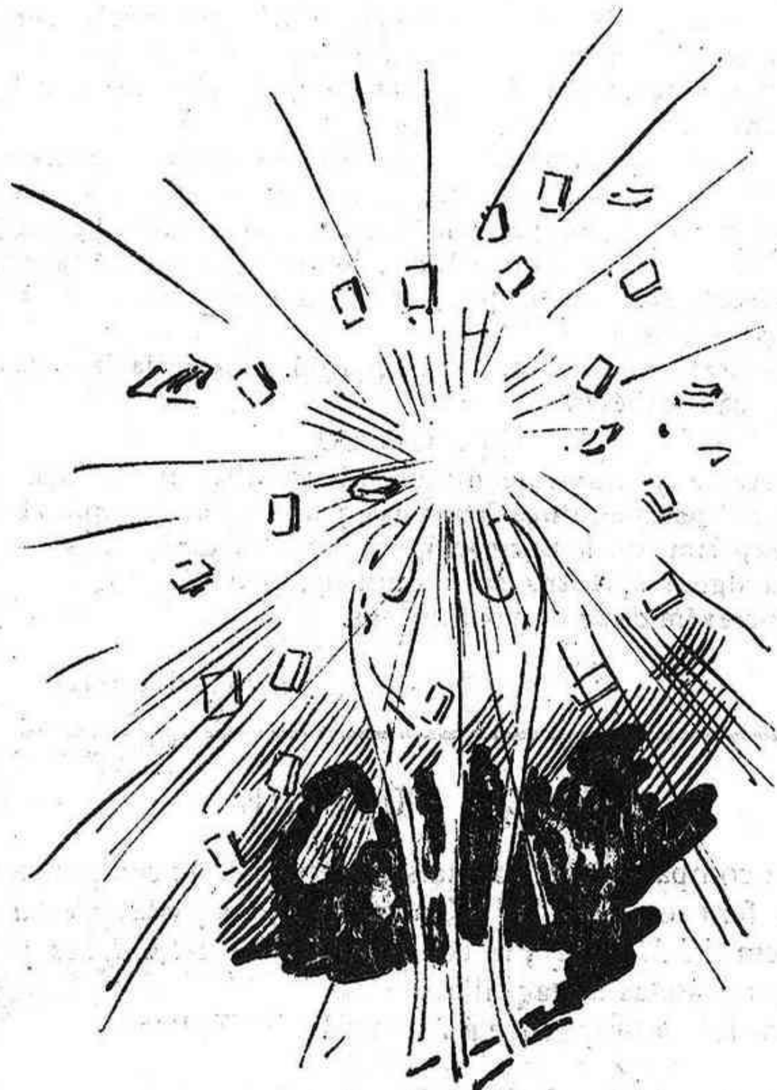
Si 'ns fan la competencia las farém sortir encesas.