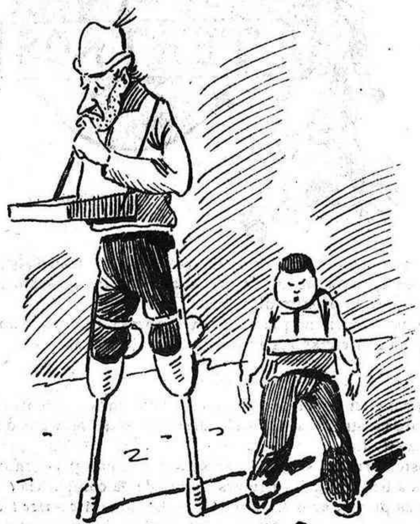
Ves si á mi 'm ferán creurer qu' á dins no hi ha ningú...